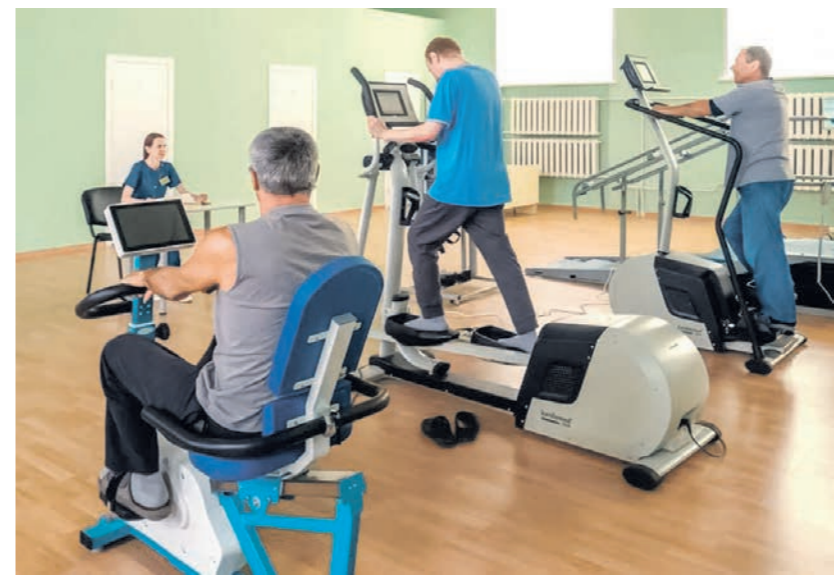
В отделении реабилитации воронежцы занимаются лечебной физкультурой

ют основные проблемы пациента, ограничивающие его возможности. В зависимости от этого корректируется программа реабилитации. При необходимости больные направляются в кабинет физиотерапевтических процедур, где могут пройти, например, кислородно-гелиевую терапию. Она хорошо себя зарекомендовала ещё в период пандемии COVID-19, помогая уменьшить кислородное голодание, нормализовать обмен веществ, улучшить эластичность сосудов, кровоснабжение всех органов и систем. — Очень важно нормализовать психику пациента, — подчёркива-