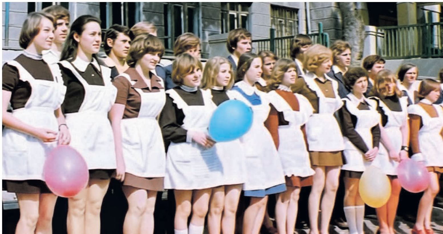
Традиции на выпускной встречать рассвет и устраивать застолья появились в конце 60-х годов

Дефицитом было абсолютно всё, поэтому сборы становились эпопеей. Повезло тем, у кого родственники могли выехать за границу или жили в Москве. Там удавалось доставать красивые ткани или покупать готовые платья