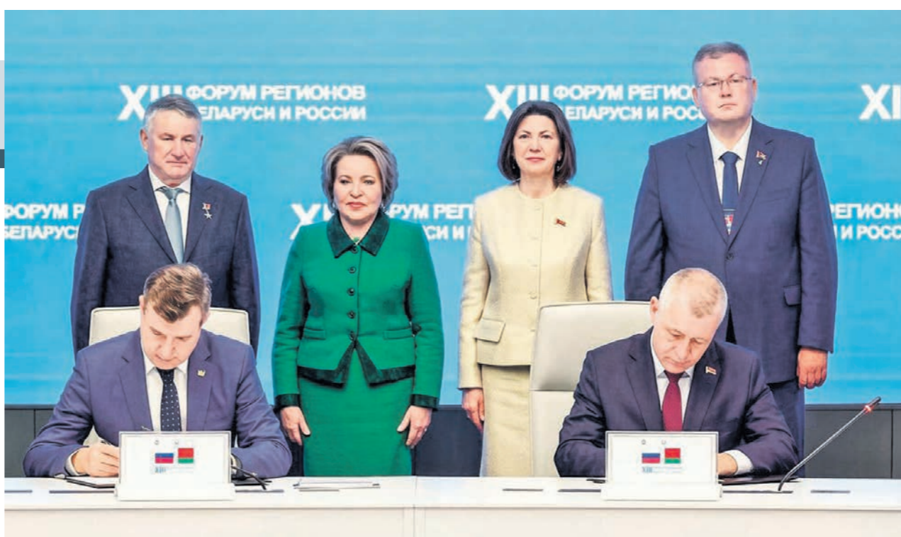
На Форуме регионов РФ и Беларуси было подписано соглашение о взаимодействии между правительством Воронежской области и ГК «БелИнжиниринг» о возведении крупных инфраструктурных и социальных объектов

В целом объём внешней торговли в 2025 году по отношению к 2024-му увеличился почти на 30%. Кроме того, Воронежская область