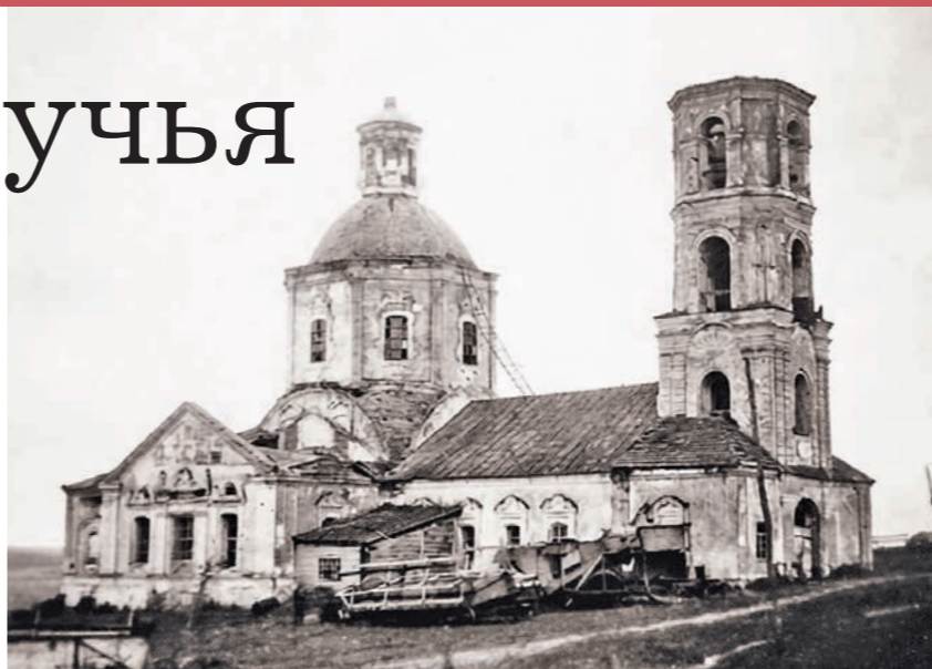
Покровская церковь в Костёнках была взорвана в 60-е годы

Выходит, что и село существовало здесь задолго до основания крепости. Её, кстати, возвели для защиты от крымского ханства, а Костёнск стал одним из укрепленных городков Белгородской засечной черты, в которую также входил Воронеж.