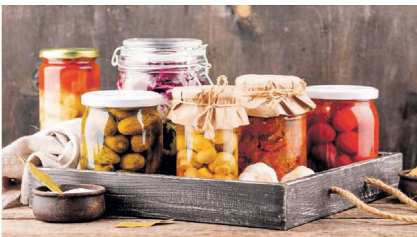
Иногда причиной заражений ботулизмом становятся домашние заготовки

Ботулизм – острое инфекционное заболевание, связанное с употреблением в пищу продуктов, в которые попал токсин Clostridium botulinum. 10% почвы содержат споры этой бактерии. При низком содержании кислорода, наличии питательных веществ, благоприятной температуре (+28–35 градусов по Цельсию) она вырабатывает сильный биологический яд, который сохраняет свою активность