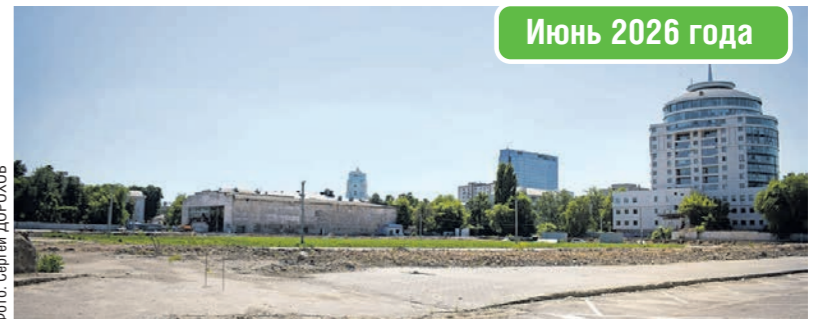
Июнь 2026 года