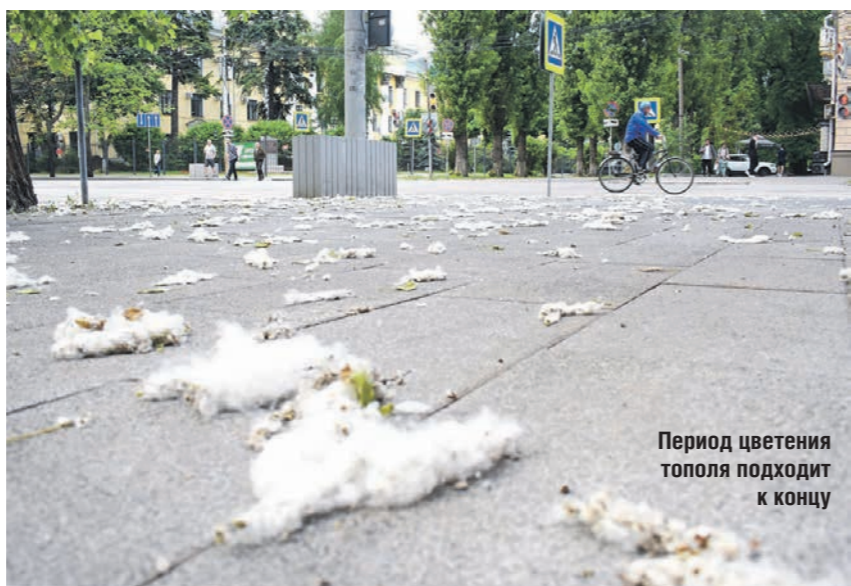
Период цветения тополя подходит к концу