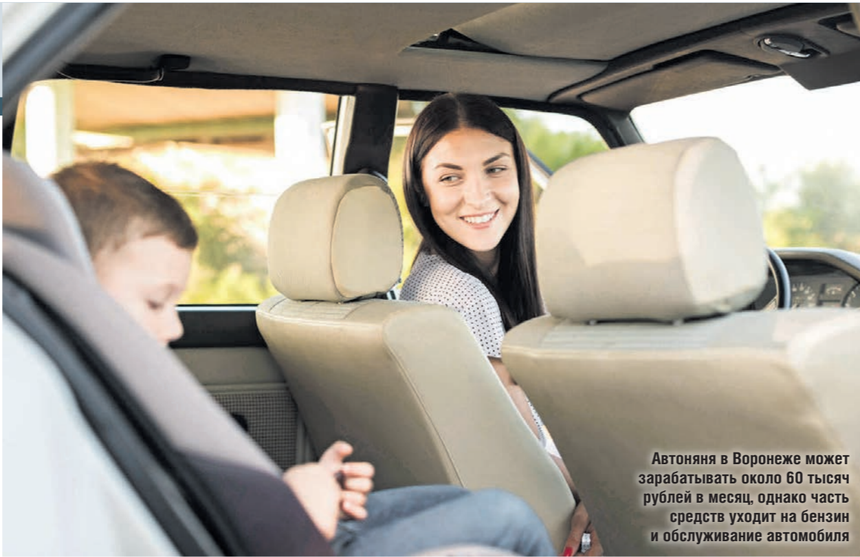
Авто няня в Воронеже может зарабатывать около 60 тысяч рублей в месяц, однако часть средств уходит на бензин и обслуживание автомобиля