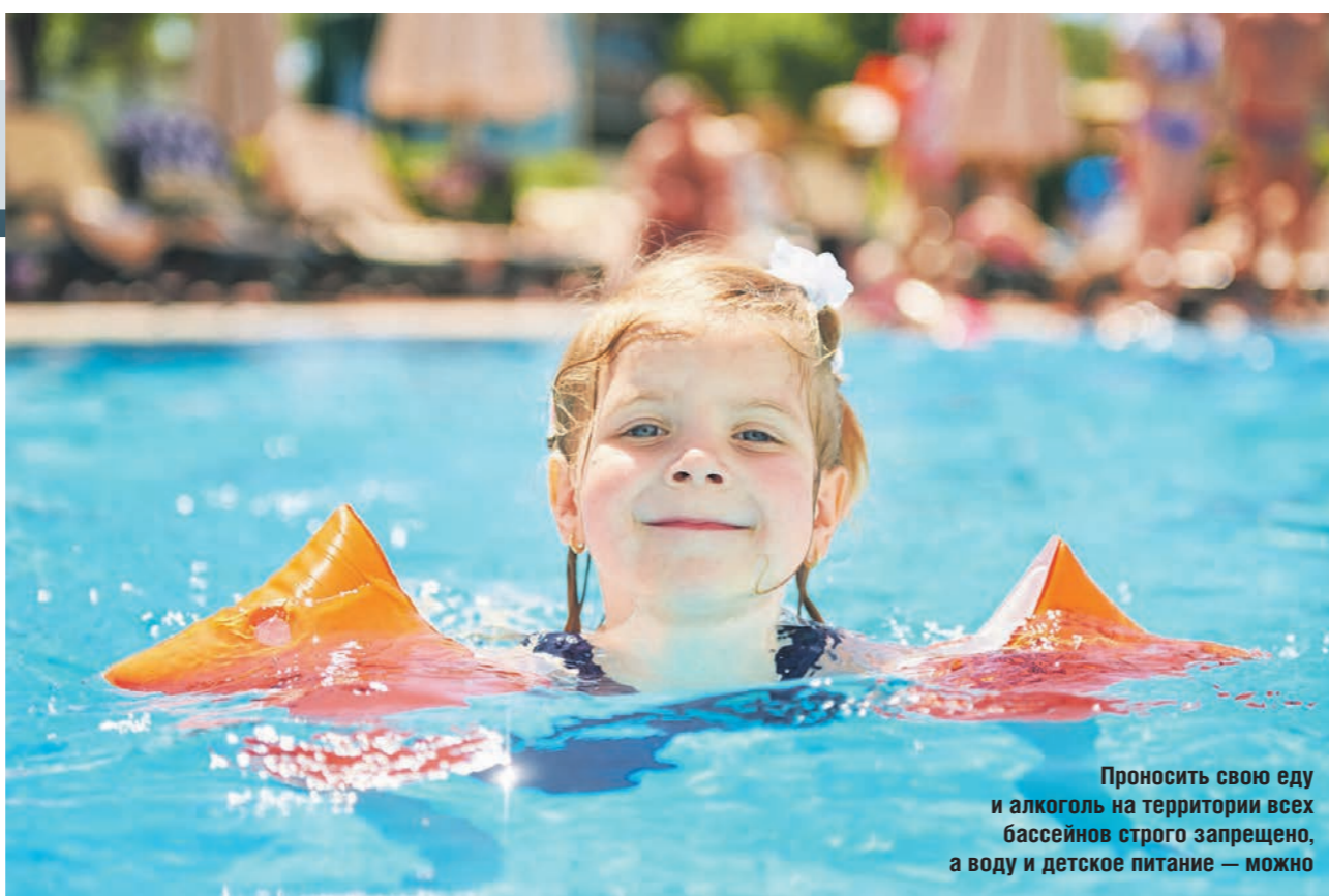
Прносить свою еду и алкоголь на территории всех бассейнов строго запрещено, а воду и детское питание — можно

В жаркий день возможность выбрать-ся на берег реки или пруда есть не у каждого. Да и качество воды в воронежских водоёмах оставляет желать лучшего. Поэтому летом у горожан популярны бассейны под открытым небом, вода в которых проходит регулярную дезинфекцию. «Коммуна» подготовила обзор основных открытых бассейнов, расположенных в Воронеже и вблизи него.