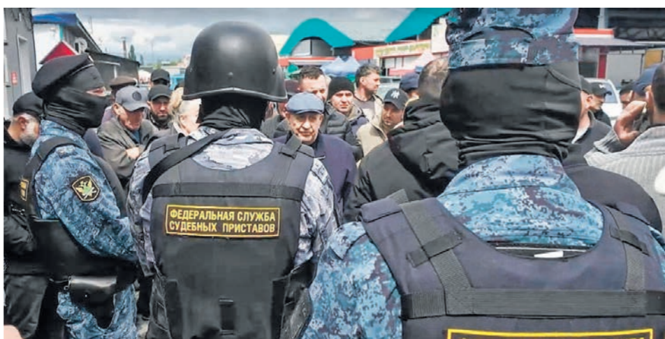
После появления на рынке судебных приставов торговля была приостановлена

Закрытый на месяц Алексеевский рынок спустя сутки возобновил работу