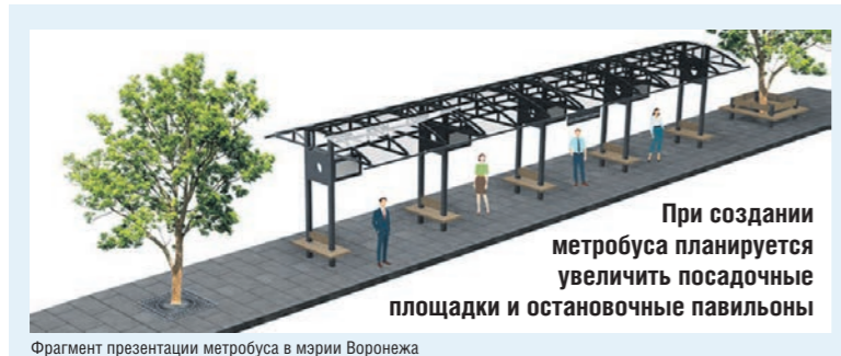
Фрагмент презентации метробуса в мэрии Воронежа

дом с ними накопительных площадок для пассажиров и создание к ним пешеходных переходов. Это неизбежно вызвало бы масштабные работы по переносу коммуникаций и потребовало большого расхода средств и дополнительного времени. В итоге победил здравый смысл, и для метробуса решили отвести правую полосу, ту самую, которая уже выделена для общественного транспорта. — Инженерного определения того, что является метробусом, не существует,— пояснил решение эксперт.— В нашем случае метробусом станет серьёзная модернизация выделенки с меньшими возможностями для автомобилистов нарушать правила движения на полосе для общественного транспорта. В итоге метробус увеличит скорость автобусов и троллейбусов на 15%.