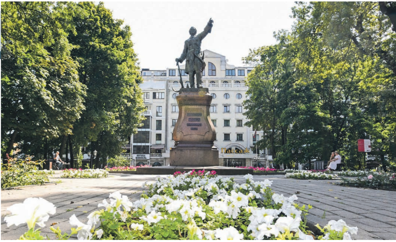
За несколько дней до завершения голосования лидером оставался Петровский сквер

Проект «Формирование комфортной городской среды» предусматривает, что к 2030 году в России благоустроят не менее 30 тыс. общественных территорий, а в малых городах и исторических поселениях реализуют как минимум 1,6 тыс. проектов-победителей Всероссийского конкурса лучших проектов создания комфортной городской среды.