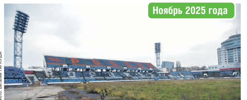
Ноябрь 2025 года