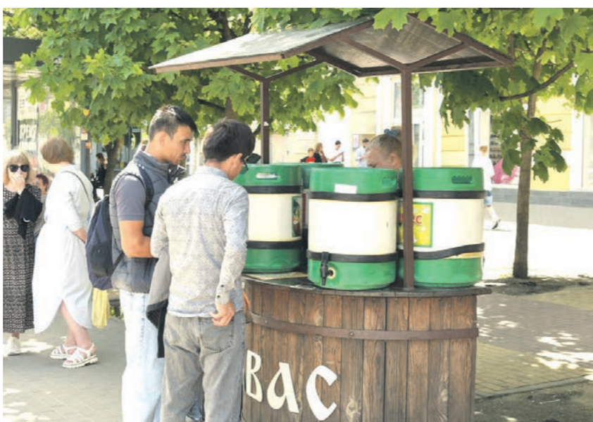
Продавцам кваса в Воронеже обещают платить 1200 – 2200 рублей за смену

Где и сколько воронежцы могут заработать летом