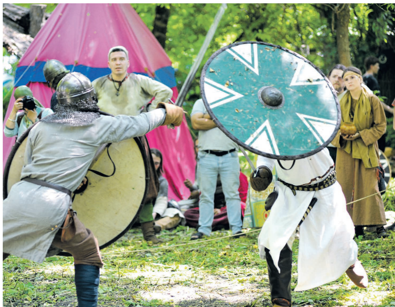
Реконструкторы воссоздали битву русичей с варягами