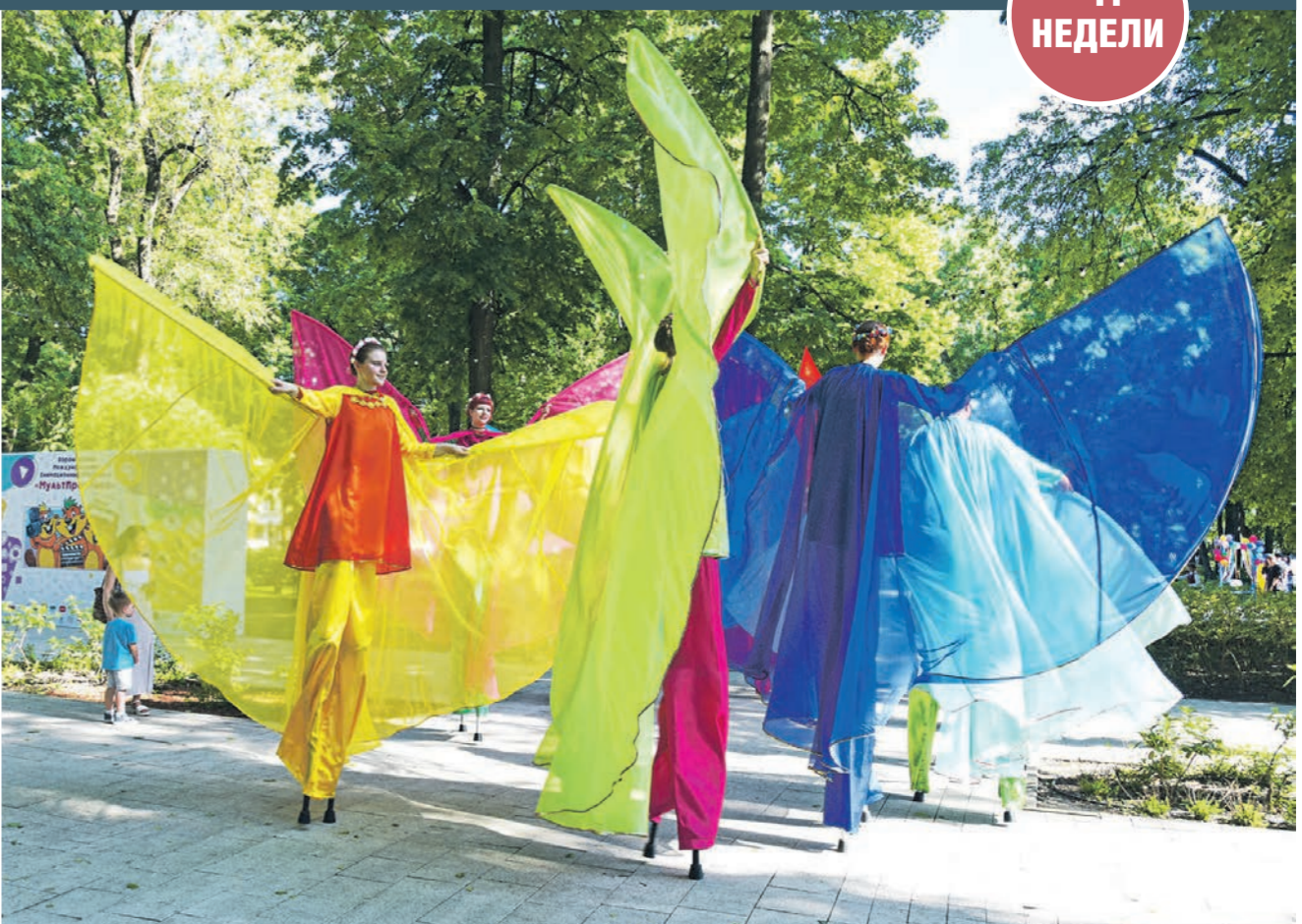
В Воронеже завершился Международный фестиваль «МультПрактика». О том, как он проходил, читайте на стр. 6

1. А) Кота. 2. В) Космическим архитектором. 3. В) «Мишкина каша». 4. В) Кенгуру. 5. В) «Мы в ответе за тех, кого приручили». 6. В) В сказочной стране. 7. В) Подсолнух. 8. Б) Элли. 9. В) Рогатка. 10. В) Порыбачу на пруду.