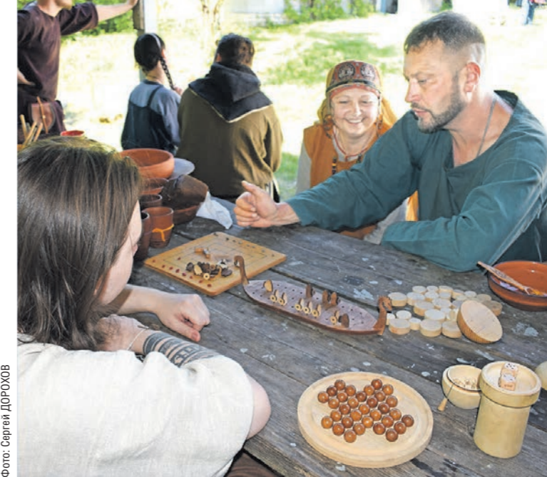
В лагере реконструкторов гаджеты были под строгим запретом, поэтому участники коротали время за старинными играми