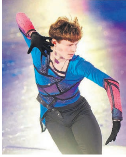
Костюмы воронежских мастеров принесли фигуристу Илье Малинину удачу на международных соревнованиях