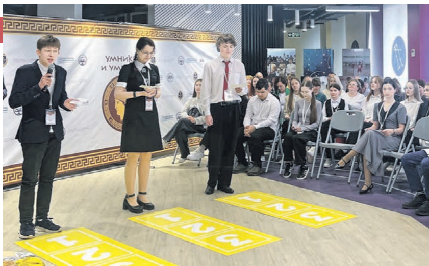
Юрий Вяземский любит бывать в Воронеже и утверждает, что в нашем городе много умной и талантливой молодёжи

Ведущий телешоу «Умницы и умники» Юрий Вяземский в прошлом году уже приезжал лично отбирать участников для своей программы. В этот раз перед началом игры Юрий Павлович сказал, что очень любит бывать в нашем горо-