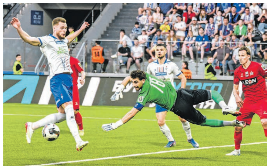
В матче с Хабаровском «Факел» так и не смог реализовать свои моменты