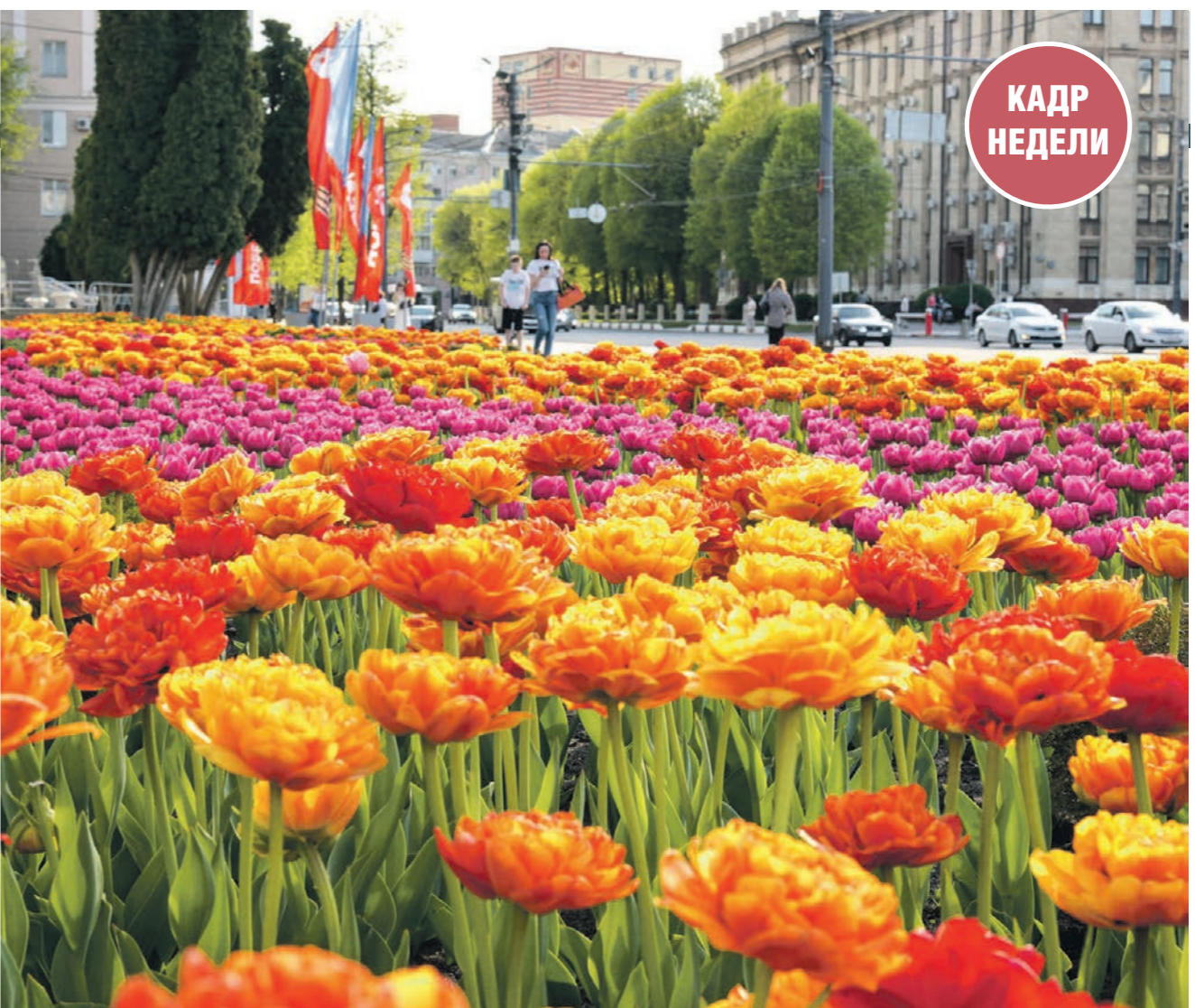
К майским праздникам в центре Воронежа высадили около 10 тысяч однолетних цветов

ОТВЕТЫ 1. Б) Первооткрыватель 2. А) Надежда Крупская 3. В) Звено 4. Г) Павел Морозов 5. В) О красных 6. А) Четырёхлетний мальчик 7. В) «Пищевлок» Алексея Иванова (16+) 8. Г) Аркадий Гайдар 9. В) Кикимора 10. В) Евгений Евстигнеев