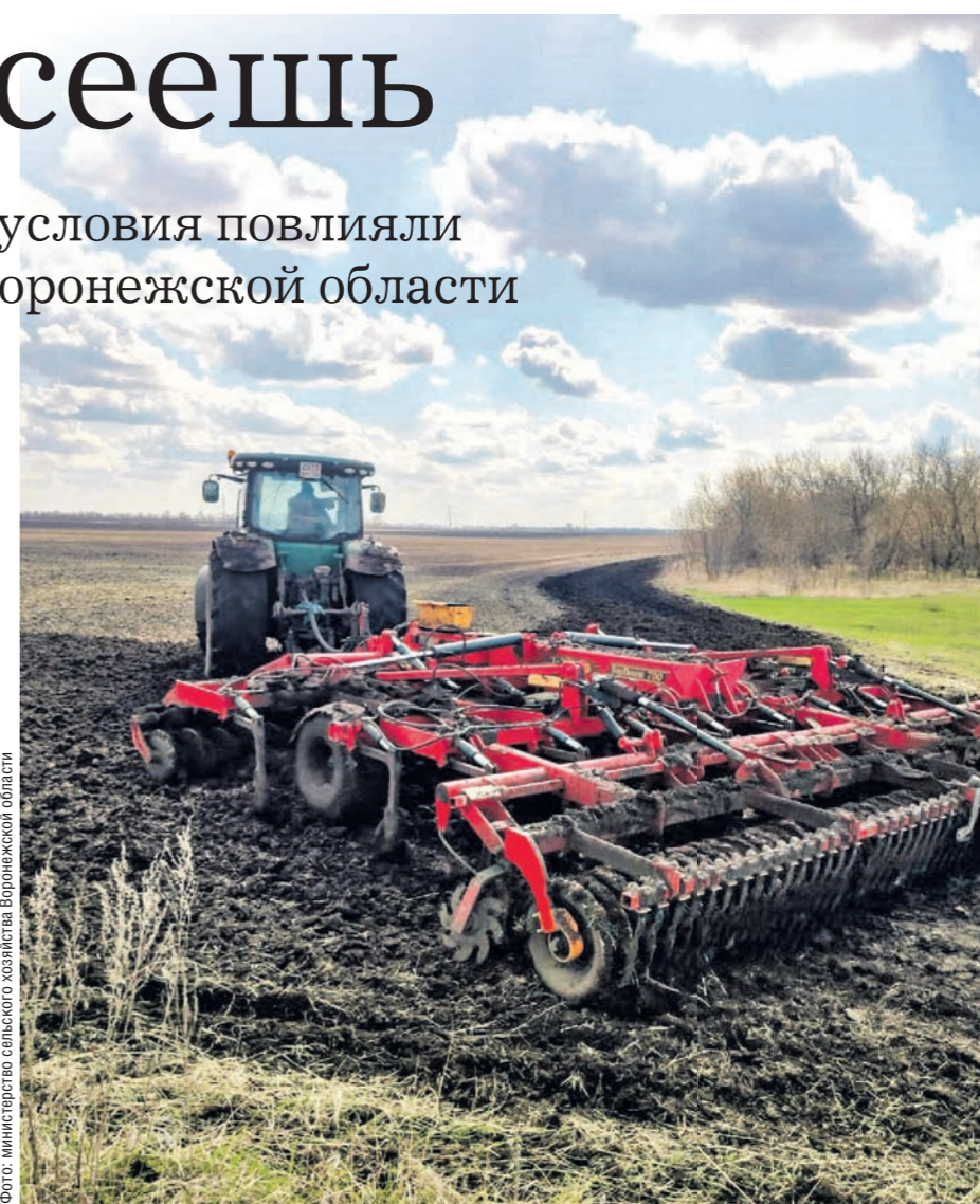
Из-за низкой температуры посевная в регионе задержалась на срок до трёх недель

— Аграрии обеспечены всем необходимым для успешного проведения посевной, включая семена, удобрения, технику, ГСМ и другие ресурсы. Мы