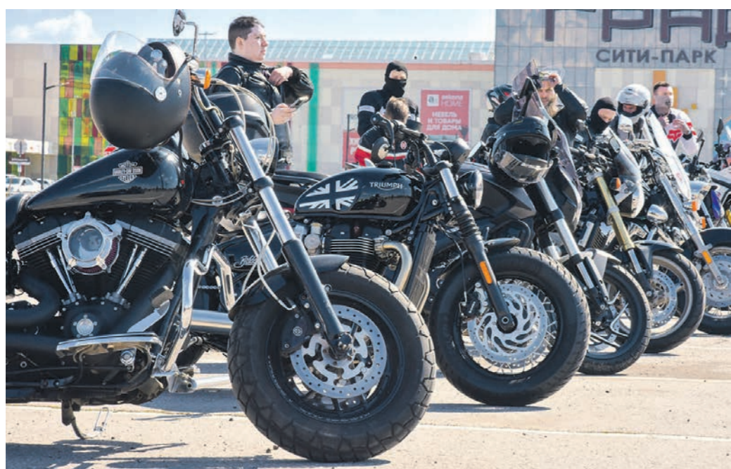
Участники мотоклуба ежегодно собираются вместе, чтобы весело провести время

участвовали в пробеге на открытии воронежского мотосезона-2026