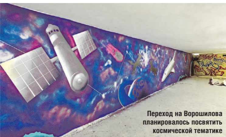
Переход на Ворошилова планировалось посвятить космической тематике

Почему приостановлены работы по реконструкции трёх пешеходных переходов в Воронеже