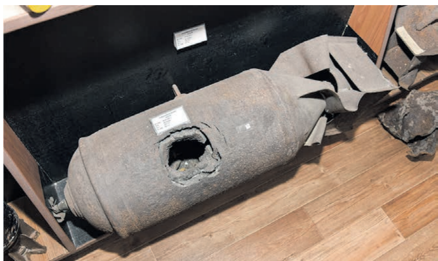
Эта авиабомба содержала свыше 40 кг взрывчатого вещества