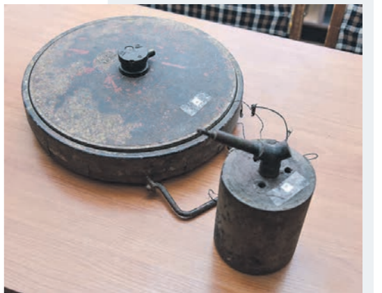
Немецкие противотанковая и противопехотная мины