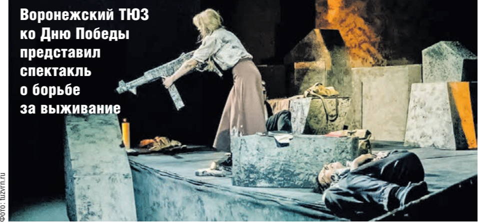
Воронежский ТЮЗ ко Дню Победы представил спектакль о борьбе за выживание