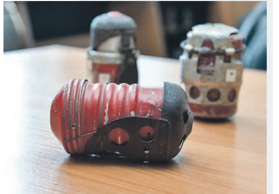
Этот ярко-красный цилиндр — итальянская ручная граната

ЦИФРА 96 тыс. свыше боеприпасов времён Великой Отечественной войны уничтожено в Воронежской области за последние 30 лет