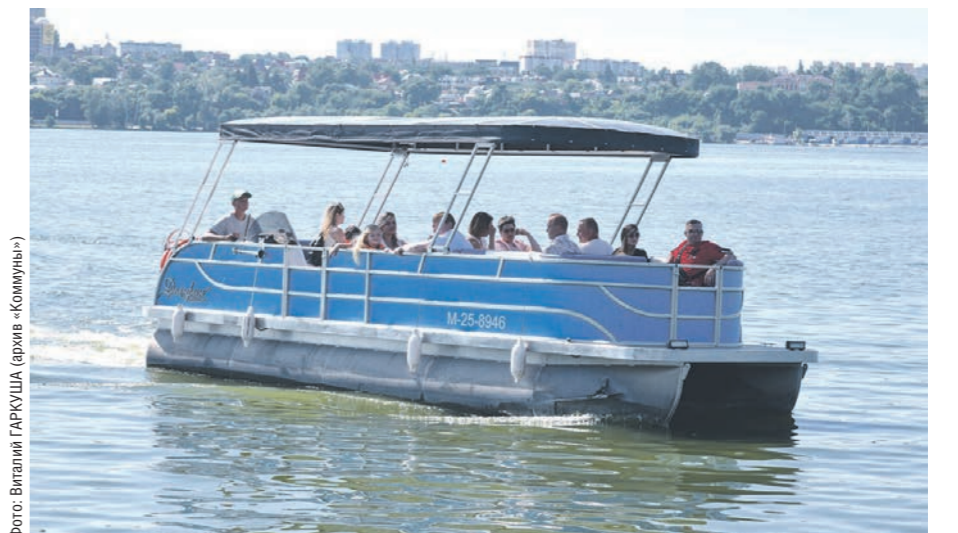
В тёплое время по водохранилищу курсируют прогулочные катера, но стоимость проезда на них довольно высокая