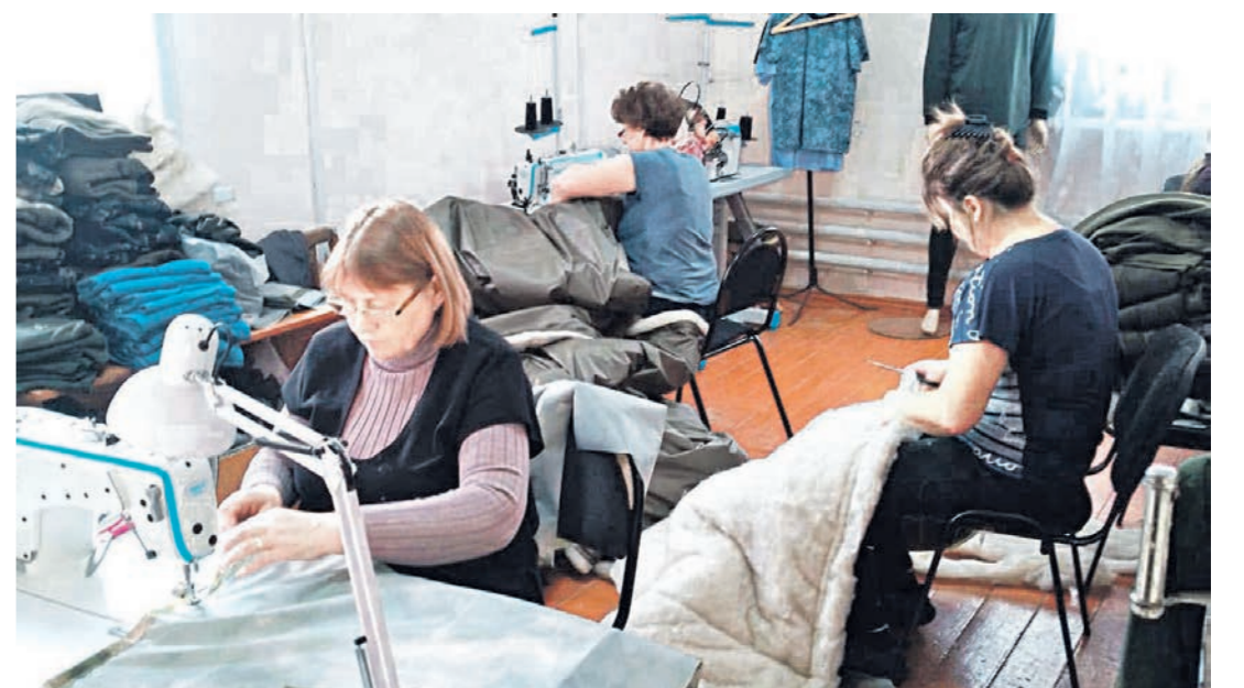
В цеху работает около ста женщин, старшей из которых – 85 лет

– Ребята на передовой, когда узнают, что пришла очередная партия гуманитарки из Мужичья, говорят: «Что творят эти волшебницы! Когда они всё успевают? И шьют, и пекут. Просто умницы». Эти слова для нас – самая большая награда, – поделились волонтеры.