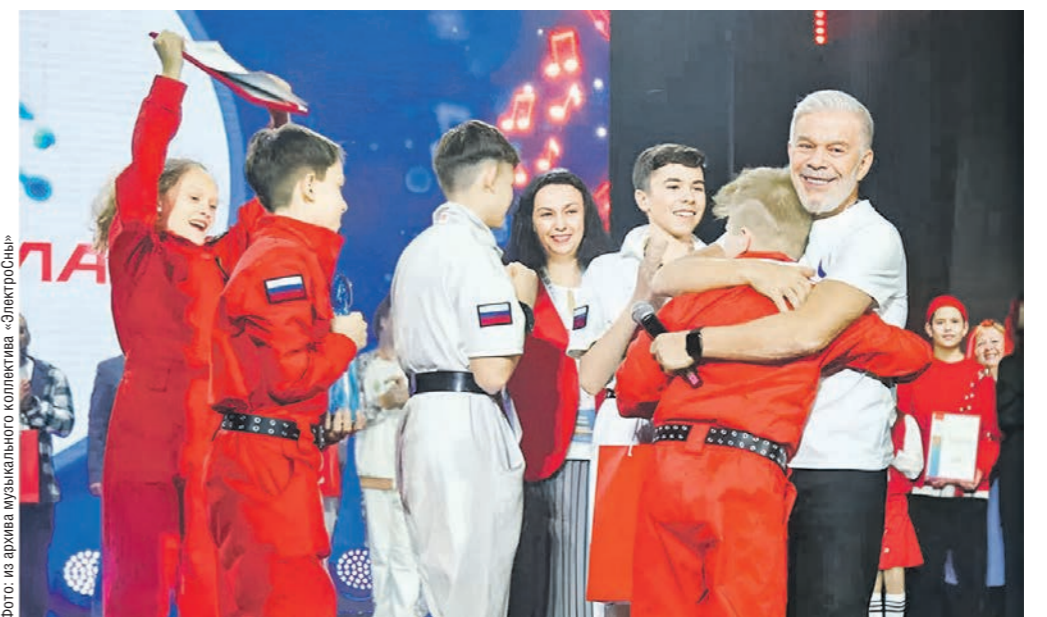
В качестве награды юные воронежцы получили возможность выступить в Кремлёвском дворце