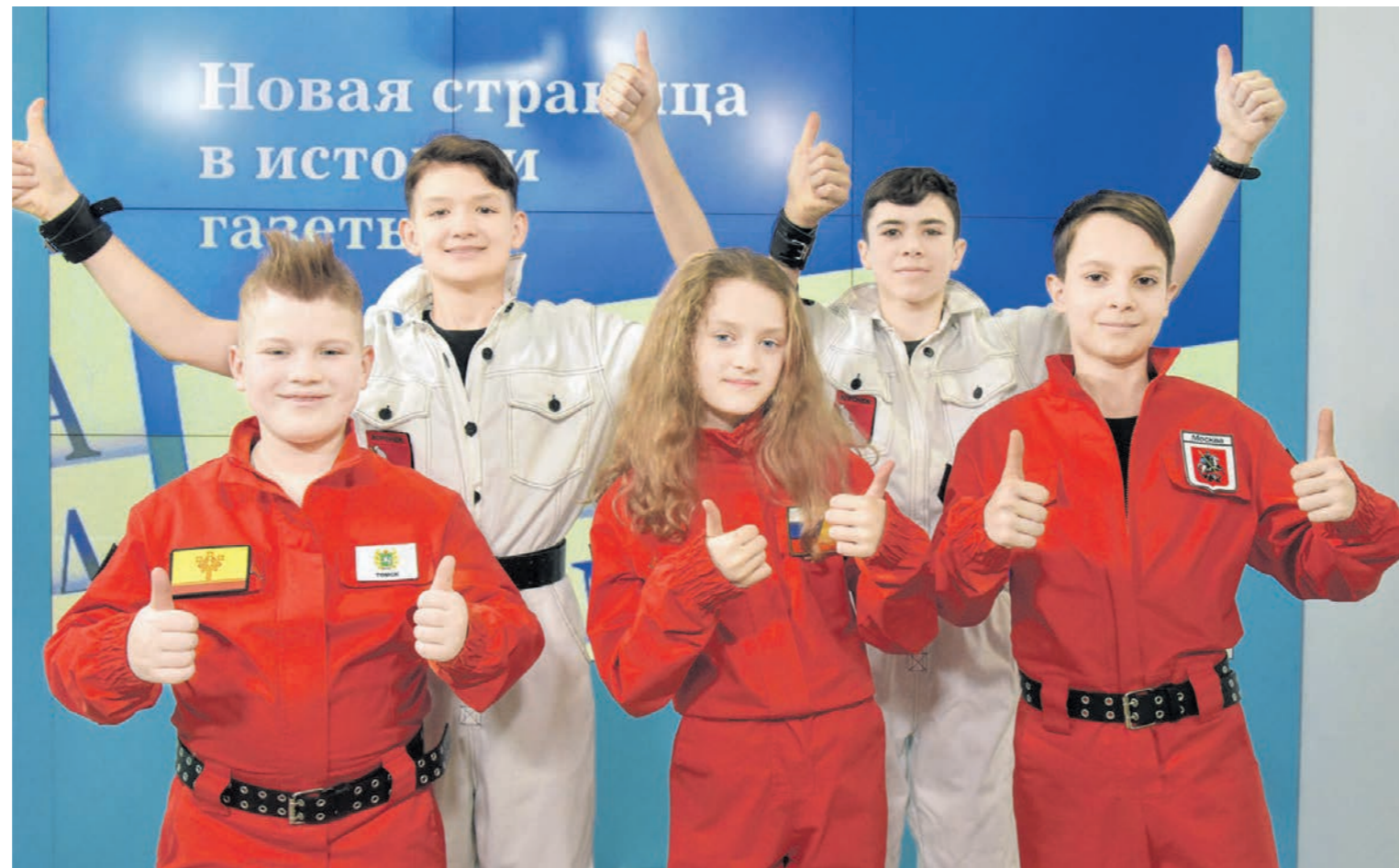
Воронежская группа «ЭлектроСны» существует всего около года, но уже добилась признания на всероссийском уровне

— Наши финалисты выступили отлично, как инструментально, так и вокально, на настоящем драйве,— подытожил Олег Газманов.— У этих музыкантов хорошее будущее, их уже приглашают выступать на крупные музыкальные фестивали. Хотя станут эти ребята настоящими артистами или нет, покажет время.