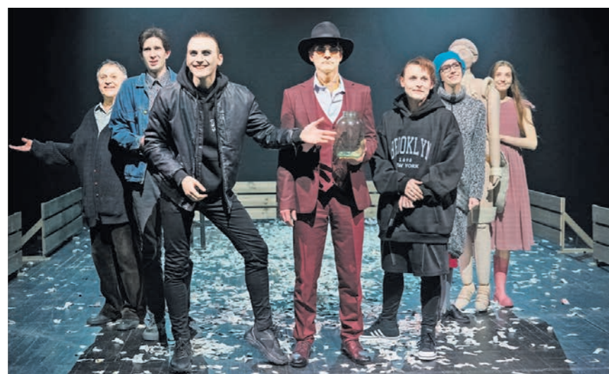
Пьеса Островского, написанная 160 лет назад, не теряет актуальности и сегодня

«Шутники» — не самое известное произведение классика русского театра А. Н. Островского. Как и большинство его работ, пьеса исследует тему власти денег, их влияния на человеческую душу.