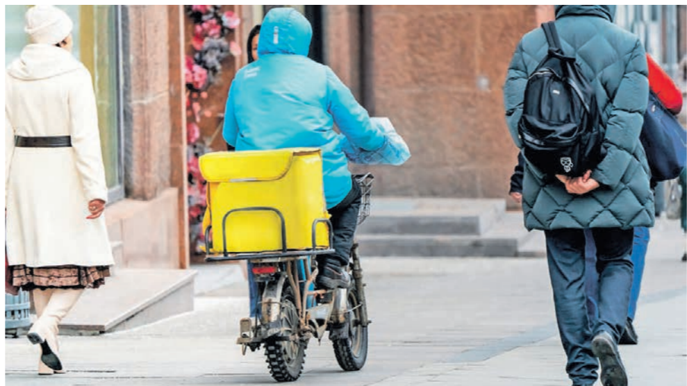
Торопясь доставить заказ, курьеры порой забывают о Правилах дорожного движения

— Поэтому, если вы пострадали от неправомерных действий самокатчика, сразу же снимайте всё происходящее