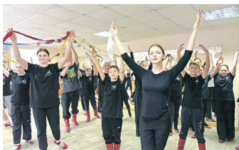
Ансамбль танца «Белая птица» детской школы искусств Нижнедевицкого района готовится к новым выступлениям