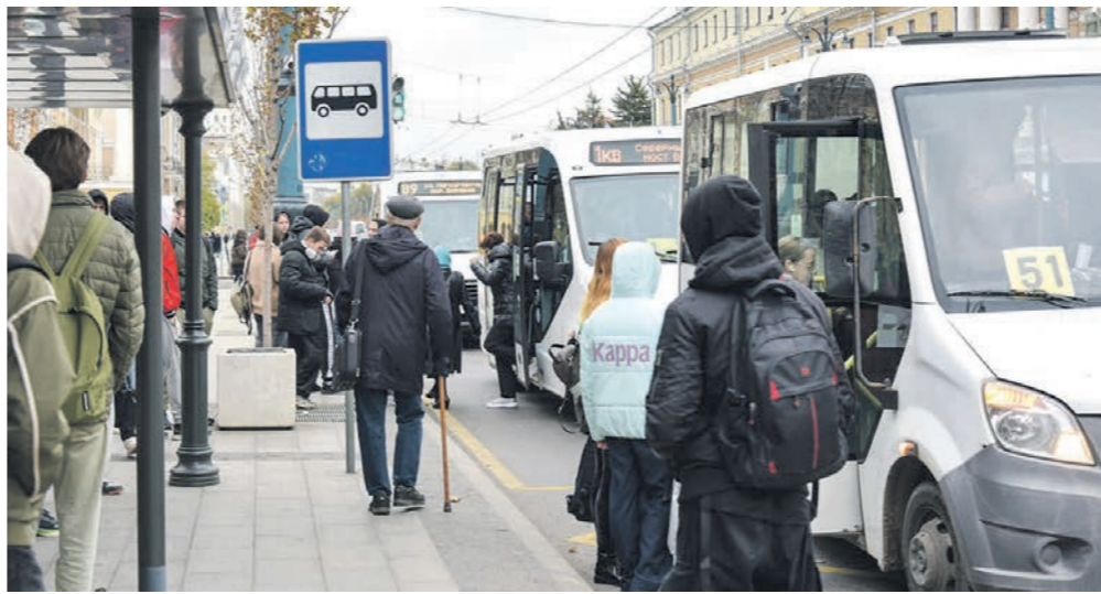
Лучший способ решить конфликт в транспорте — постараться его избежать