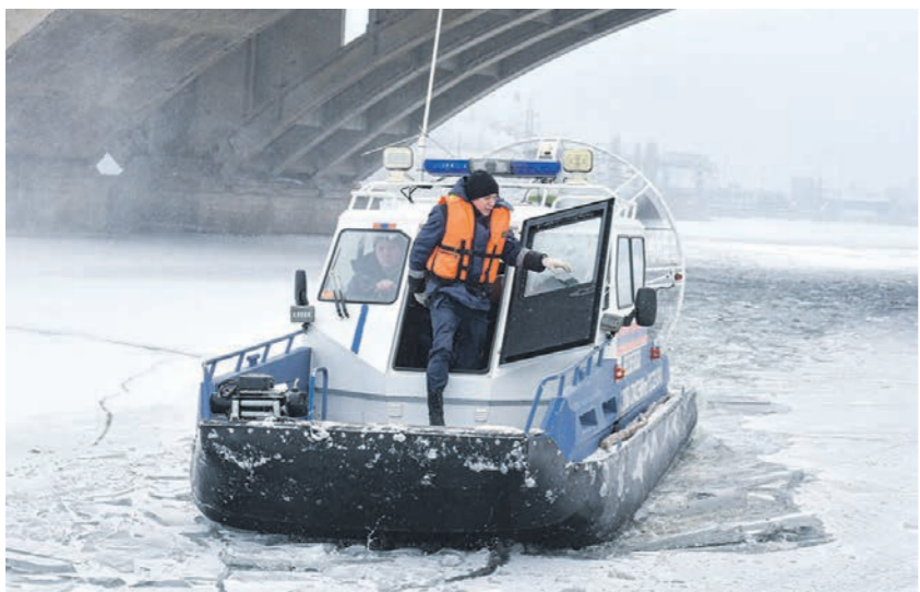
Сотрудники воронежского поисково-спасательного отряда патрулируют водохранилище ежедневно

Если вы увидели, что кто-то провалился под лёд, сразу же позвоните по телефону «112». Затем подползите к пострадавшему и попробуйте вытащить его с помощью длинного предмета: бура, верёвки, палки.