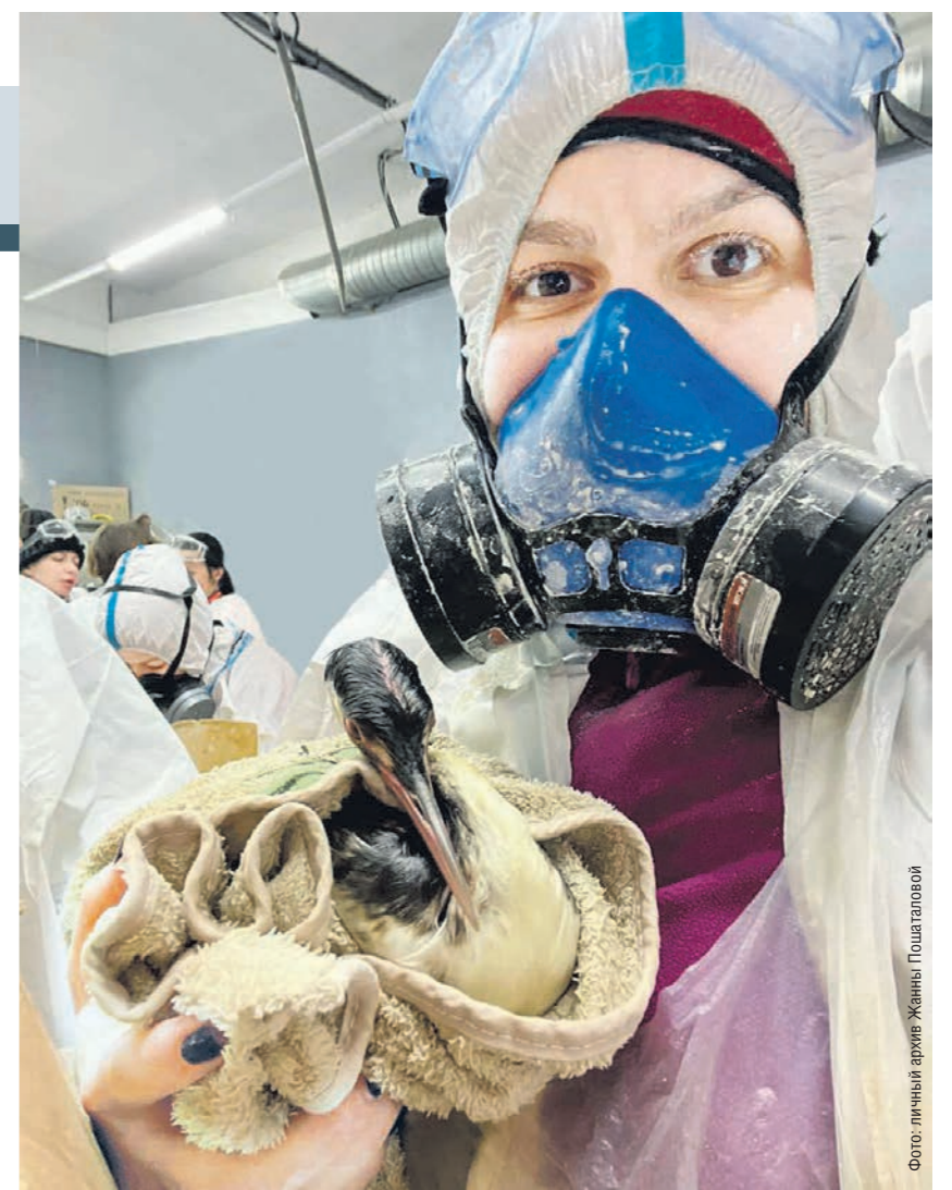
Благодаря волонтерам были спасены тысячи испачканных в мазуте птиц

Как отмечают местные власти, вокруг темы спасения птиц сейчас крутится много слухов. В частности, в телеграм-каналах распространяется информация, что якобы 90% птиц, спасённых в Анапе волонтерами и отправленных в Краснодар на реабилитацию, умерло по дороге. В оперштабе эту и подобные новости называют фейками.