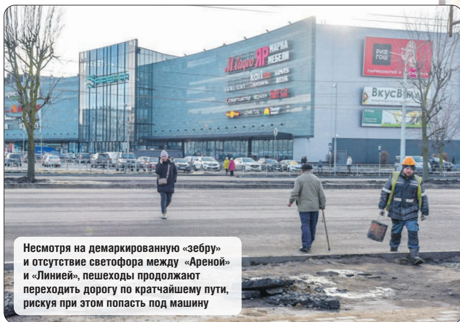
Несмотря на демаркированную «зебру» и отсутствие светофора между «Ареной» и «Линией», пешеходы продолжают переходить дорогу по кратчайшему пути, рискуя при этом попасть под машину

ГОРОДСКАЯ СРЕДА • После открытия части дублёра Московского проспекта на нескольких перекрёстках существенно поменялась схема пешеходных переходов