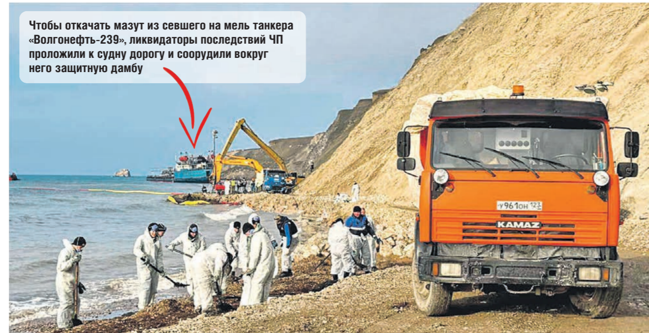
Чтобы откачать мазут из севшего на мель танкера «Волгонефть-239», ликвидаторы последствий ЧП проложили к судну дорогу и соорудили вокруг него защитную дамбу

Недавно медиахолдинг объявил очередную акцию. В итоге удалось собрать более 2 тысяч книг самых разных жанров: детская, классическая и научная литература, фантастика, детективы, публицистика. В ближайшее время все эти книги отправ-