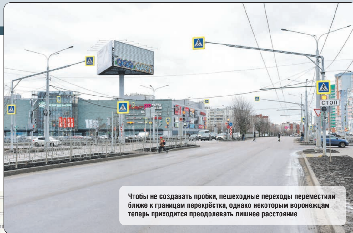
Чтобы не создавать пробки, пешеходные переходы переместили ближе к границам перекрёстка, однако некоторым воронежцам теперь приходится преодолевать лишнее расстояние