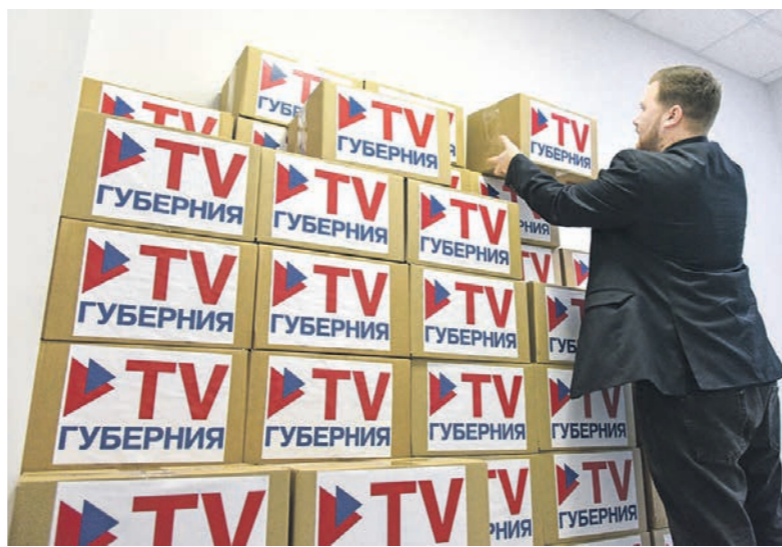
Медиахолдинг «Губерния» передал в библиотеки новых регионов уже более 10 тысяч книг

От посещения морского берега в районе разлива мазута я бы точно воздержалась. Летом нефтепродукты будут больше взаимодействовать с солнечными лучами, что ускорит их распад, однако из-за этого также и повысится токсическое воздействие, которое отразится на любом живом организме — в том числе и на человеке. К тому же, купание в море — по крайней мере, в этом сезоне, — вообще может привести к разным последствиям: от высыпаний на коже до отравления организма. По-хорошему же, на курортах, которые оказались загрязнены, лучше не появляться ещё лет пять, а тем более привозить детей.