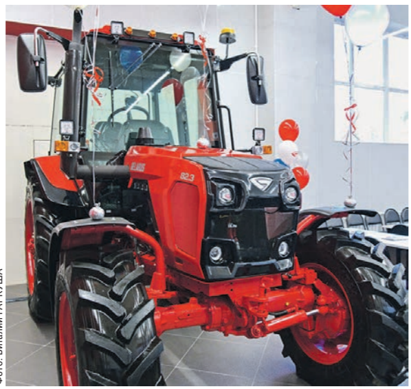
Новый МТЗ-82.3, который пожаловал в учебную аудиторию агроуниверситета, выгодно отличается от своих предшественников

Но жизнь не стоит на месте, а постоянно ставит перед нами новые задачи. Вот почему усилия Воронежского государственного аграрного университета по подготовке высококвалифицированных инженерных кадров встречают активную поддержку и со стороны Минского тракторного завода, и со стороны нашей компании. Открытие учебной аудитории — ещё один шаг в этом направлении. Уверен: это позволит выпускникам вуза быстрее обрести своё призвание, а технике Минского тракторного завода по-прежнему оставаться повсеместно востребованной и заслуженно популярной. Скажу больше: в талантливых, инициативных, умеющих креативно мыслить и действовать специалистах с дипломом этого вуза заинтересована и компания «ВоронежКомплект», что непременно обернётся пользой для нашего общего дела.