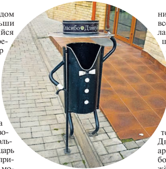
В Гродно можно встретить вежливые двуязычные урны

Гродненцы принимают своё прошлое во всей его полноте. Рядом с монументом в честь древнерусского князя Давыда Гродненского стоит памятник литовскому князю Витовту, на одном доме можно увидеть мемориальные доски в честь Феликса Дзержинского и Петра Столыпина. В 50-е годы роскошный дворец польских королей стал обкомом КПСС, а на его крышу нахлобучили железный