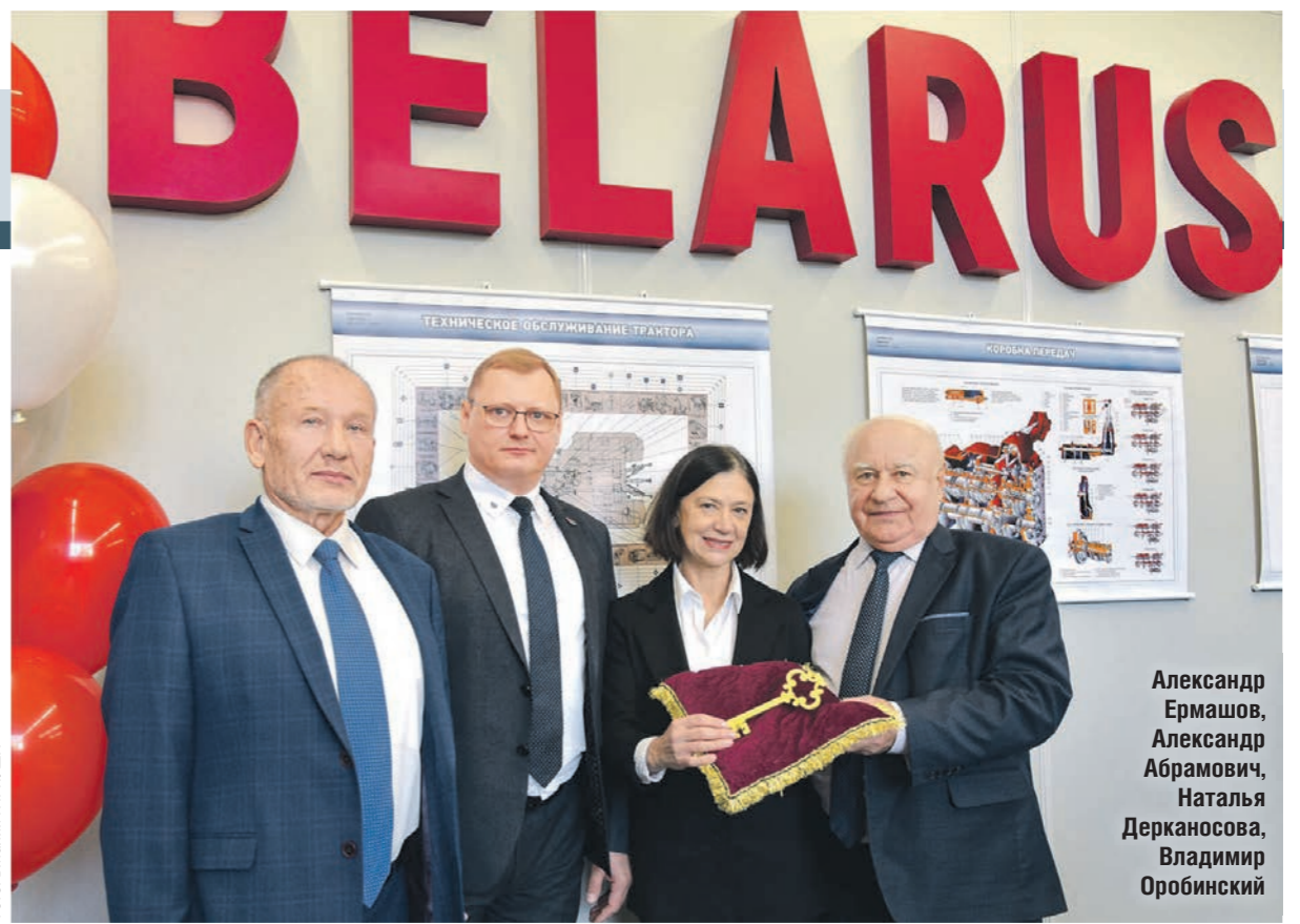
Учебная аудитория оформлена в корпоративном стиле Минского тракторного завода

АПК • На агроинженерном факультете Воронежского государственного аграрного университета имени императора Петра I открылась учебная аудитория Минского тракторного завода