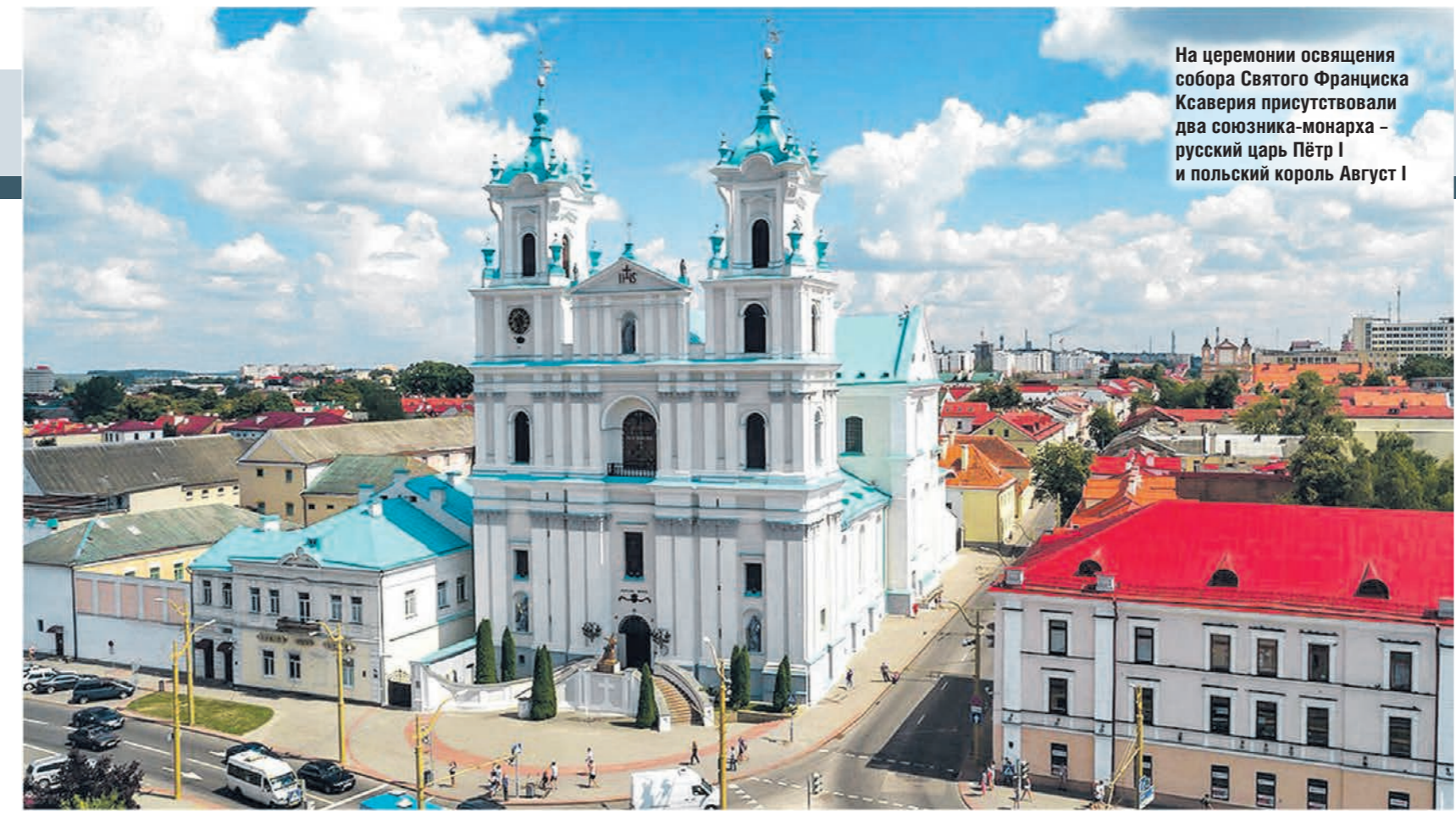
На церемонии освящения собора Святого Франциска Ксаверия присутствовали два союзника-монарха – русский царь Пётр I и польский король Август I

В соседней стране наряду с русским есть и второй государственный язык – белорусский. Сфера употре-