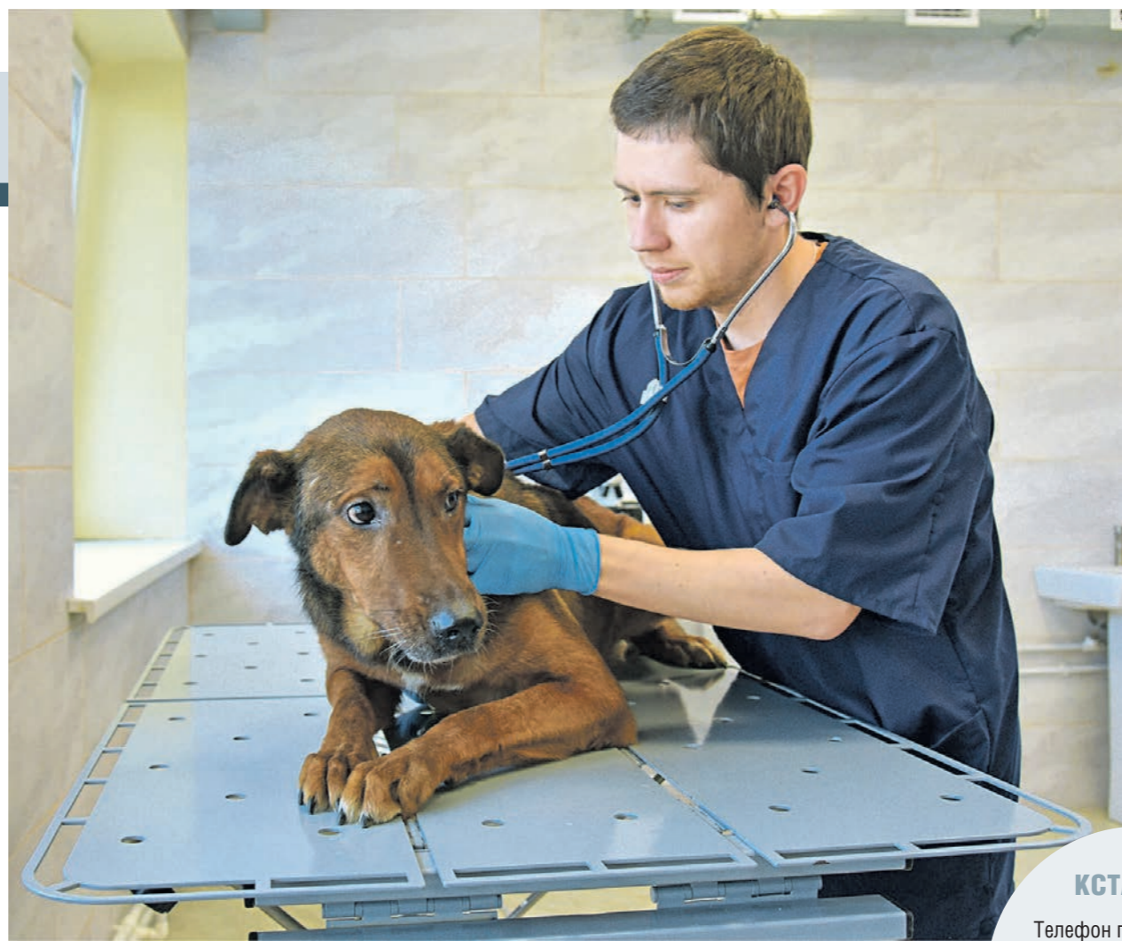
Пойманных собак стерилизуют, чипируют, делают прививки и позже выпускают на прежнее место обитания