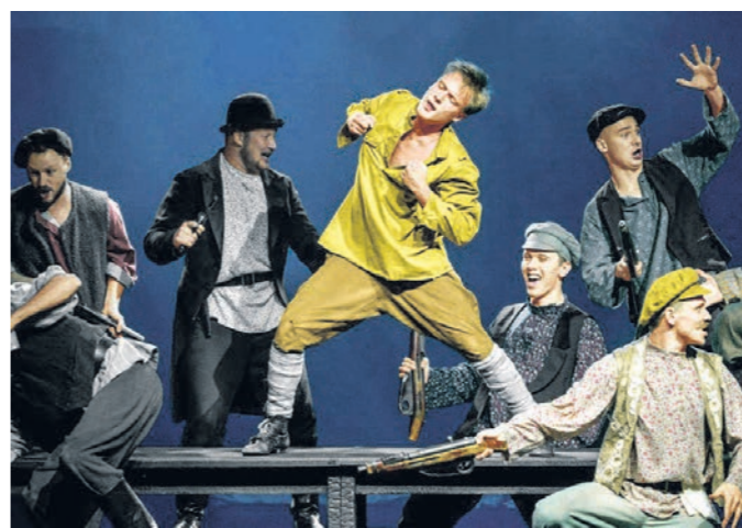
Спектакль «Страсти по Бумбарашу» имел большой успех у воронежской публики

— Бессспорно, что-то брал от них и по сей день беру. В то же время дополняю роль своими красками, своими интонациями. Я — представитель другого поколения, значит, и мой Бумбараш совершенно иной. К слову, Евгений Миронов видел спектакль, а после сказал много