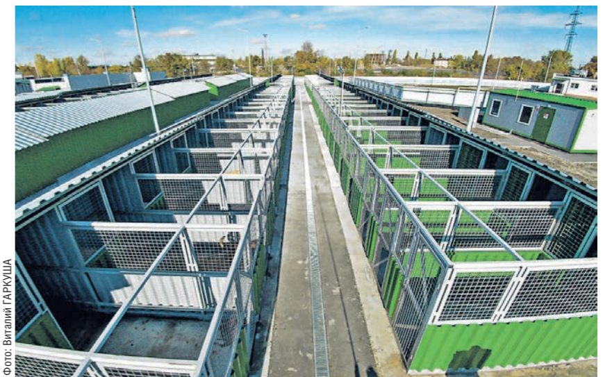
Приют для животных рассчитан на 250 мест. На содержание одной собаки в месяц тратится около 11 тысяч рублей

Вскоре установят часы посещения, когда волонтеры или потенциальные хозяева смогут прийти и познакомиться с обитателями приюта. Уже разработаны правила, регламентирующие визиты. Кроме того, на территории установлено около двух десятков камер. Мера, безусловно, необходимая: люди, как и животные, бывают очень разными.