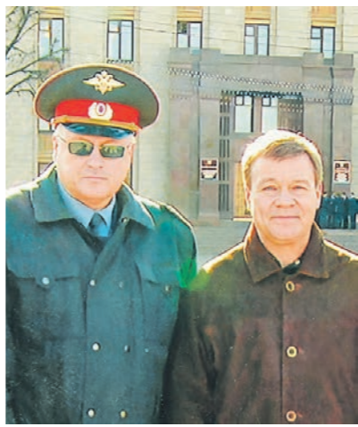
Актёр Сергей Селин, играя роль оперативника Дукалса, советовался с воронежскими милиционерами

Затем Сергея перевели служить следователем в Воронеж. В структуре МВД он проделал путь от лейтенанта до полковника. В 1993-м ему доверили должность начальника милиции Левобережного района, которую он занимал более пяти лет. — Стояли «лихие девяностые». Страна только что развалилась. Найти работу было трудно. На этом фоне произошёл всплеск преступ-