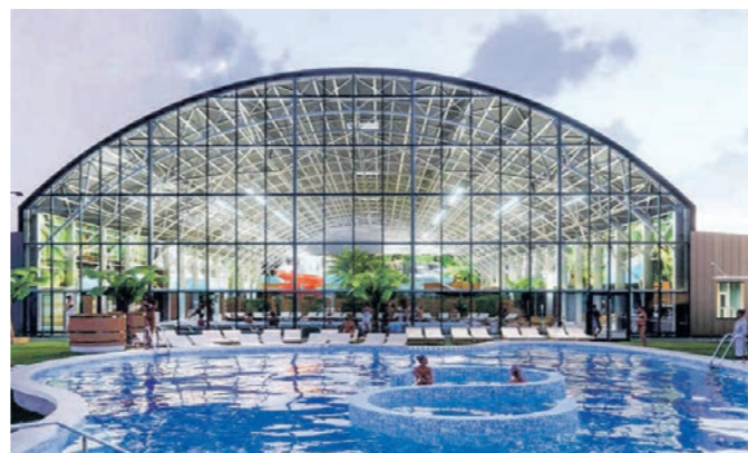
Инвестиции в акватермальный комплекс на берегу Воронежского водохранилища могут составить 1,2 млрд рублей