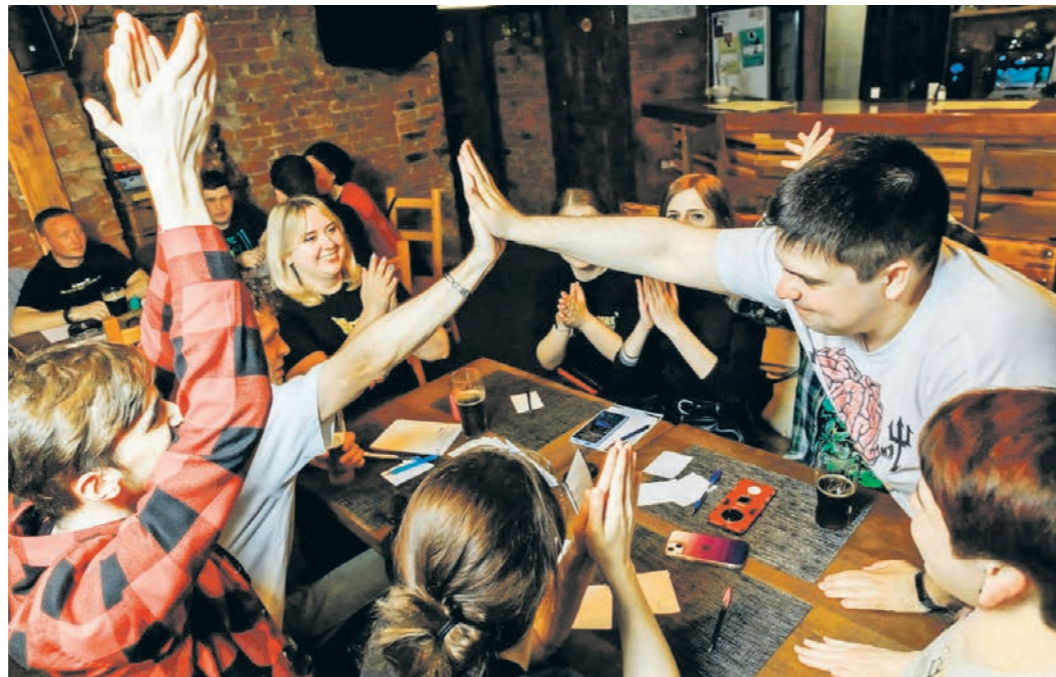
Правильный ответ всегда вызывает бурные эмоции

Так как викторина проходит в пабе или баре, за каждой командой (в среднем 5–7 человек) закрепляется стол, возле которого расположены экраны. На них дублируются вопросы, зачитываемые ведущим. Задача игроков — внести свои ответы в специальные бланки. Подслушать других участников не удастся даже при огромном желании, так как во время размышлений громко играет музыка. — Обычно в квизе — семь раундов, каждый из которых длится по минуте, одна-