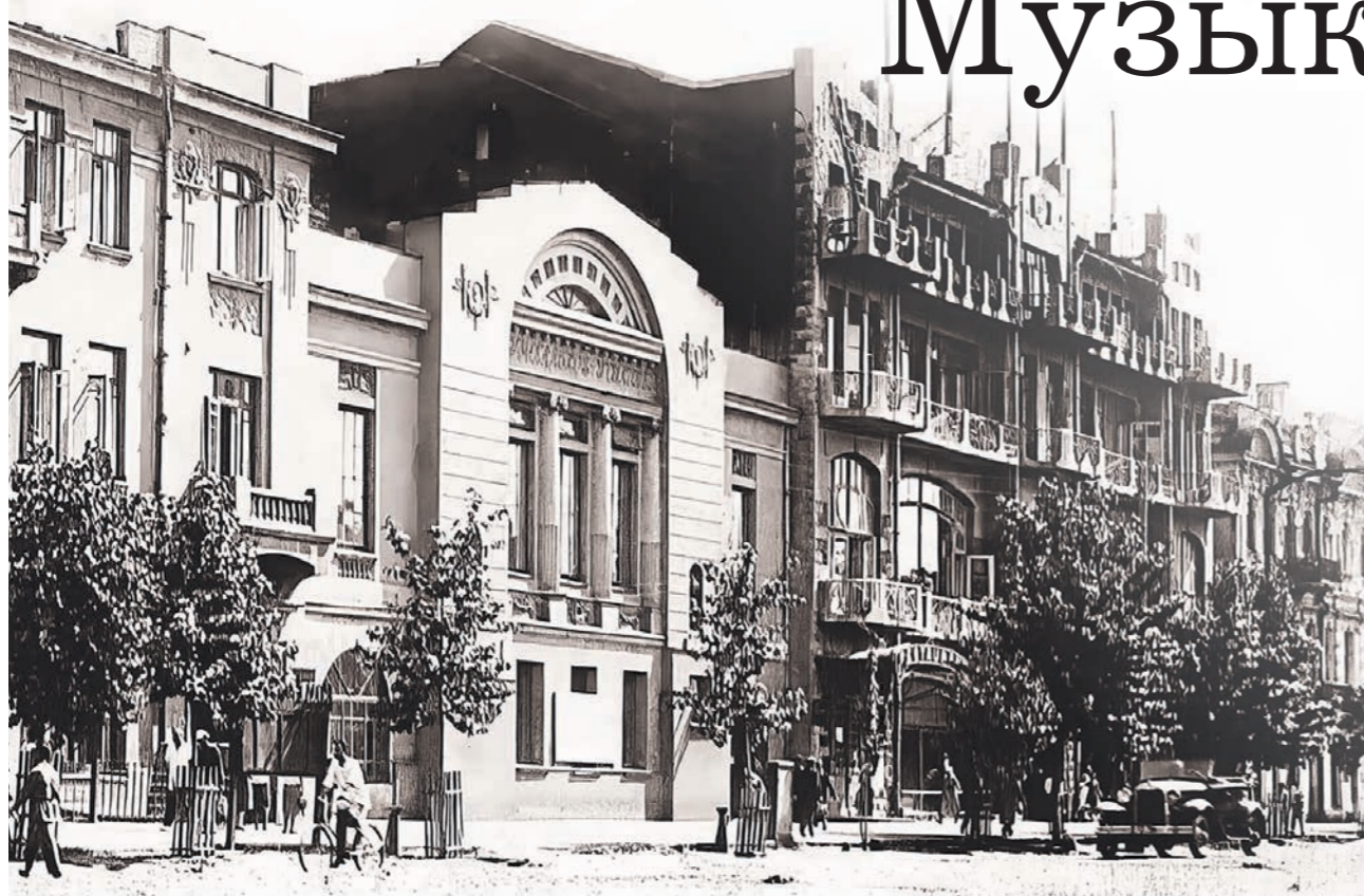
Так здание музучилища, располагающееся по соседству с гостиницей «Бристоль», выглядело до войны

ИСТОРИЯ • Как Воронежское музыкальное училище пережило Великую Отечественную войну