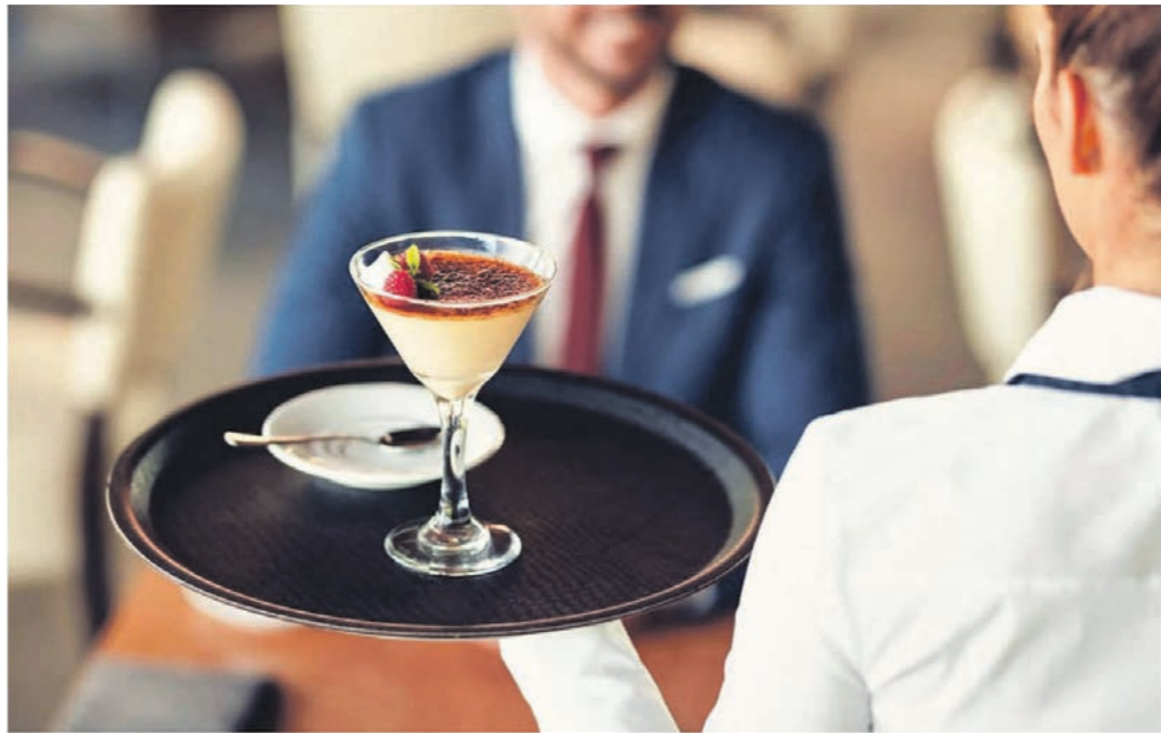
Подавляющее большинство воронежских официантов — это девушки от 18 до 25 лет

Проблема дефицита официантов и других сотрудников тесно переплетается с проблемой текучки кадров. По данным