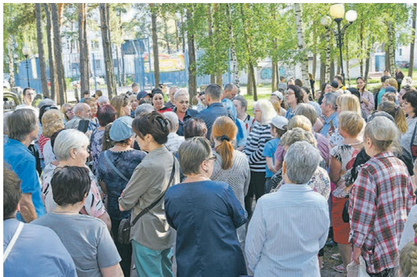
На сходе местные жители подписали коллективное письмо в прокуратуру

— В нашем доме сосед выгонял из подъезда шесть человек, — вспоминает молодая женщина. — Они говорят: «Мы тебя сейчас прижмём, уколем, и ты будешь такой же, как мы!». Мужчина их всё же выгнал, но подумал: а стоит ли ему в следующий раз с ними связываться? У нас дети уже выходят одни во двор бояться, даже школьники гуляют под присмотром родителей.