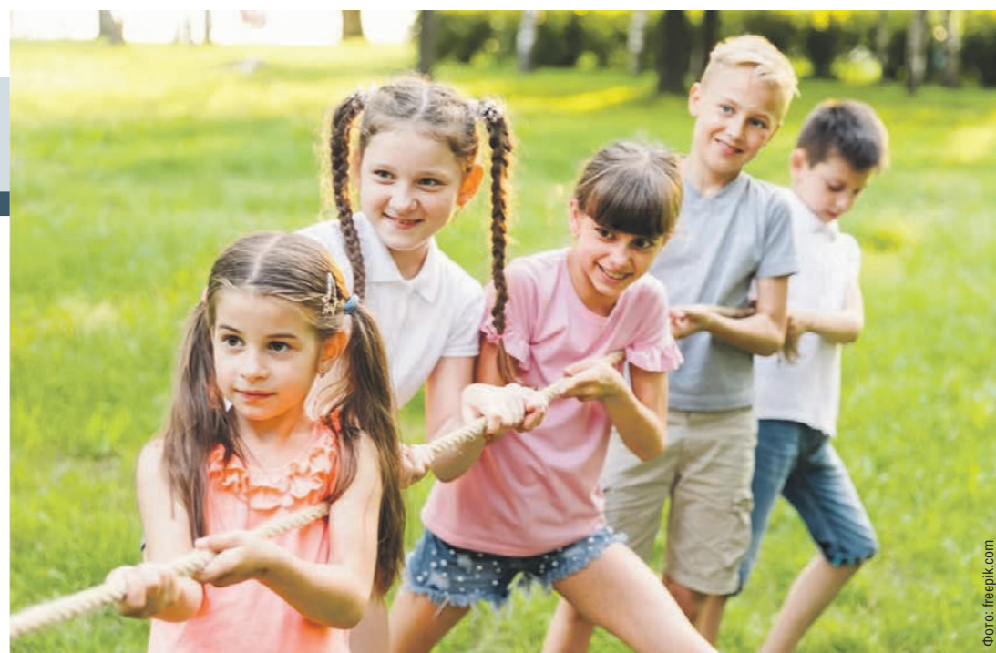
Во всех лагерях детей ожидает насыщенная досуговая программа

ИНТЕРВЬЮ • Руководитель образовательного центра «Орион» – об организации летней оздоровительной кампании, тематических сменах и подготовке вожатых в детских лагерях