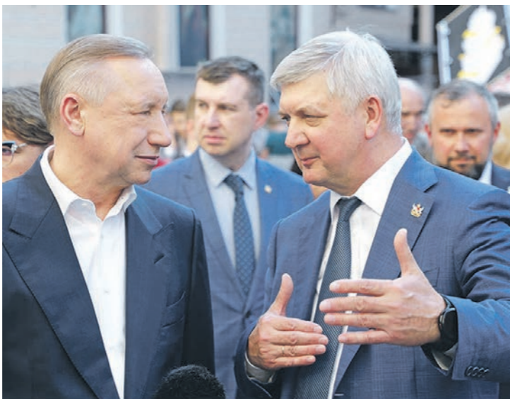
Губернаторы Александр Гусев и Александр Беглов на ПМЭФ обсудили сотрудничество Воронежской области и Санкт-Петербурга

Петербургский форум стал своего рода смотринными перед августовским заседани-