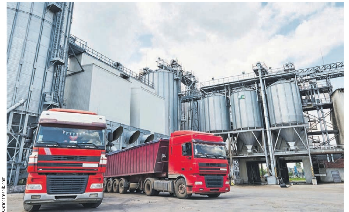
Сегодня ключевой задачей в АПК становится помощь экспортёрам в поиске новых рынков сбыта