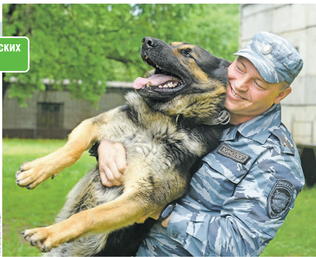
Четвероногие помощники полицейских не только ловят преступников, но и защищают хозяев ценой своей жизни

РЕПОРТАЖ • Как воронежские кинологи готовят собак к службе в полиции и какие преступления удалось раскрыть с помощью четвероногих помощников