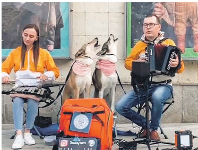
Фокси, Лисичка и их хозяева гастролируют по разным городам России

— Часто Лисичку и Фокси приглашают угостить колбаской или сосисками. Но мы даём собакам только специализирован-