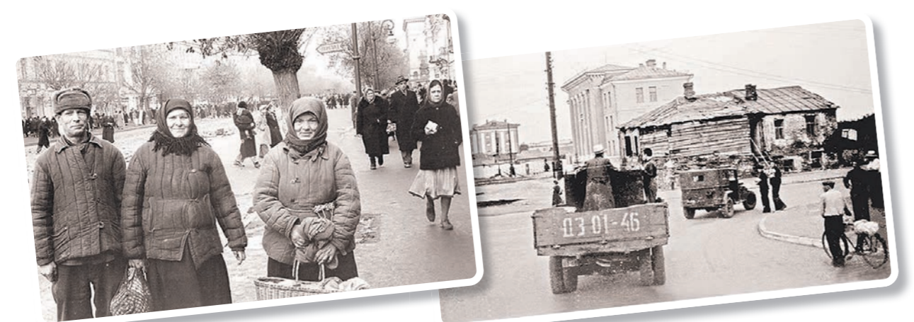
Снимки Владимира Нейно стали летописью жизни Воронежа и его жителей