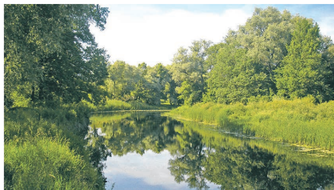
В 2025 году Битюг может быть включён в дорожную карту нового федерального проекта по экологии

Природа воронежского края разнообразна и неповторима. Её важнейшая составляющая – реки, дающие жизнь земле. Сейчас в нашей области протекает 125 рек. В новой рубрике мы поговорим о «водных артериях» региона. Вспомним их историю, восхитимся красотой, разберёмся в проблемах.