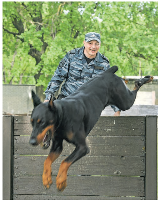
Процесс обучения служебной собаки длится полгода