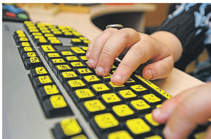
По словам посетителей библиотеки для незрячих, освоить азбуку Брайля можно примерно за два месяца