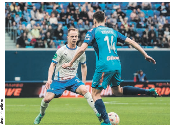
«Факел» в гостях уступил «Зениту» со счётом 0:1

К сожалению, неудача в Северной столице отбросила «Факел» с 12-го места на 14-е. Теперь воронежцев ждут стыковые поединки с красноярским «Енисеем». 7 июня соперники сразятся в манеже «львов» — матч стартует в 15.00. Ответная встреча в Воронеже состоится 10 июня — начало в 17.30. При этом для прохода на стыковые матчи карта болельщика уже не потребуется. Отметим, что «Енисей» в нынешнем сезоне Первой лиги занял четвёртое место, одержав 13 побед и потерпев шесть поражений, ещё 15 матчей с участием красноярцев завершились вничью.