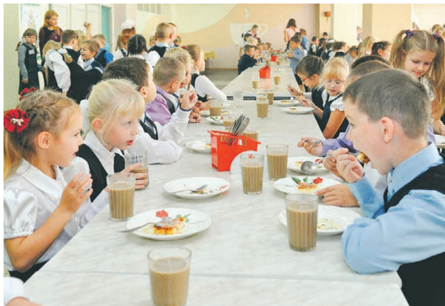
Внедрение бережливых технологий в образовательных учреждениях способствовало оптимизации контроля качества питания более чем в 700 школах

ПЕРСПЕКТИВА • В Воронеже проверили ход реализации проекта «Эффективный регион»