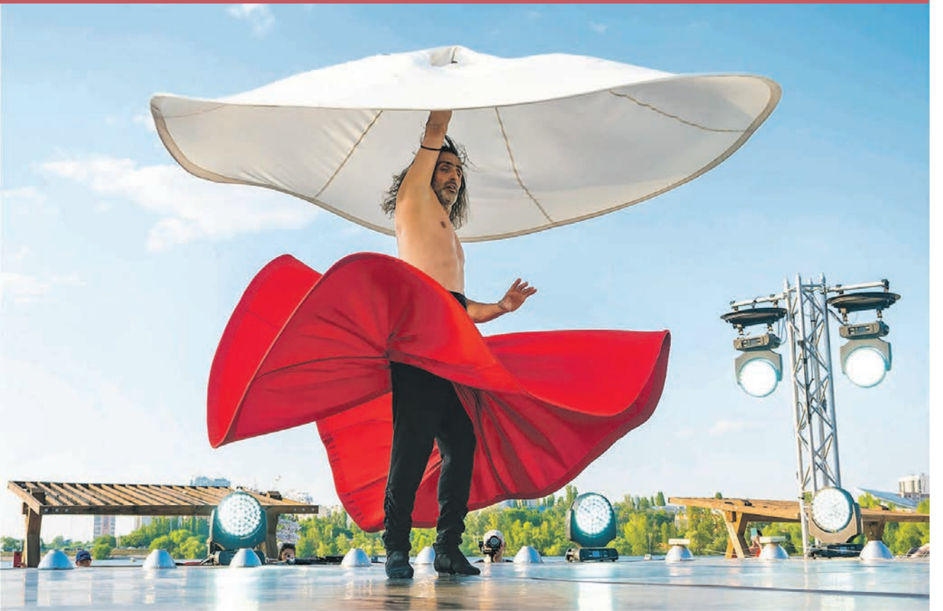
2 июня в Воронеже выступил турецкий танцовщик и хореограф Зия Ази (о других событиях Платоновфеста читайте на стр. 6)