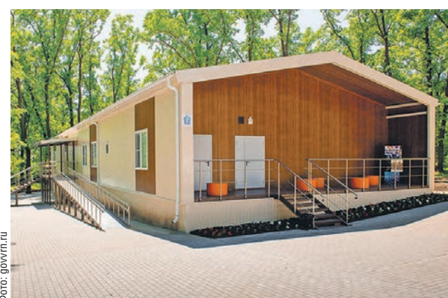
Новые корпуса в лагере «Ландыш» построены из быстровозводимых конструкций

Шоу «ГОЛОС» состоит из шести этапов. Первый — слепые прослушивания. Наставники не видят вокалистов, но слышат и оценивают их голоса. Любой наставник может взять исполнителя в свою команду. Если участника выбрали несколько наставников, то он сам выбирает, в чью команду идти. Далее — поединки. В каждом из них двое представителей одной команды исполняют вместе одну песню, и в следующий этап проходит лучший по мнению наставника. На этапе нокаут наставники разбивают свои команды на тройки, где каждый исполняет по одной песне. Из тройки в следующий этап проходит только один исполнитель. В полуфинале к решению судьбы оставшихся вокалистов присоединяются зрители, а в финале голосуют только они.