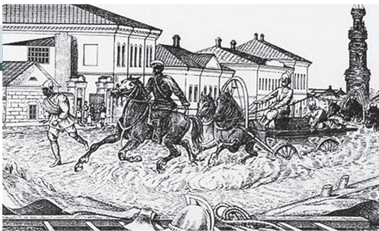
Пожарная команда на улице Старомосковской. Рисунок художника Л.Г. Соловьёва 1882 года

Профессиональные пожарные появились в Воронеже только в начале XIX века. В 1802 году император Александр I создал Министерство внутренних дел, и с этого времени обязанностью полиции становилась не только борьба с преступностью, но и организация пожарной охраны.