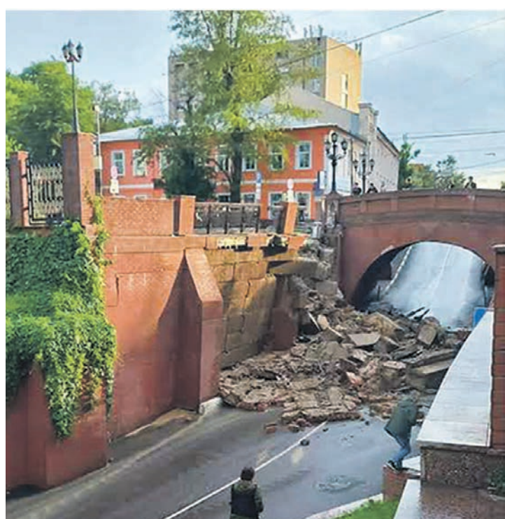
Работы по восстановлению Каменного моста ведутся круглосуточно