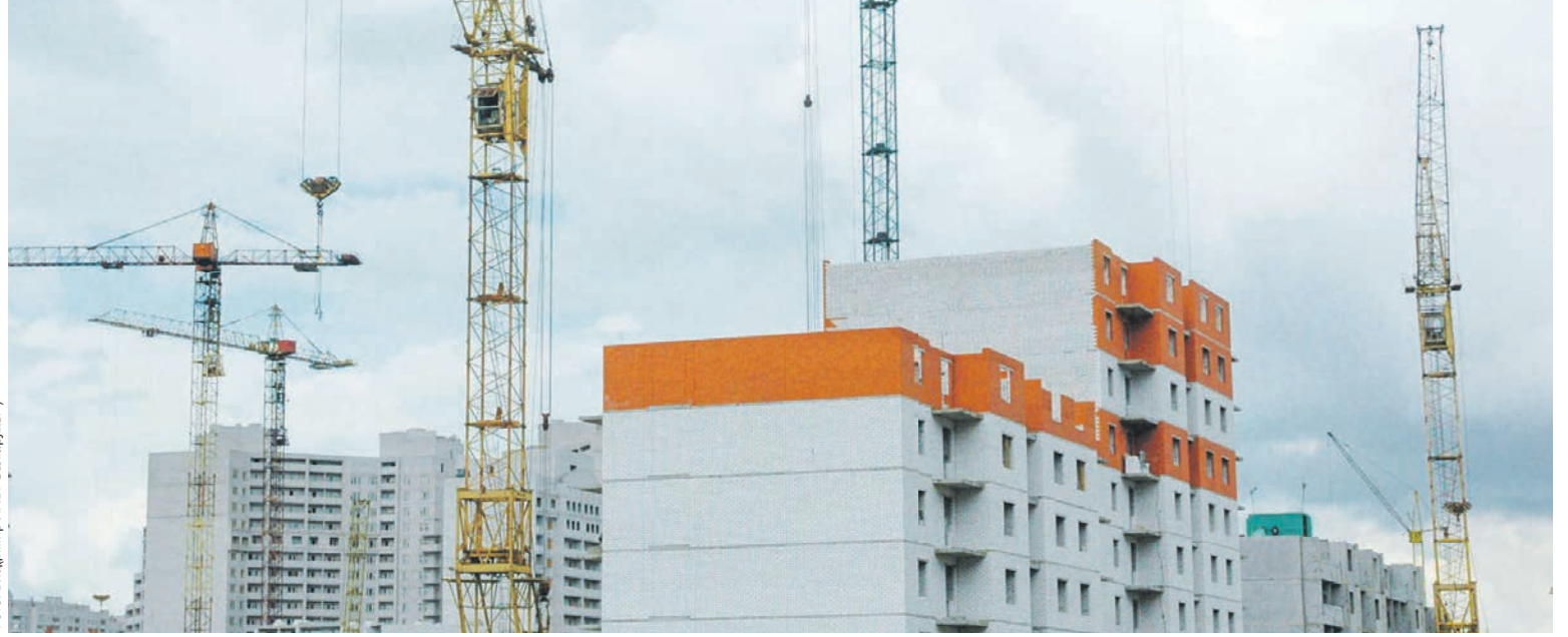
За 4 месяца 2023 года воронежцы подали почти 13 тысяч заявлений на оформление ипотеки

ФИНАНСЫ • Как изменятся правила выдачи жилищной ипотеки после нововведений Банка России