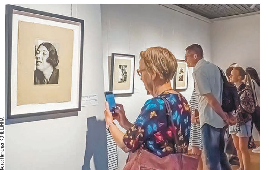
На выставке представлены фотографии Александра Родченко, сделанные в 20–30-е годы XX века