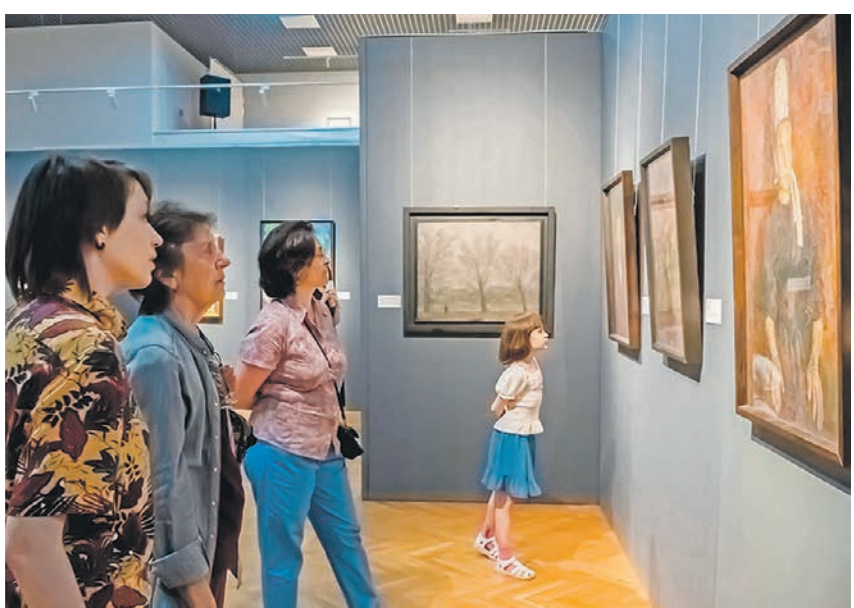
Воронежцы могут увидеть полсотни картин Роберта Фалька из собраний Русского музея, Третьяковской галереи и других музеев страны

То было время подъёма и успеха. В «Вечерней Москве» в 1926 году поэт Николай Асеев напечатает очерк от Александра Родченко. Уже в его названии отражается суть творчества Мастера — «О новом взгляде на мир». Но пройдёт ещё два года, и этот «новый взгляд» окажется «ненужным» и даже «вредным». Родченко обвинят в западнопоклонничестве, назовут формалистом. Ему ничего не останется, как заняться рутинным оформлением книг и альбомов. Но, к счастью, нам остались его фотографии из далёких 20-х годов XX века. Фотографии, сработанные на века.