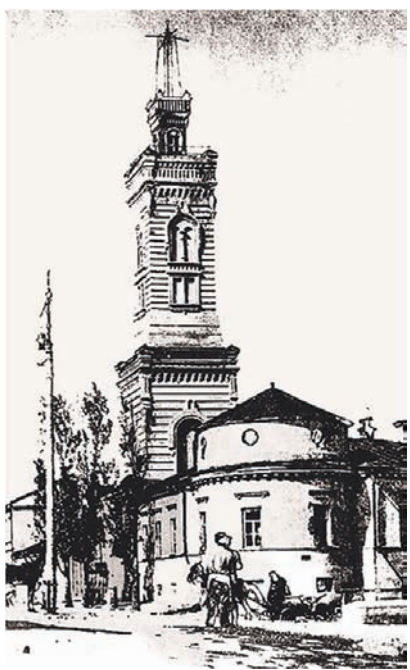
Здание Мещанской пожарной части на ул. К. Маркса было построено в 1825 году, и до 1917 года в нём размещались полицейская и пожарная команды (фото конца XIX века)

380 лет назад в Воронеже была организована первая пожарная команда. Воевода Василий Ромадоновский доложил царю Михаилу Фёдоровичу, что «б человек из пеших ходят в остроге и по слободам, чтоб в летнюю пору от пожарного времени дурна какого не учинилось». «Коммуна» рассказывает, как в старину наш город охраняли от огня, где располагались воронежские пожарные части и почему эта служба считалась одновременно почётной и непрестижной.