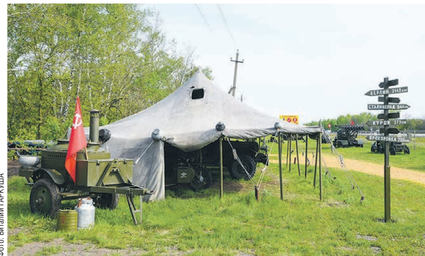
Музей военной техники работает с мая по октябрь. За это время ежедневно его посещают сотни человек

— Некоторые норовят открутить от танка какую-нибудь деталь. Де-