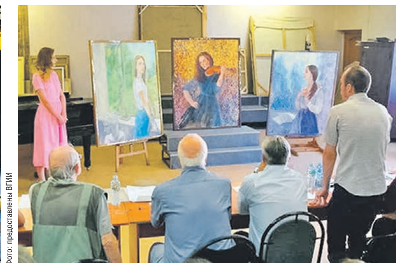
У студентов Воронежского государственного института искусств есть много возможностей для творческой самореализации