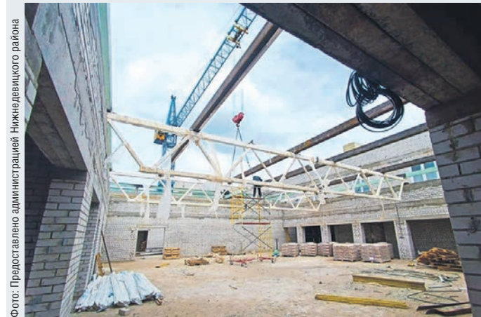
Готовность здания дома-интерната составляет 62%