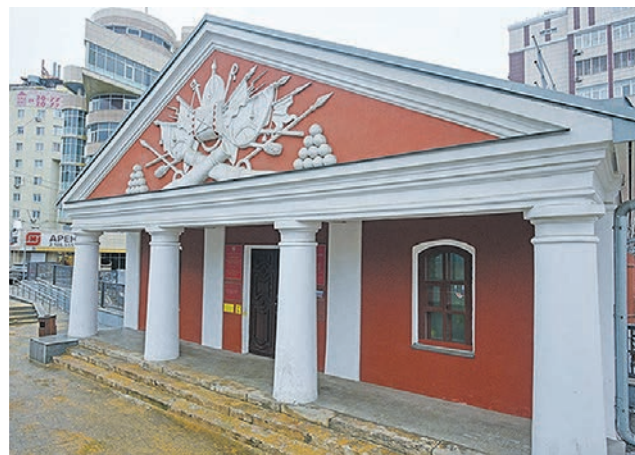
На реконструкцию музея «Арсенал» ушло два года и десятки миллионов рублей

– Реставрация и ремонт проводятся на основании задания, разрешения, выданного органом охраны, а также согласованной им проектной документации. Всё это – при условии технического, авторского надзора и государственного контроля за ходом работ. Отмечу, что любой объект культурного наследия требует исключительно для поддержания его