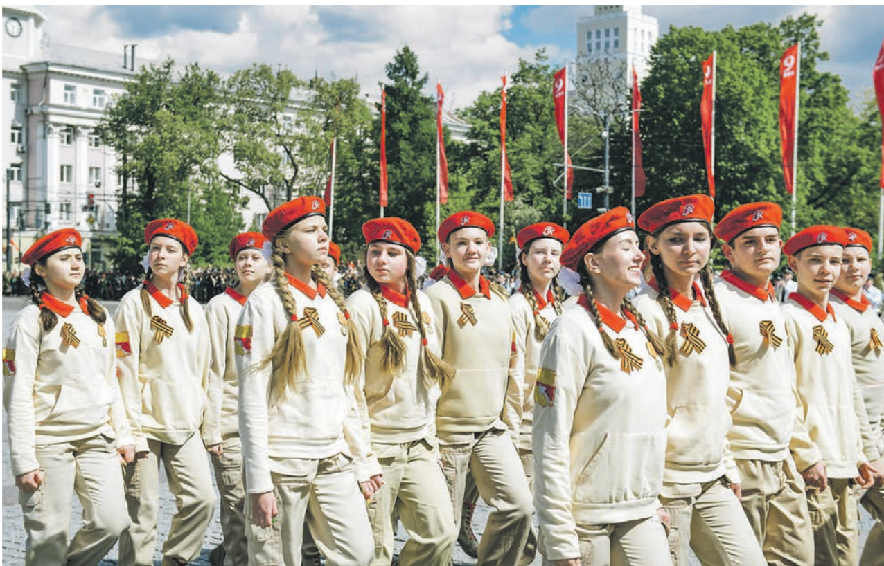
Юнармейцы уже традиционно участвуют в Параде Победы в Воронеже

ОПОРА СТРАНЫ • Кого принимают в юнармейцы и какими делами они славятся