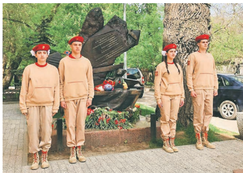
Почётный караул у мемориала «Детям войны» на ул. Театральной

Стать юнармейцем могут дети и подростки в возрасте от 8 лет. Во время церемонии посвящения в юнармейцы, как и когда-то пионеры, ребята произносят торжественное обещание. Быть всегда опрятными и подтянутыми им помогает форма: ежедневная камуфляжная и парадная бежевая (она была разработана в 2018 году для парада на Красной площади). Выглядит парадка вполне современно: яркие красные береты и футболки, а также толстовки, брюки и высокие ботинки-берцы песочного цвета. Также члены движения имеют свою атрибутику — на значке юнармейца изображён орёл и звезда Минобороны РФ.