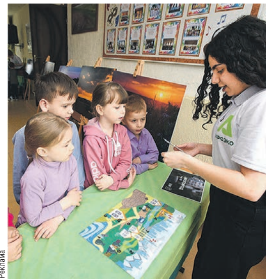
Организаторы экофестиваля придумали разноплановую программу для детей всех возрастов

БЛАГОТВОРИТЕЛЬНЫЙ ФОНД «АГРОЭКО» работает с 2016 года, его ключевая цель – развитие сельских территорий. АГРОЭКО является партнёром муниципалитетов для участия в соответствующих госпрограммах. Фонд помогает в развитии социальной инфраструктуры, восстановлении и поддержке объектов образовательного, культурного, природоохранного значения.