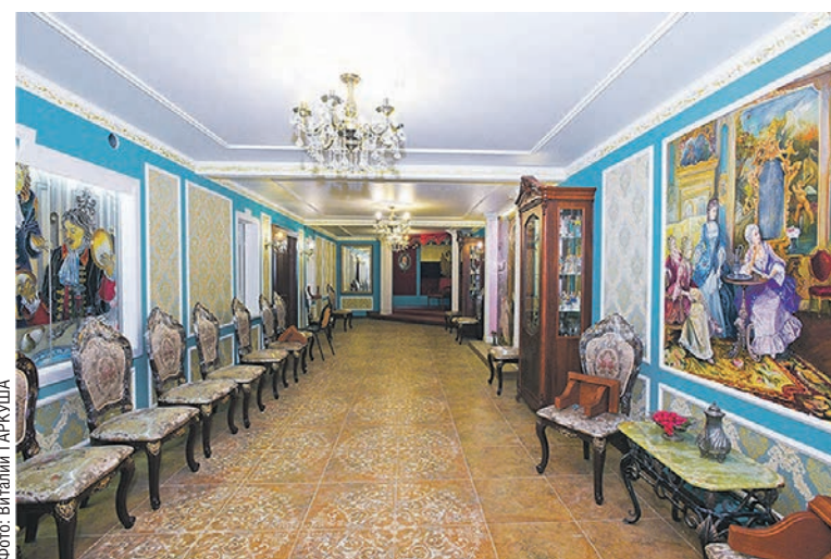
В зале Ассамблеи будут проходить не только экскурсии, но и торжественные мероприятия