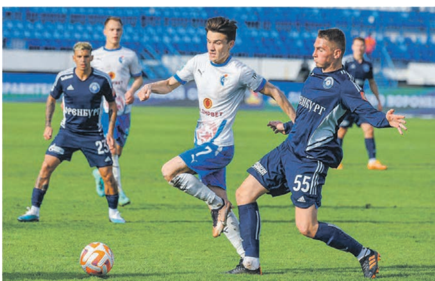
В игре с «Оренбургом» воронежцы продемонстрировали боевой характер, но для положительного результата этого оказалось недостаточно