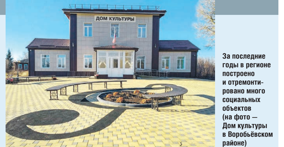
За последние годы в регионе построено и отремонтировано много социальных объектов (на фото – Дом культуры в Воробьевском районе)

– Мы стараемся идти по принципу масштабных работ в нескольких населённых пунктах, – отметил губернатор. – В частности, в Бобровском районе мы