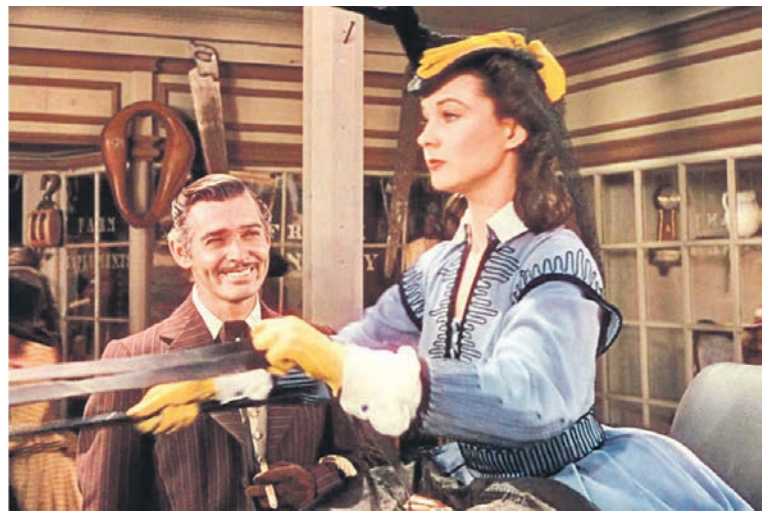
Кадр фильма «Унесённые ветром» 1939 год

прима-балерина Воронежского театра оперы и балета: