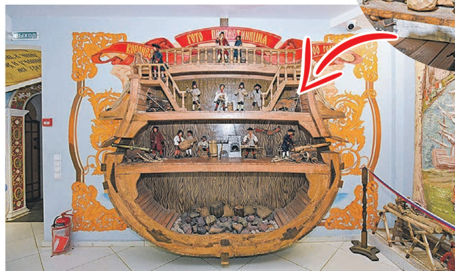
В музее можно увидеть корабль «Гото Предестиния» в разрезе

Более 30 тыс. человек посетили музей с момента открытия