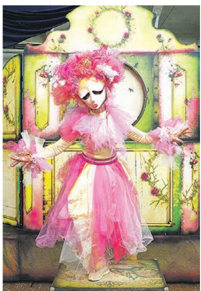
В постановке будут задействованы и куклы, и актёры в живом плане. Все девять персонажей удивят воронежцев необычными костюмами

В честь открытия легендарного фонтана «Дюймовочка» воронежцам готовят сюрприз — уличный спектакль (6+) в исполнении актёров Театра кукол. Обращение к сказке Андерсена понятно и оправдано. Однако в данном случае зрителей ждёт не канонический спектакль, а динамичное зрелище в духе площадного театра. И это неудивительно, ведь за создание спектакля взялась команда самого известного уличного театра России — «Странствующие куклы господина Пэжо» (Санкт-Петербург).