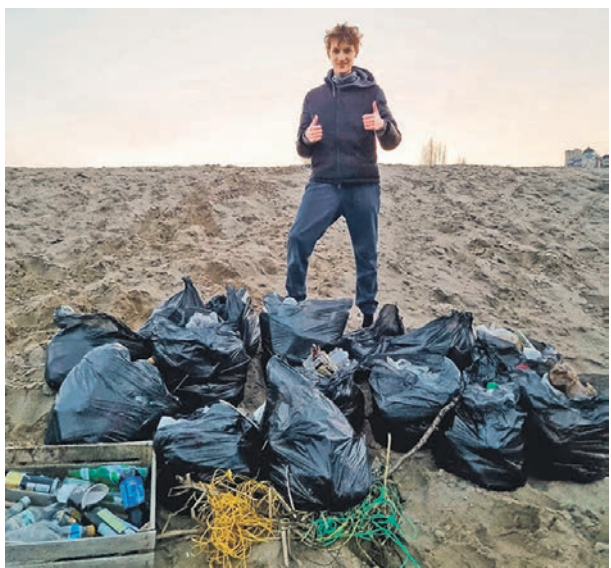
Парни собираются регулярно проводить экосубботники

Двое молодых воронежцев собрали на берегу водохранилища 16 мешков мусора