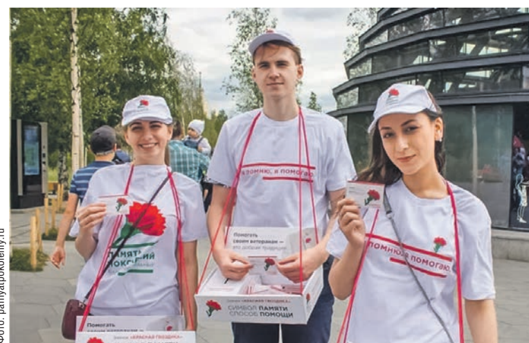
В прошлом году в ходе акции удалось собрать более 150 тысяч рублей

В акции примут участие более 150 волонтеров, прошедших специальное обучение. Кстати, добровольцем может стать любой желающий, зарегистриро-