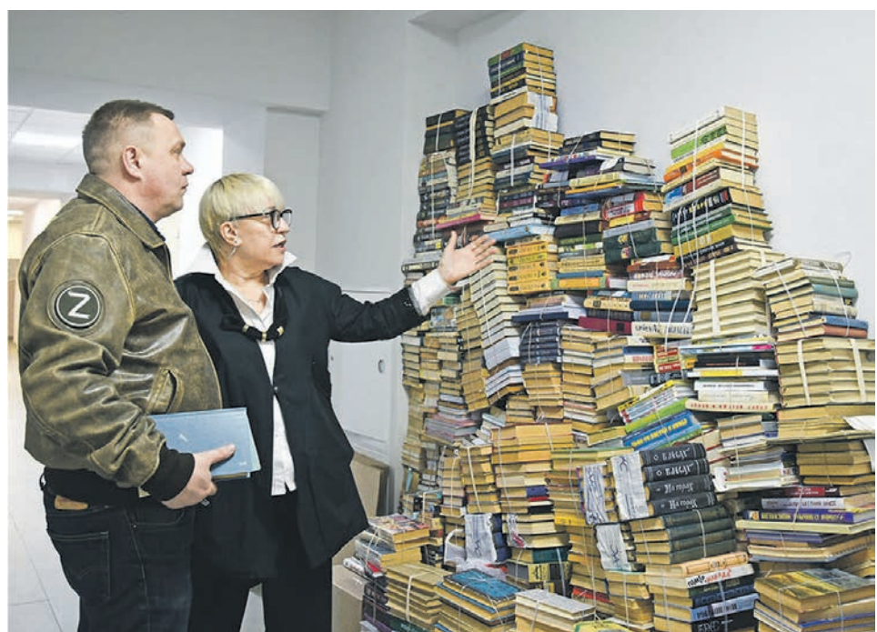
К книжному марафону медиахолдинга «Губерния» быстро подключились простые воронежцы – люди передавали целые домашние библиотеки

Книжный марафон, инициированный медиахолдингом «Губерния» и депутатом Госдумы РФ Игорем Кастюкевичем, продолжается. Поделитесь своей библиотекой с жителями Донбасса можно, позвонив по телефону (473) 272-74-61.