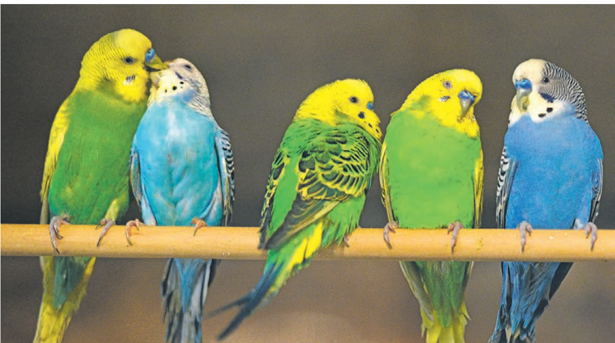
Волнистые попугаи—очень верные птицы: они выбирают одного партнёра на всю жизнь

граммов весит взрослый волнистый попугай. А вес птенца составляет всего 2 грамма.