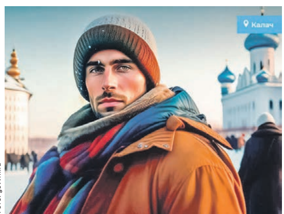
Нейросеть изобразила населённые пункты Воронежской области в виде людей