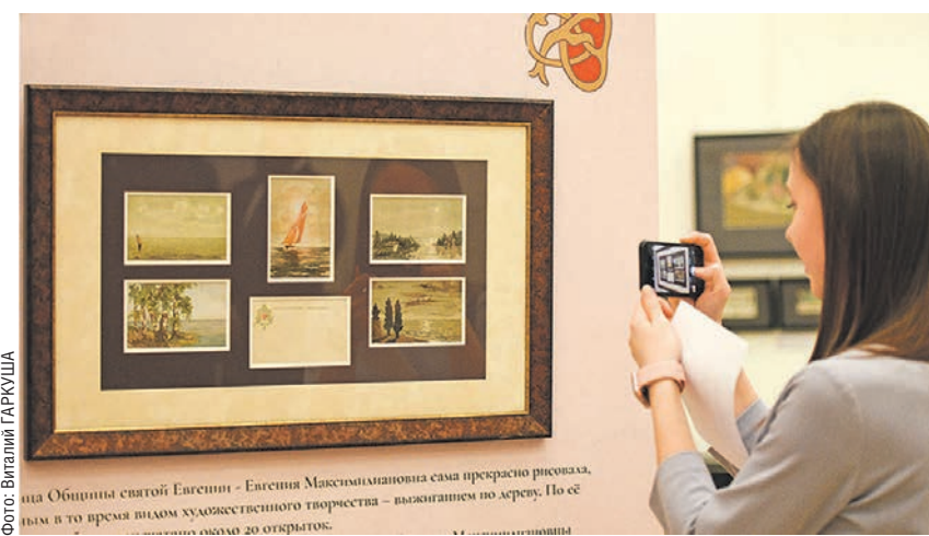
На выставке представлено около 100 книг и открыток из ведущих музеев России

Среди экспонатов выставки можно увидеть рисунок Ильи Репина с необычной судьбой. В 1899 году