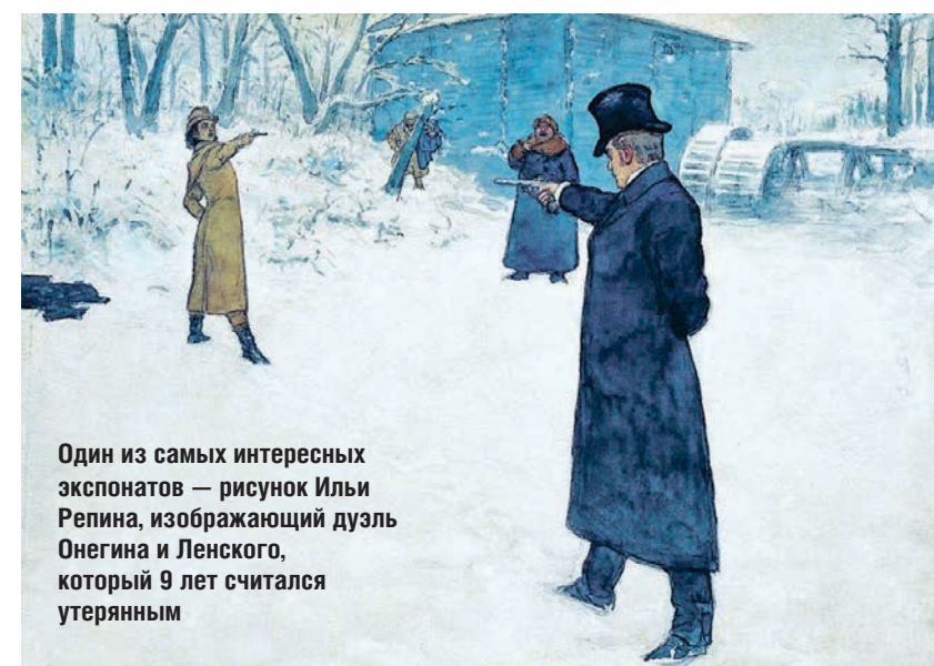
Один из самых интересных экспонатов — рисунок Ильи Репина, изображающий дуэль Онегина и Ленского, который 9 лет считался утерянным

Евгения Ольденбургская привлекла к этому проекту лучших художников своего времени. Среди авторов рисунков для открыток были такие мастера, как Репин, Билибин, Васнецов, Верещагин, Нестеров. Все они сотрудничали с Общиной бескорыстно. Часто на открытках можно было увидеть пейзажи с видами старинных русских городов и памятников архитектуры. Это позволяло простым людям через дешёвую почтовую открытку познакомиться с историей