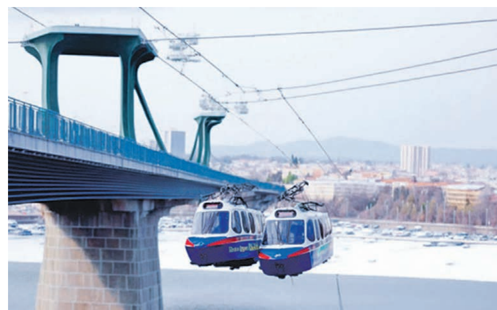
Так в представлении нейросети может выглядеть фуникулёр в Воронеже

Также на основе искусственного интеллекта работает большинство камер видеонаблюдения. Именно нейросеть фиксирует автомобилистов, которые превысили скорость или не пристегнули ремень безопасности. Кроме того, искусственный интеллект неплохо справляется с изменением стиля текста. Он может без труда