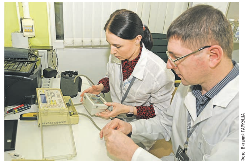
По словам специалистов, проверять тонометры нужно не реже одного раза в год

Как пояснили специалисты, производители тонометров их срок годности не ограничивают. Однако проверять приборы для измерения давления желательно не реже одного раза в год. Те, кто не успел это сделать в рамках акции «Будь уверен! Будь здоров!», могут