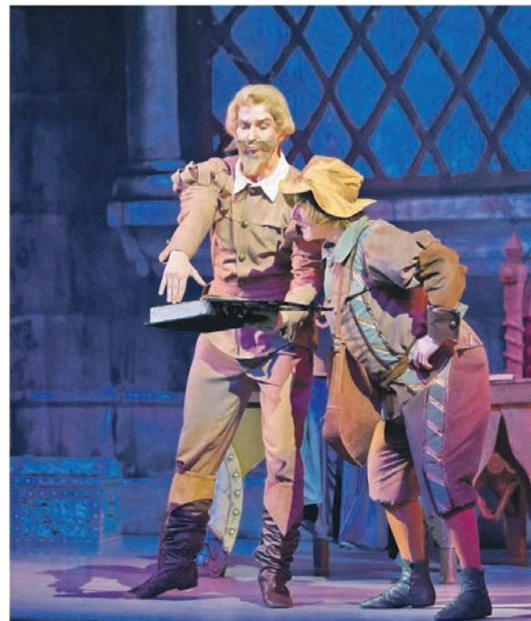
Балет «Дон Кихот» каждый раз проходит с аншлагом