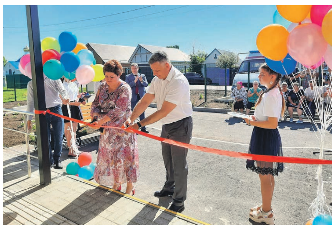
В прошлом году в Россосанском районе открылась новая врачебная амбулатория (с. Поповка), при которой есть жильё для врача

В районе собрано 300 тыс. тонн зерна (рост к 2021 году 127,8%) при средней урожайности 40,0 ц/га. Это лучший показатель урожайности за последние 5 лет! Валовой сбор подсолнечника—60,1 тыс. тонн, что выше уровня 2021 года на 30,5%, а средняя урожайность составила 28,2 ц/га. Россосанский район занял третье место в области по производству зерна и второе место по валовому сбору подсолнечника. Валовой сбор сахарной свёклы в физическом ве-