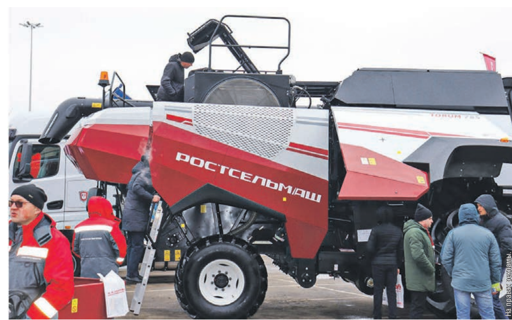
По словам аграриев, техника Ростсельмаш показывает высокую надёжность и производительность

10 марта в столице Черноземья состоялся межрегиональный агропромышленный семинар-выставка «Воронежагрокомплекс-2023»