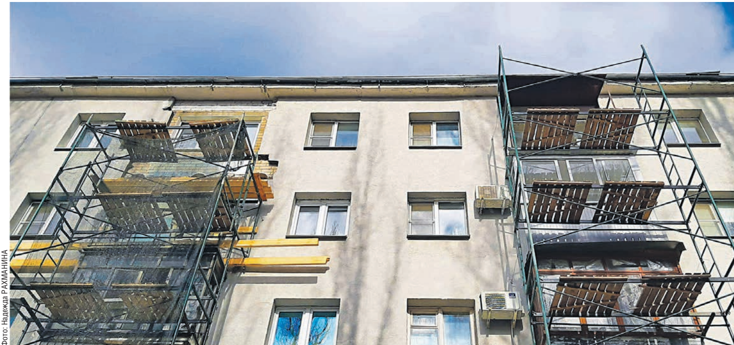
Чтобы ускорить сроки капремонта в доме, жильцам необходимо подать обоснованную заявку в областной департамент ЖКХ и энергетики

Однако гораздо важнее оказалось то, что на ремонтные работы попросту не