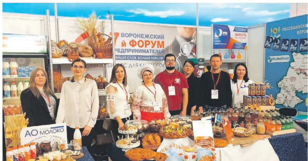
Россосанские производители достойно представляют район на различных выставках и форумах

Ещё раз подчеркну, что главный упор администрация района делает на социальную стабильность. В центре нашего внимания были и будут люди и их проблемы.