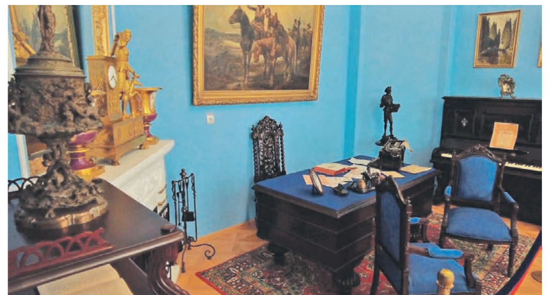
В Борисоглебском музее тщательно воссоздана атмосфера купеческого дома XIX века