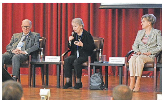
На форуме собрались представители власти, научного сообщества, врачи государственных и коммерческих клиник

В целом офтальмологическая служба Воронежской области хорошо развита.