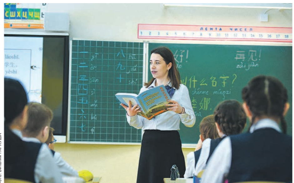
В образовательном центре «Лидер» ученикам преподают даже китайский язык