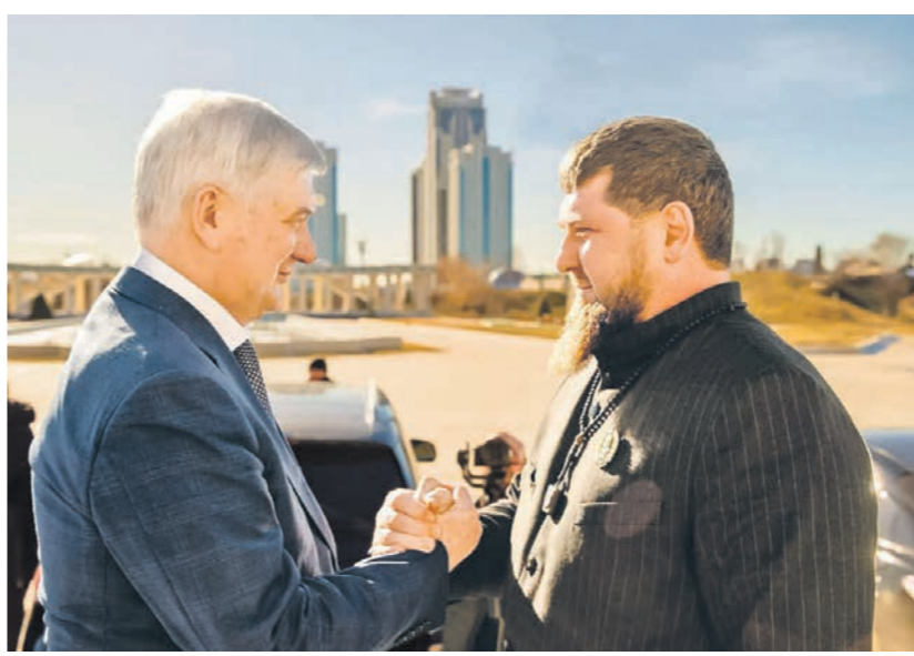
В ходе визита в Чечню Александр Гусев и Рамзан Кадыров подписали Соглашение о сотрудничестве двух субъектов Федерации

Здесь уже введены в эксплуатацию тактический городок, аэродинамический комплекс, стрелковые и снайперские полигоны. В планах — открытие программ по водолазной, кинологической, инженерной, автомобильной и IT-подготовке, а также госяхране. Здесь глава области выполнит ряд стрельб из нарезного оружия, стоящего на вооружении воинских и специальных частей.