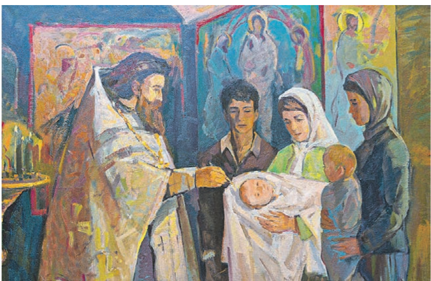
В своих работах художники затронули близкие воронежцам сюжеты (на фото картина «Миропомазание», Е. Кононова)

В Музейно-выставочном центре ВГУ открылась экспозиция «Моя семья»