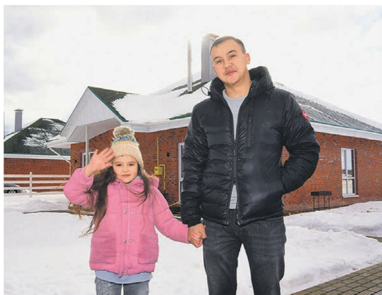
В экодеревне под Бобровом уже радуются новоселью первые жители