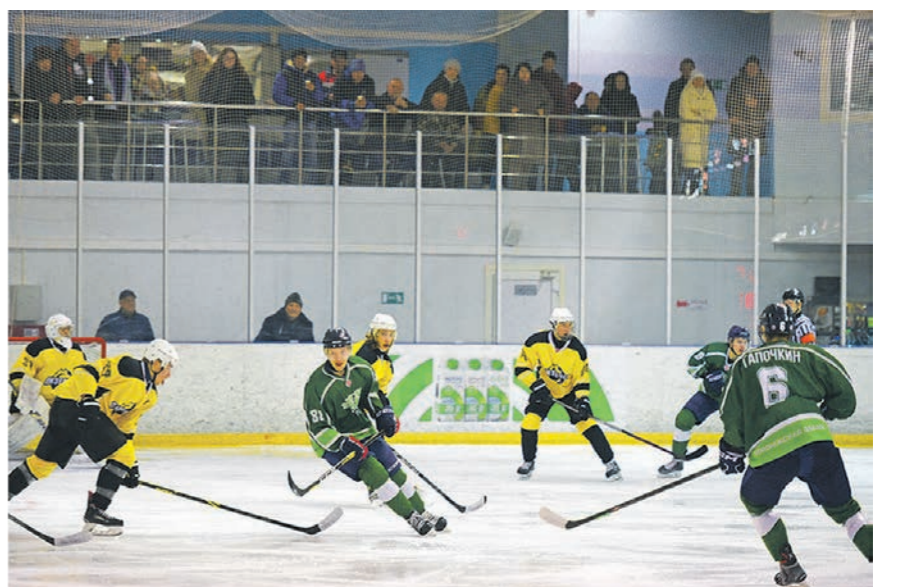
Взаимодействие властей и бизнеса дало мощный толчок развитию спорта в районе