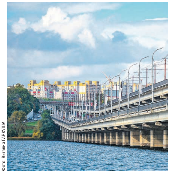
Протяжённость Северного моста составляет 1,8 км

потратят в 2023 году на благоустройство парков, скверов, площадей, улиц и набережных в Воронежской области. Планируется обновить 31 общественное пространство.