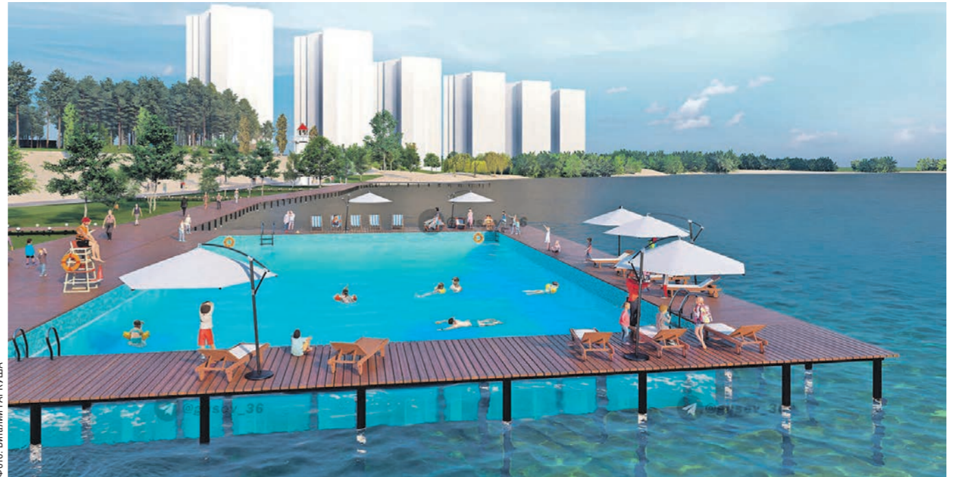
В бассейн будет поступать очищенная вода из водохранилища

А что в планах? До 2025 года концессионер собирается построить детское кафе, небольшой спорткомплекс и VR-зал, где воронежцы смогут перенестись в виртуальный мир. Ещё один масштабный