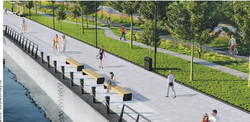
Первую очередь обновлённой набережной откроют в сентябре

В прошлом году начались работы по реконструкции Петровской набережной — на участке в чуть более 11 га от Чернавского моста до Адмиралтейской площади. Обновлённую часть излюбленного горожанами места отдыха откроют в сентябре 2023 года. Здесь, напомним, обновят входную группу, восстановят ограждение, проложат новый тротуар и велодорожки. Ширина прогулочной зоны составит 6 метров. Причал для теплохода «Москва-16» тоже будет готов уже в этом году. Его выполнят в виде двухуровневого деревянного навеса.