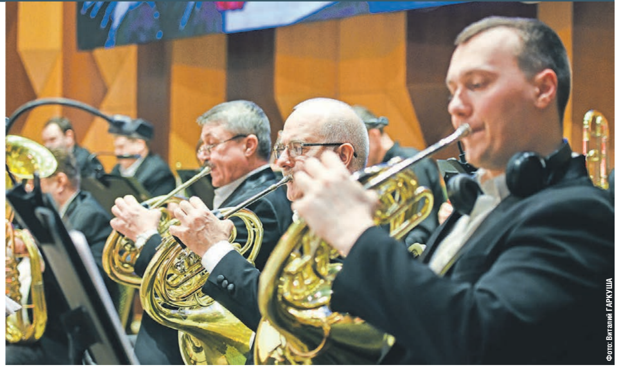
На концерты воронежского эстрадно-духового оркестра с удовольствием ходит публика разных возрастов

ИСКУССТВО • Песня о Чижовском плацдарме, мелодии из мультфильмов и саундтрек-шоу: чем удивит воронежцев Губернаторский эстрадно-духовой оркестр