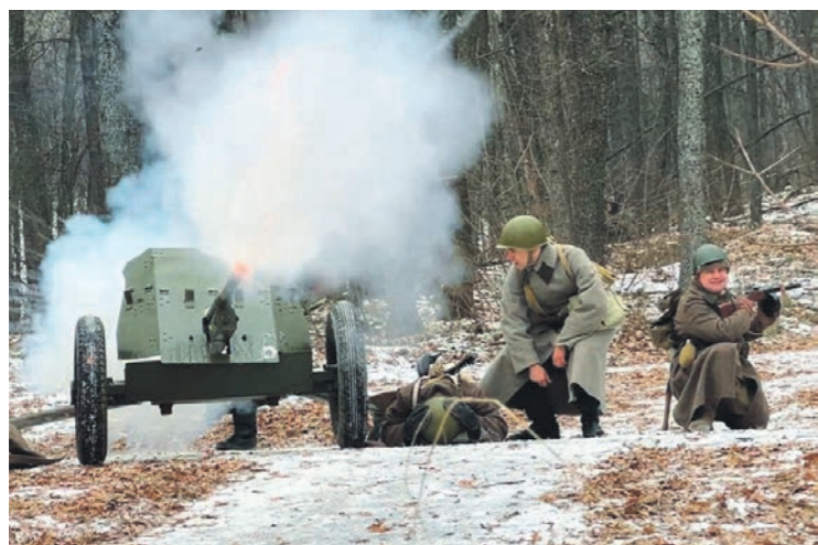
Как прошла военно-историческая реконструкция, посвящённая 80-летию со дня освобождения нашего города