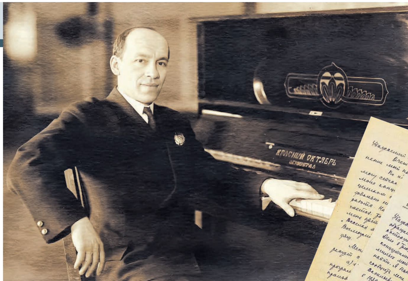
Исаак Дунаевский был в Воронеже дважды, и каждый раз от почитателей таланта маэстро не было отбоя