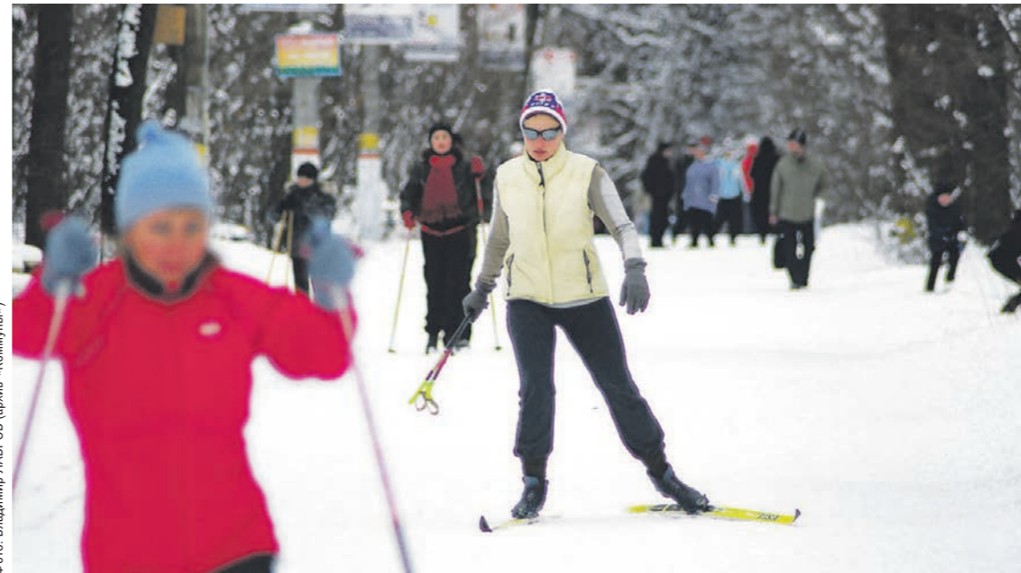
(справа — Кликуны)

Мы обновим, что летом 2022 года губернатор Александр Гусев посетил спортивно-оздоровительный комплекс «Олимпиада» и высказал свои пожелания относительно его обновления. По поручению главы региона были проведены две очереди реконструкции. Первая предполагает создание организованной (а не хаотичной, как сейчас) автостоянки. Так как территория Нагорной дубравы является особо охраняемой зоной, строительство парковки воронежские власти согласовывали в Минприроды. Как сообщил гу-