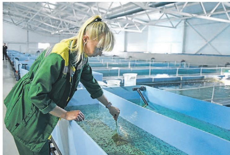
На ферме осетры живут в резервуарах, в которых может содержаться до 400 рыб общим весом 2,5 тонны

рублей может стоить 1 кг икры осетра-альбиноса. Она белого цвета, но по вкусу ничем не отличается от чёрной икры.