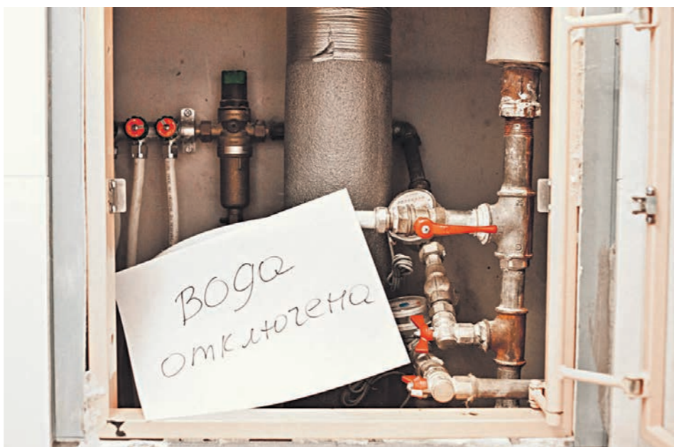
Причиной отключения воды в Воронеже в мэрии назвали вышедшие из строя скважины

ЖКХ • Почему в домах воронежцев постоянно отключают воду и как будет решаться эта проблема