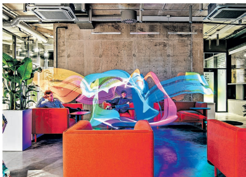
Этот необычный снимок сделали учащиеся «Матрёшки»