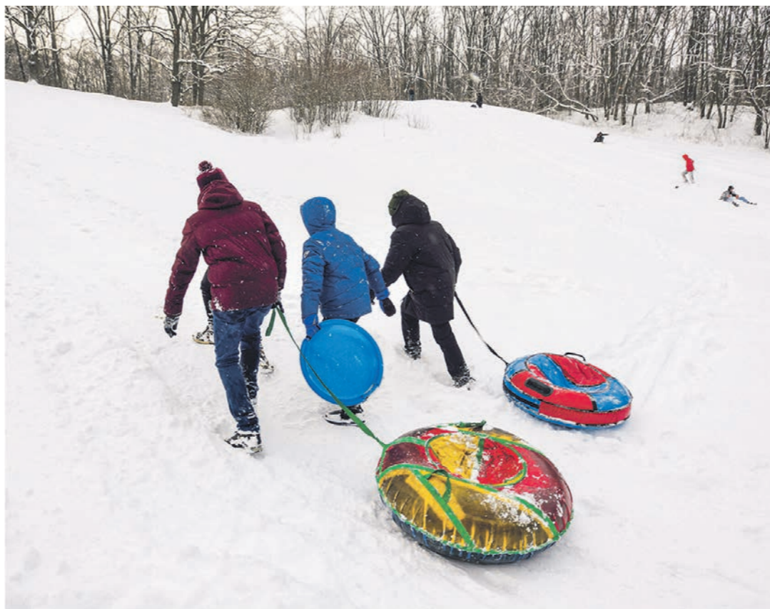
С начала года на Пионерской горке серьёзные травмы получили пятеро детей

В минувшую пятницу, 21 января, прямо на наших глазах один из подростков, летящих на «ватрушке», чуть не сбил своего друга, который в этот момент взбирался на горку. А рядом развлекались студенты, которые скатывались вниз на собственных куртках и при этом выделывали опасные кувырки и кульбиты. Молодые люди, по их словам, приходят сюда не в первый раз и уверены, что никакая опасность им не грозит. — На Пионерской горке я катаюсь уже три года — сюда мне удобнее всего добираться, —