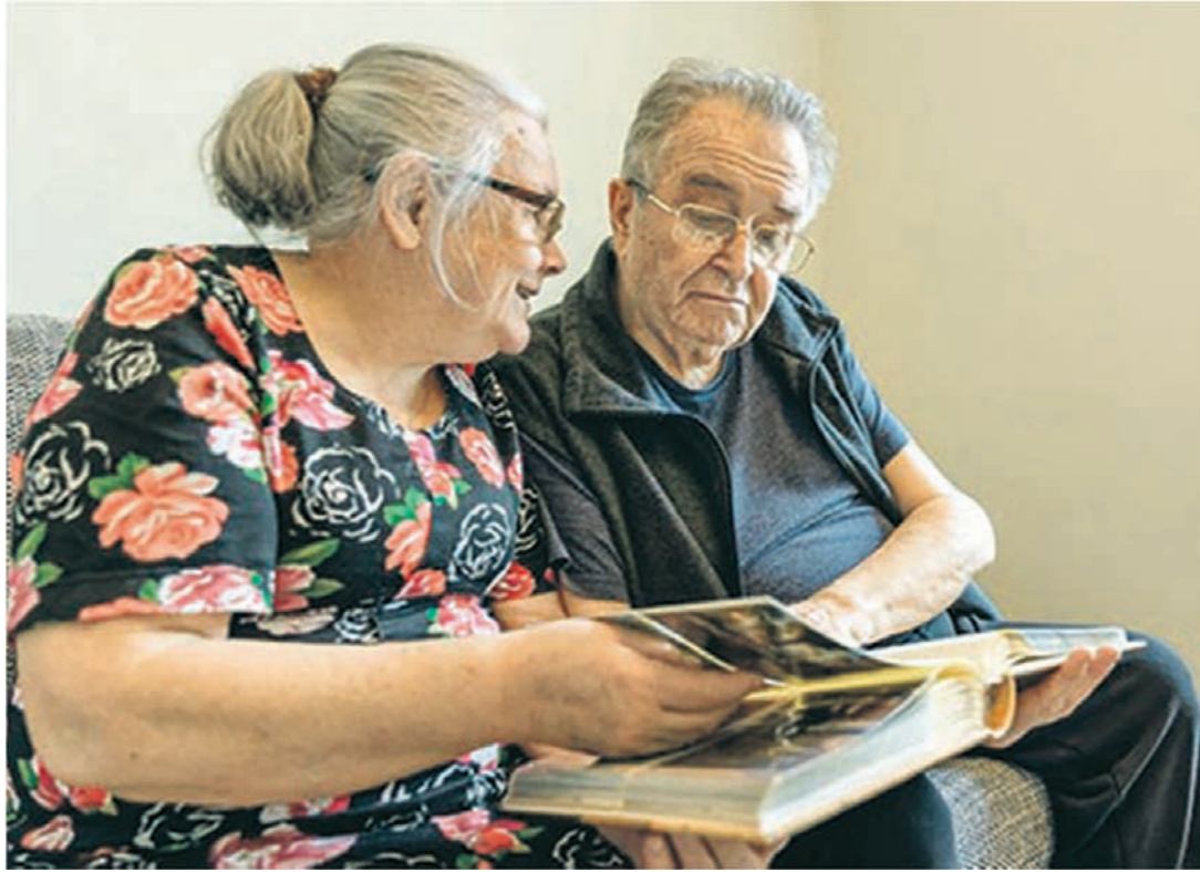
Благодаря индивидуальным программам ухода постояльцы домов-интернатов могут жить полной жизнью

В оронежская область – рекордсмен по строительству современных пансионатов для пожилых людей и инвалидов. За девять лет в регионе построено 8 домов-интернатов на 100 мест каждый. Первые такие учреждения, открытые в Бобровском и Новоусманском районах, стали одними из немногих в России интернатов, в которых работают по современным стандартам с использованием инновационных социальных технологий, а также отечественных практик, проверенных временем.