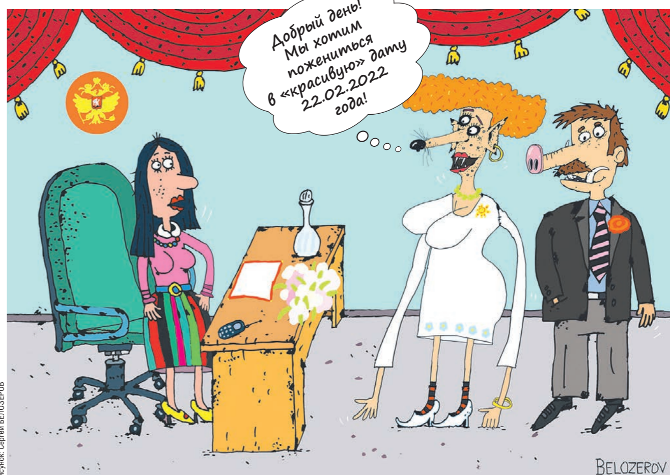
Рисунок Сергея БЕЛОЗЕРОВА

Как мошенники пытаются продавать «красивые» даты регистрации браков, читайте на стр. 4