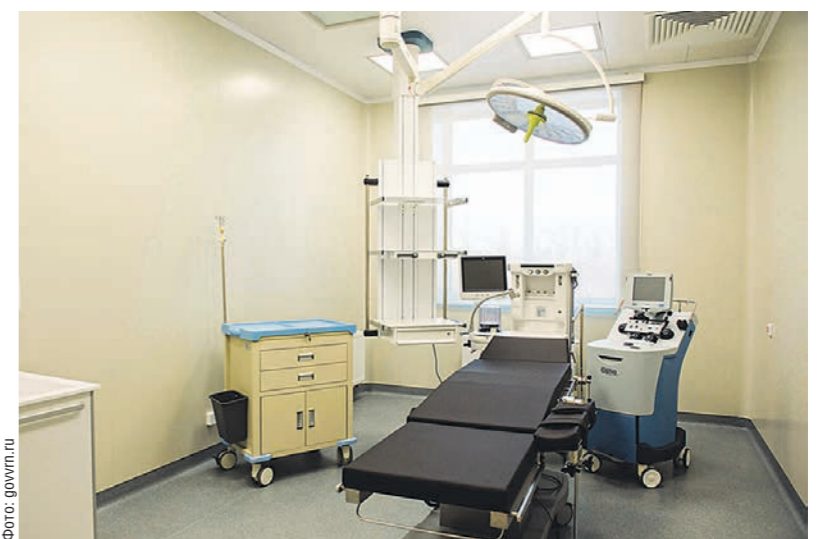
В рамках федерального проекта «Борьба с онкологическими заболеваниями» Воронежская область получит около 350 млн рублей

— Люди, которые страдают онкологическими заболеваниями, нуждаются в особом уходе, особом внимании. В период пандемии это тем более важно. Сделаем всё необходимое, чтобы и Центр ваш, и Воронежский областной клинический онкологический диспансер работали и были на самом высоком уровне оказания медицинской помощи — как жителям Воронежской области, так и людям, которые будут сюда приезжать, — подытожил Михаил Мишустин.