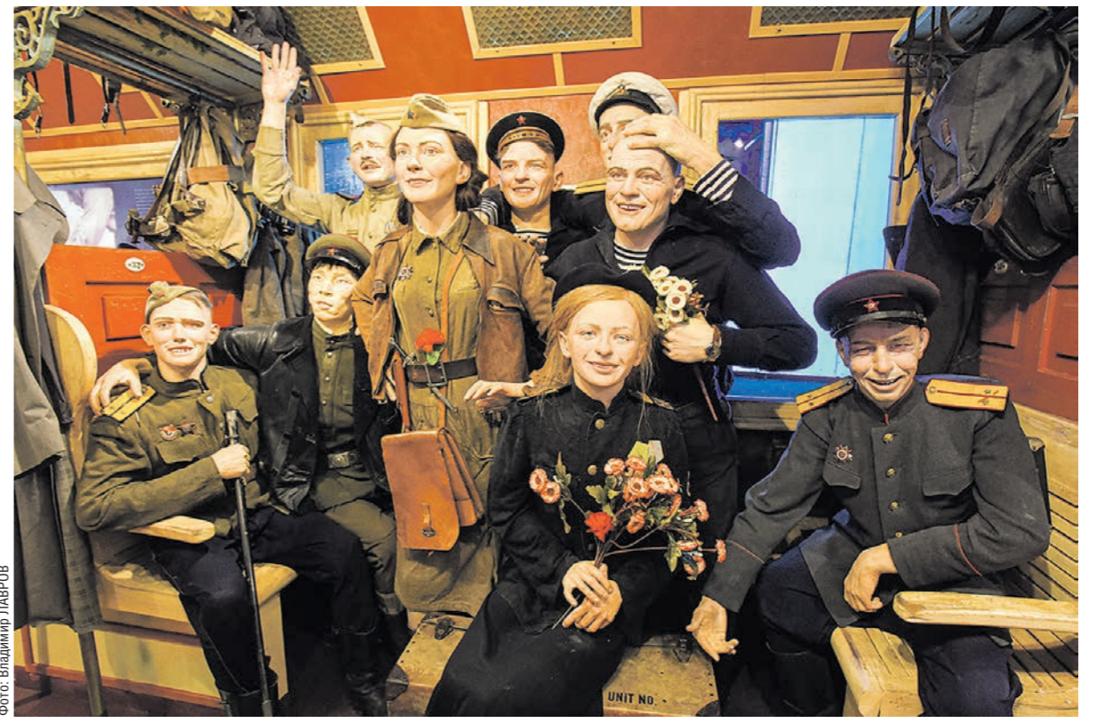
Последний вагон передвижного музея наполнен яркими эмоциями от Великой Победы

По соседству размещена экспозиция, посвящённая блокаде Ленинграда. Почти на 900 дней фашистские войска отрезали город от суши. Единственное, что соединяло его с Большой землёй, — «Дорога жизни» через Ладожское озеро. Здесь же проходит акция «Блокадный хлеб» — посетителям показывают хлебные карточки, рассказывают, сколько хлеба получали ленинградцы в дни блокады.