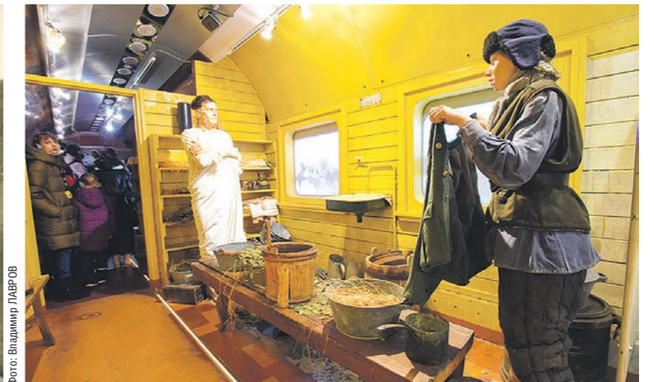
Экскурсия по «Поезду Победы» занимает около часа. За это время посетители могут «побывать» в Брестской крепости, блокадном Ленинграде, на поле боя и даже в концлагере