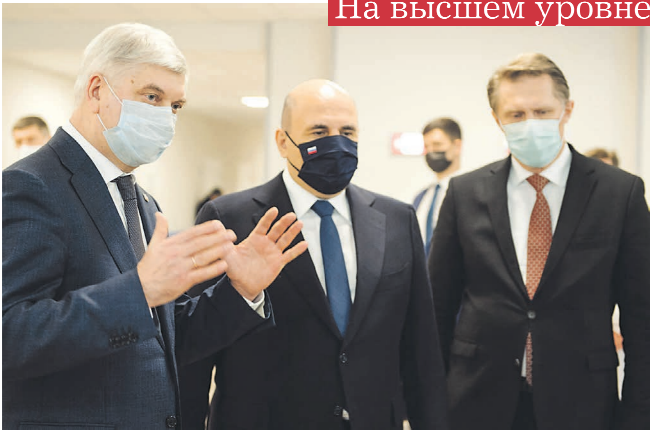
Михаил Мишустин пообещал Александру Гусеву помочь с финансированием радиотерапевтического корпуса онкодиспансера в Воронеже и поручил главе Минздрава Михаилу Мурашко проработать проектную документацию объекта

Председатель Правительства РФ Михаил Мишустин побывал с рабочей поездкой в Воронеже, где вместе с губернатором Александром Гусевым посетил объекты здравоохранения и промышленности