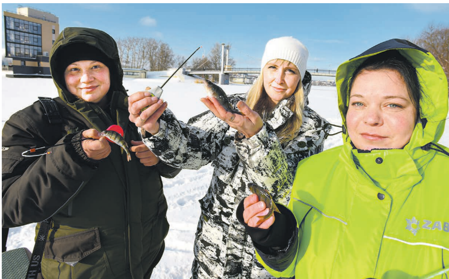
Воронежские «Пирания» выступают на соревнованиях по рыбной ловле наравне с мужчинами, а порой и бьют их рекорды