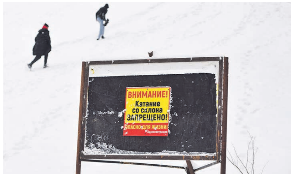
Предупреждение об опасности не останавливает любителей прокатиться с горки