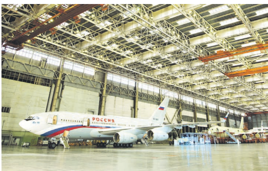
По словам Александра Гусева, ВАСО является системообразующим предприятием, поэтому важно, чтобы оно устойчиво развивалось

Председатель Правительства РФ Михаил Мишустин вместе с губернатором Александром Гусевым ознакомились с работой ПАО «Воронежское акционерное самолётостроительное общество» (ВАСО). На заводе члены делегации посетили выставку продукции предприятий российской авиационной промышленности, в том числе новейший самолёт МС-21.