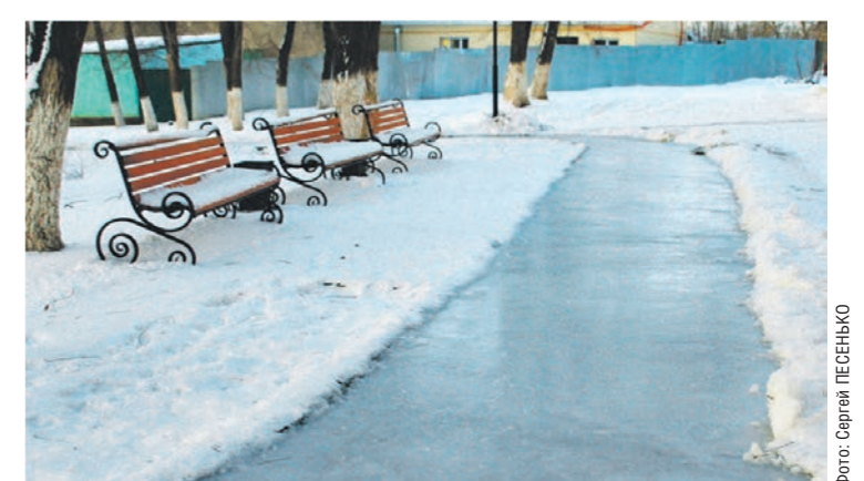
Протяжённость ледяного трека составила 300 метров

Она стала альтернативой хоккейной площадке