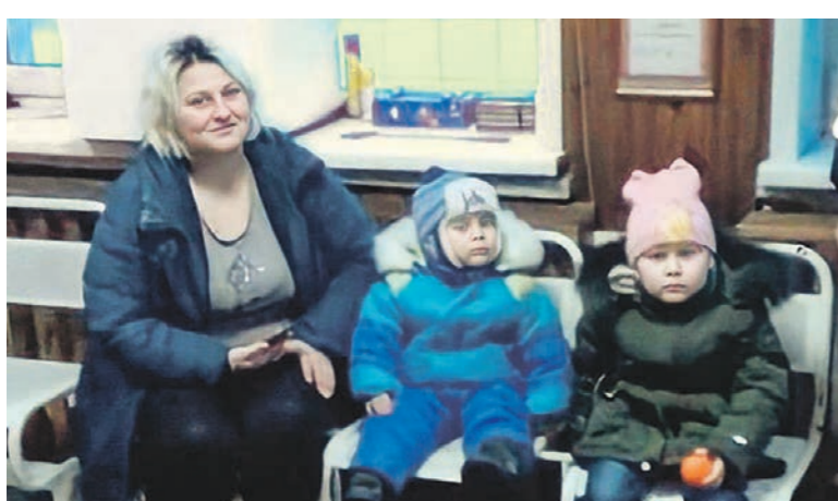
Замерзающей на трассе семье помогли инспекторы ГИБДД

Стражи порядка пересадили семью в патрульный автомобиль, где согрелись. Убедившись, что матери и детям не нужна медицинская помощь, инспекторы остановили попутный пассажирский автобус и попросили водителя подвезти пассажиров до Богучара.