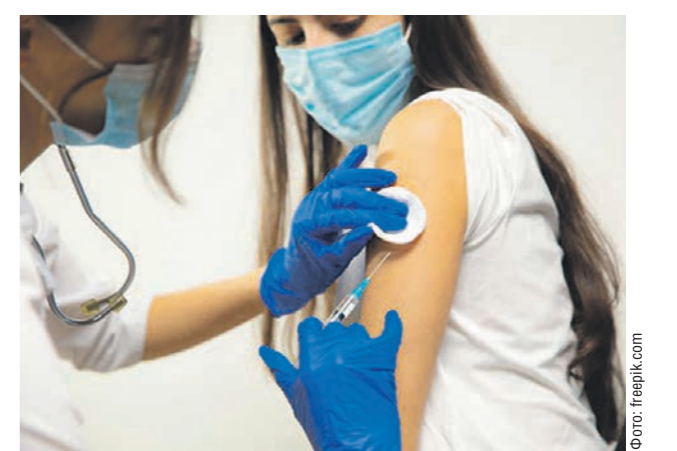
По мнению врачей, вакцинация остаётся главным оружием против коронавируса

Власти Воронежской области в преддверии очередной волны пандемии своевременно приняли ряд мер. С 17 января заведения общепита запрещено работать с 23 до 6 часов. Усилен контроль за соблюдением санитарных требований в общественных местах и образовательных учреждениях. В больницах развернуты дополнительные койки для детей, болеющих гриппом и коронавирусом.