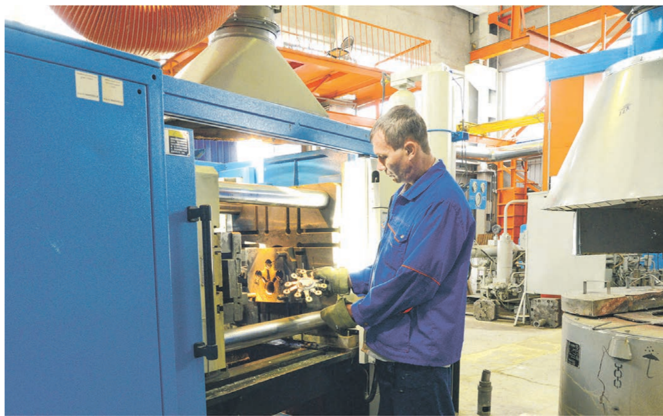
Достигать высоких показателей на воронежских предприятиях удаётся за счёт усовершенствования технологических процессов

ПЕРСПЕКТИВА • Как бережливые технологии помогают улучшить показатели воронежских предприятий