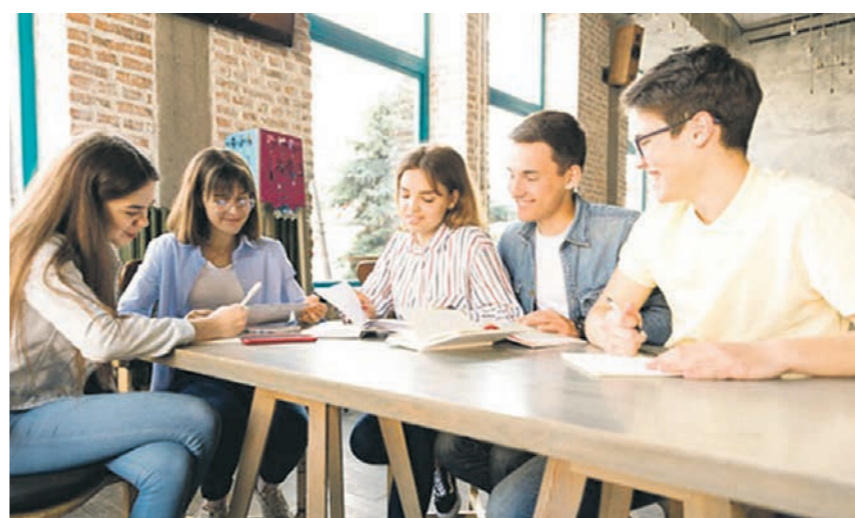
Создание «многого» кампуса в Воронеже повысит привлекательность нашего региона для иногородних студентов

— Мы с пониманием относимся к этому процессу. Он нацелен на то, чтобы система подготовки кадров пришла в соответствие с требованиями рынка труда. Некоторые профессии просто устарели, изжили себя, а некоторые настолько изменились, что все необходимые навыки можно получить на краткосрочных курсах. Кроме того, существует тенденция к укрупнению специальностей по принципу расширения квалификаций. Вот пример: в Воронежской области есть школа наездников, в которую приезжают учиться ребята со всех уголков страны. Там была профессия — младший ветеринарный фельдшер. Теперь же осталась только более универсальная специальность — «ветеринария». Но её программа подготовки включает, в том числе, и обучение фельдшерскому делу. То есть профессии не умирают, они просто трансформируются.