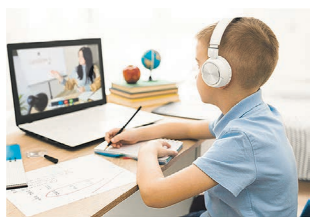
За время пандемии учителя и школьники адаптировались ко многим сложностям обучения в формате онлайн

Возник логичный вопрос: как в новых технических условиях «воспроизвести» классно-урочную систему? Именно таким путём вначале пошли педагоги. Но оказалось, что дистанционная форма обучения предъявляет совершенно новые требования к профессиональным качествам педагогов. Многие учителя стремились вставить в 30-минутный онлайн-урок (в начальной школе 15–20 минут) слишком много информации. Из-за недостатка времени материал часто освещался поверхностно, и значительная его часть отдавалась на самостоя-