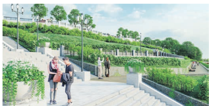
Набережную в Павловске реконструируют к марту 2022 года

Благоустроенное пространство составило одно целое с пляжем и сквером. Здесь появились спортивная, детская и смотровая площадки, шатровая сцена, дорожки для роллеров, велосипедистов и для пеших прогулок. В Павловске приобретает современный вид набережная