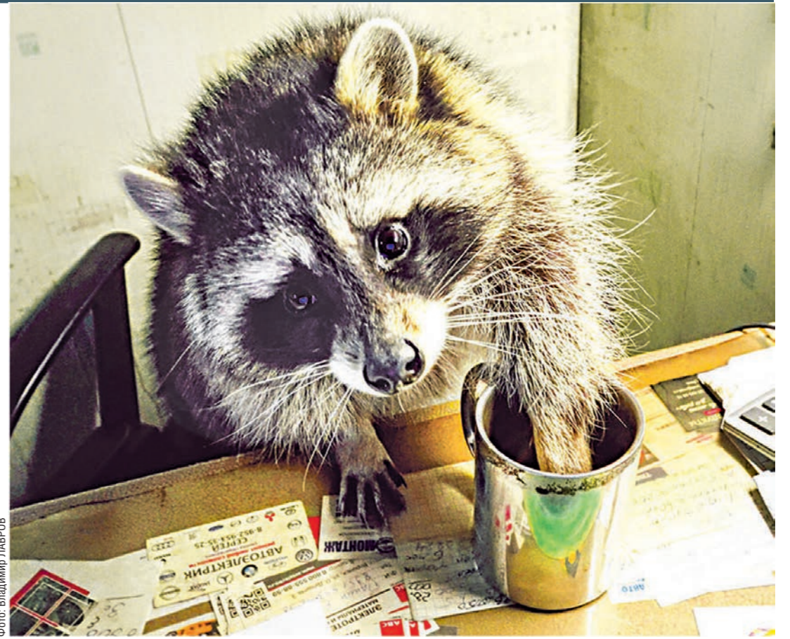
Любимое занятие енотов, обитающих в автомастерской, — прополоскать всё, что плохо лежит

ЖИВОЙ УГОЛОК • Как еноты-полоскуны «помогают» владельцу воронежской автомастерской чинить машины и почему воруют у посетителей часы и паспорта