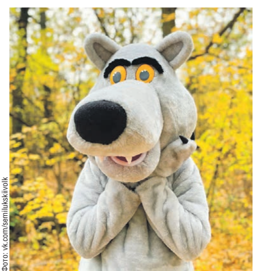
Семилукский волк тебе товарищ!