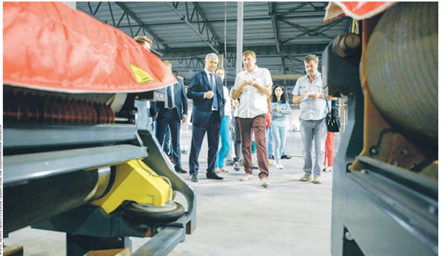
Работа по модернизации воронежской промышленности идёт не первый год и уже приносит свои плоды