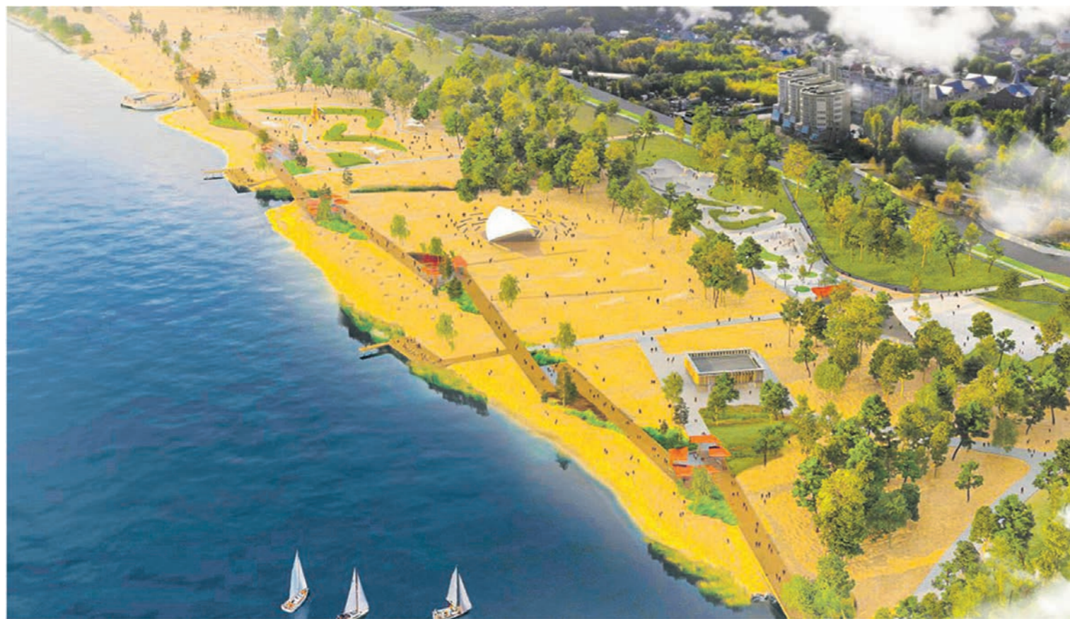
Авторы проекта основной акцент сделали на бережном отношении к природе. Прибрежную зону не будут закатывать в асфальт, а рядом с пешеходными дорожками появятся зоны отдыха и смотровые площадки

БЛАГОУСТРОЙСТВО • Как преобразится прибрежная зона после второго этапа реконструкции