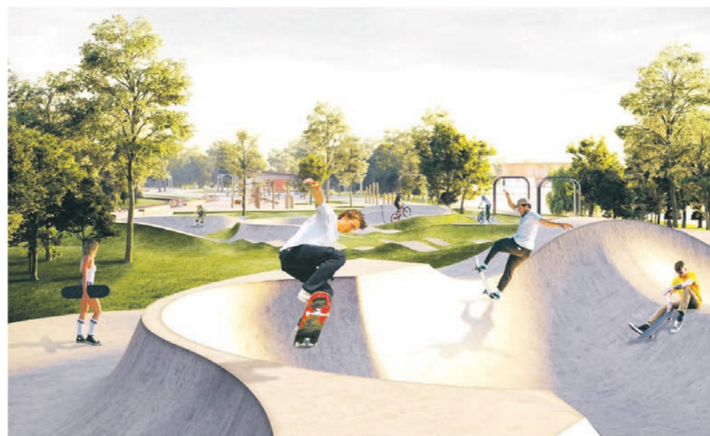
Для любителей экстремальных развлечений на набережной построят скейт-парк