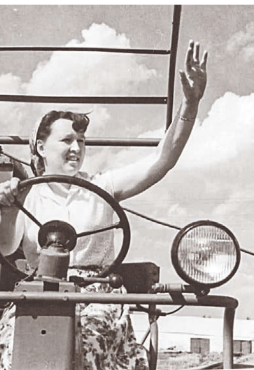
На съёмках выпуска программы «Нива»