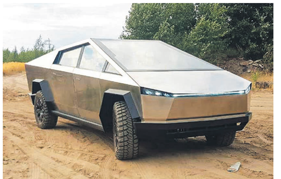
На постройку копии автомобиля будущего в воронежцев ушло 3 млн рублей и 1,5 года работы

– Мы зачищали швы и тёмные пятна от свар-