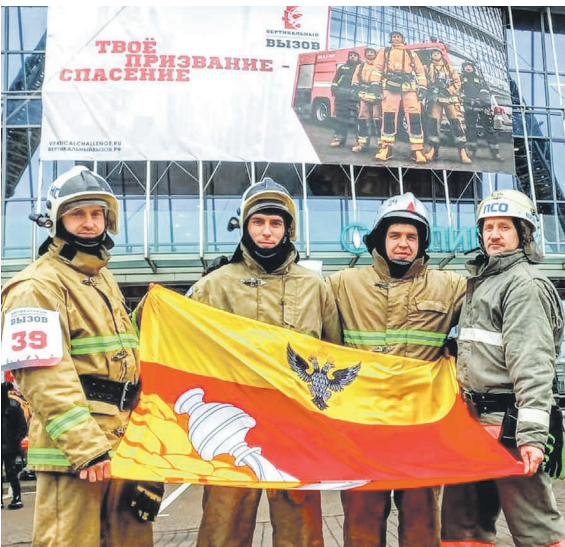
В Санкт-Петербурге воронежские спасатели в полном снаряжении покоряли 39-этажное здание

Навыки, полученные на «Вертикальном вызове», могут пригодиться спасателям в повседневной работе. Спасатели, в отличие от пожарных, на пожаре оказы-