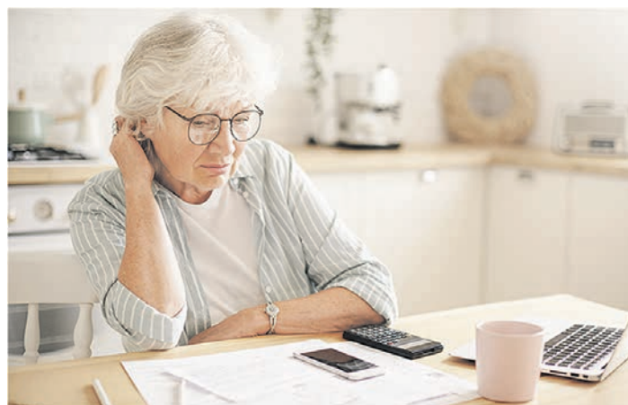
Оформить субсидию на оплату услуг ЖКХ можно в отделениях соцзащиты, в МФЦ или на портале «Госуслуги»

ту «коммуналки» в Воронеже не должны превышать 22% от дохода. Для пенсионеров, многодетных семей и одиноких матерей, получающих детские пособия, эта доля составляет 15%. Чтобы получить субсидию, необходимо иметь российский гражданство, быть зарегистрированным по месту жительства, а также представить документы, которые подтверждают право на получение компенсации. Кроме того, должна отсутствовать задолженность по оплате ЖКХ.