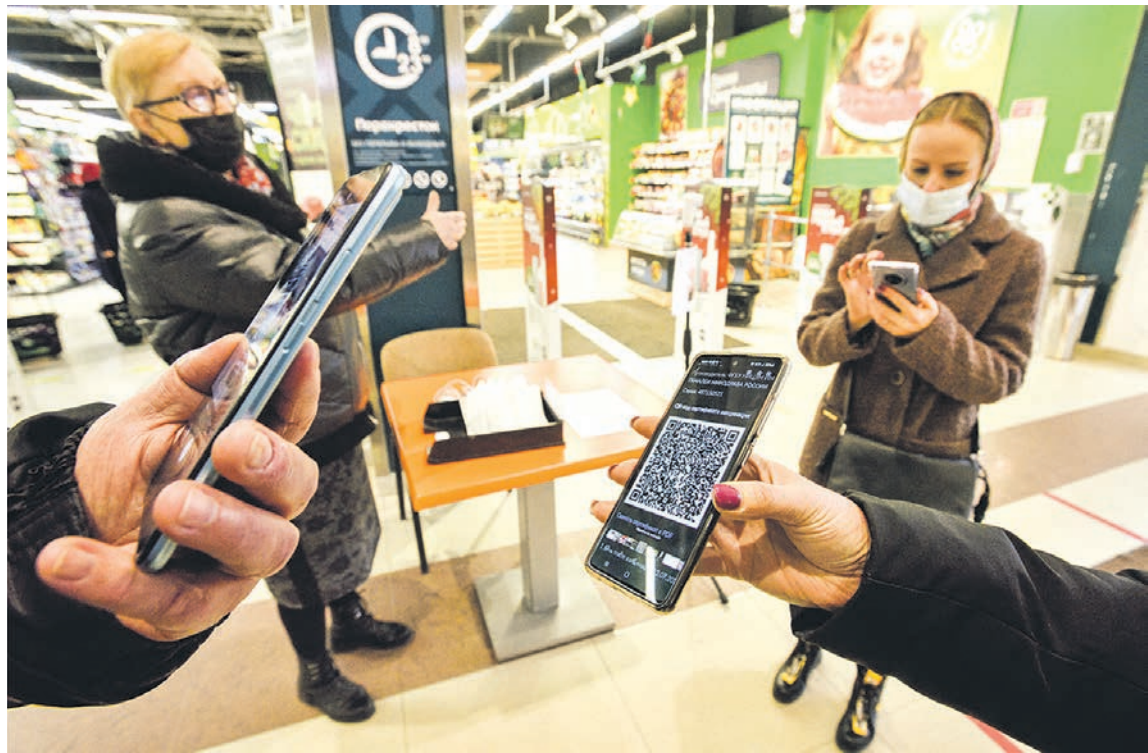
Тем, кто попробует попасть в торговый центр по чужому QR-коду, грозит штраф от 500 рублей

ПАНДЕМИЯ • Как работает система QR-кодов в Воронежской области и законно ли требовать паспорт при проверке цифровых пропусков