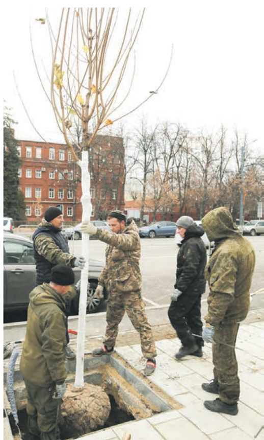
Чтобы укорениться в Воронеже, клёны проехали несколько тысяч километров

— Клён остролистный — дерево с очень компактной кроной. Это значит, что его крона и ветки будут расти вверх. Если клён правильно и своевременно обрезать, то это будет компактное и эстетичное дерево, — подчеркнула