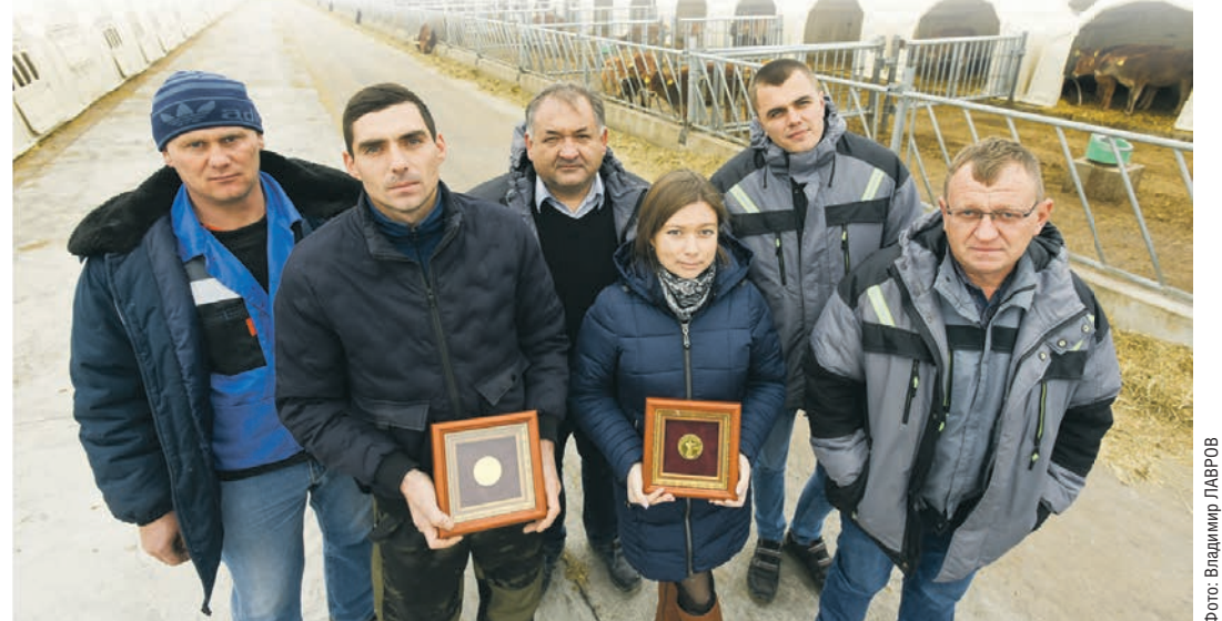
За достижения в области молочного и мясного животноводства СХП «Новомарковское» было удостоено золотых медалей на выставке «Золотая осень»