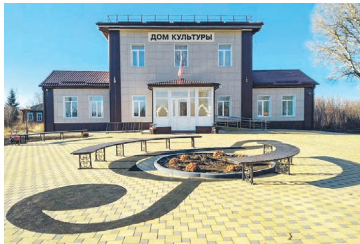
В 2021 году в Воробьёвском районе капитально отремонтировали несколько важных соцобъектов и обновили 30 км дорог