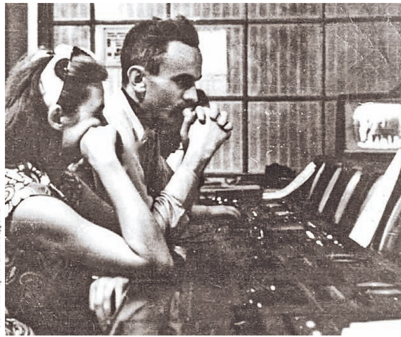
Некоторые программы Воронежского телевидения транслировались на весь Советский Союз и страны соцлагеря