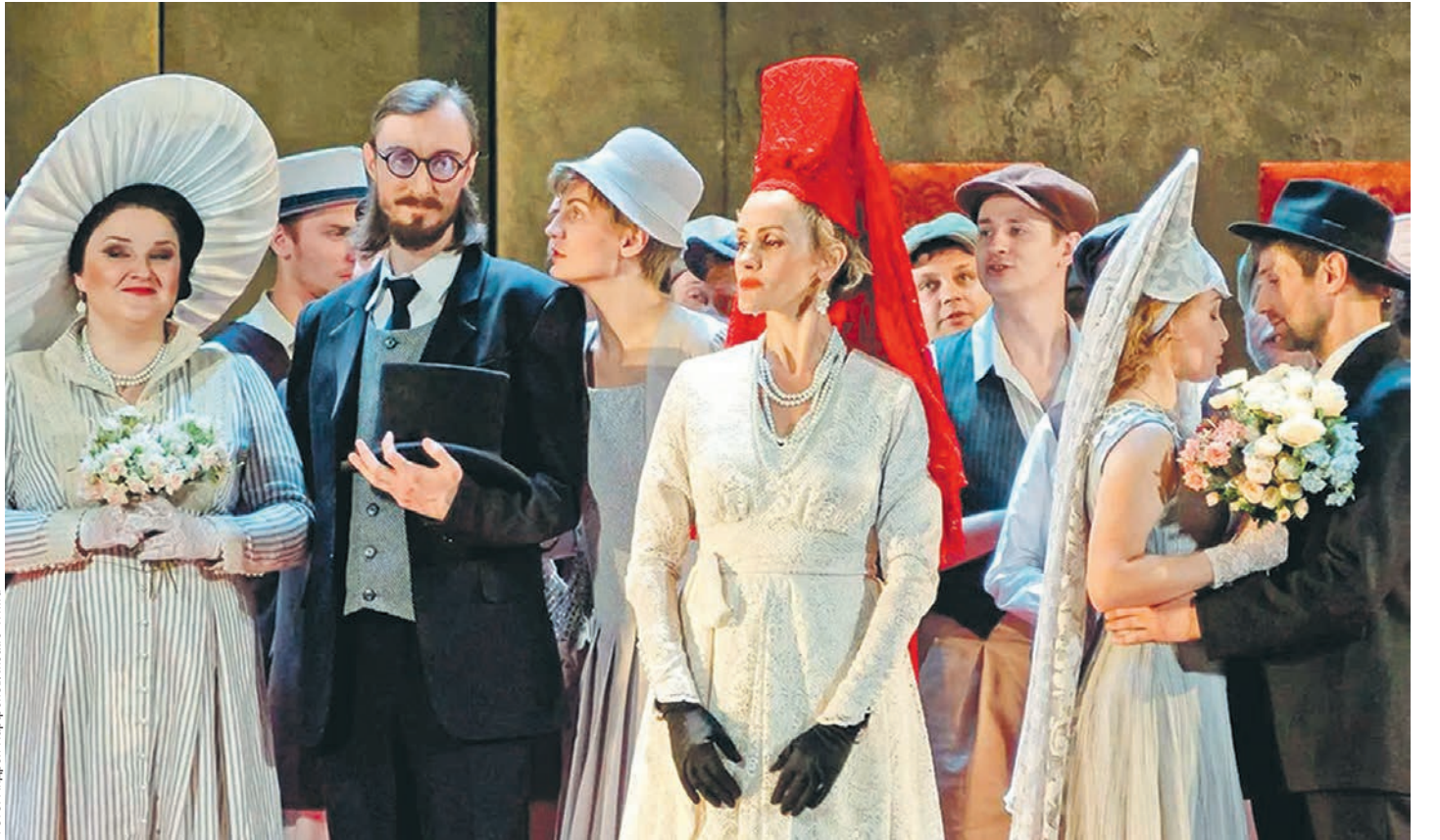
Режиссёр Михаил Бычков перенёс действие «Фигаро» из XVIII в XX век, сохранив при этом родной для персонажей итальянский язык

ИСКУССТВО • На театральную премию «Золотая маска» претендуют 3 спектакля воронежских театров и один танцевальный перформанс, причём опера «Свадьба Фигаро» представлена сразу в 6 номинациях