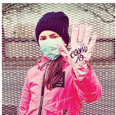
По мнению педиатров, маски можно носить, начиная с любого возраста. При этом важно менять их каждые 2-3 часа

Как показывает практика, проверка QR-кодов в разных общественных местах проходит по-разному. Где-то подход формальный и достаточно просто показать цифровой пропуск либо бумажный сер-