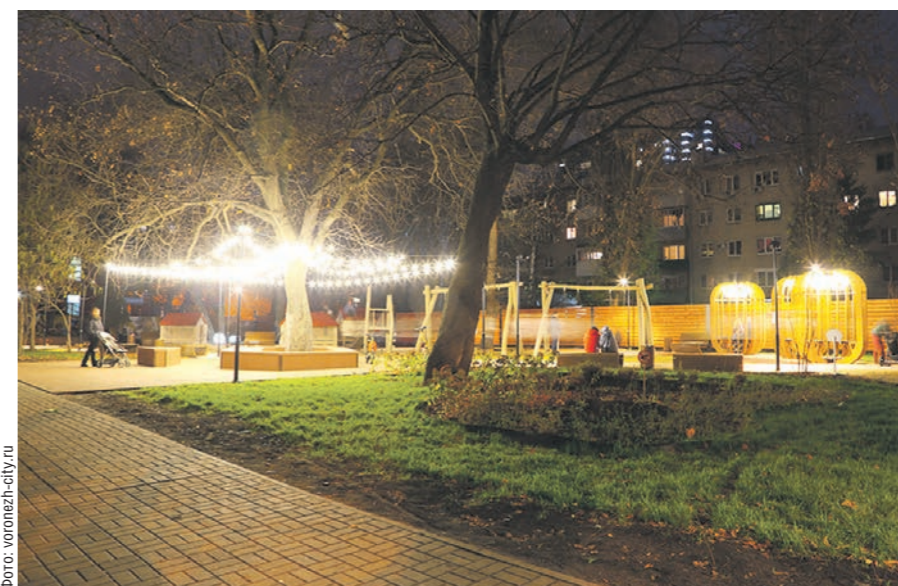
Никитинский сквер благоустроили на 8 месяцев раньше, чем планировалось

Проект реализован в рамках подпрограммы «Благоустройство общественных территорий» муниципальной программы «Формирование современной городской среды на территории городского округа город Воронеж на 2018–2024 годы». Его разработчиками стали региональный департамент архитектуры и градостроительства и БУВО «Нормативно-проектный центр». Воплотившим концепцию в жизнь подрядчиком выступило ООО «ПСТ Сервис».