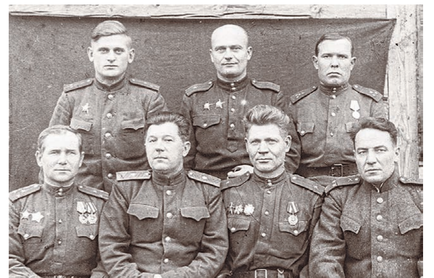
Командный состав 150-й стрелковой дивизии (в нижнем ряду второй слева — генерал Шатилов).

После окончания войны Василий Шатилов продолжал службу в армии. Вышел в отставку в звании генерал-полковника. Последние годы жизни Василий Митрофанович посвятил написанию книг о Великой Отечественной войне. Скончался ветеран 16 февраля 1995 года,