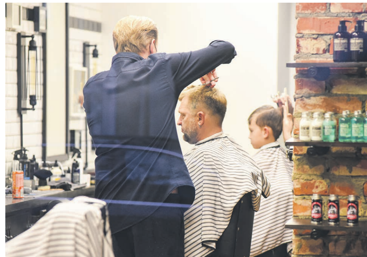
Парикмахер станет одной из специальностей, которую могут упразднить в техникумах и колледжах

ОБРАЗОВАНИЕ • Российские техникумы и колледжи могут прекратить приём на обучение по 43 специальностям, которые посчитали устаревшими