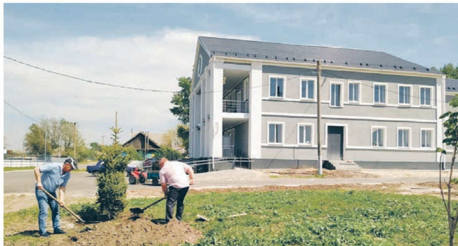
На оснащение ДК потратили более 12 млн рублей

В прошлом году закончили наружные работы, а в этом — закупили новую мебель и оборудование