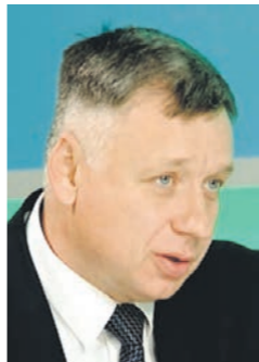
Глава администрации Россошанского муниципального района Воронежской области Юрий МИШАНКОВ

фасад, общедомовая территория, — не финансируются. Но конкретно лифты, тепловые узлы — по ним есть софинансирование. Плюс ко всему этому, по решению губернатора в 2019–2021 годах мы получили субсидию из регионального бюджета в районе 450 млн рублей. Именно на ремонтные работы.