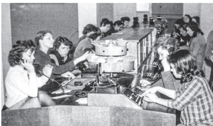
В результате начавшейся в 1972 году автоматизации абоненты получили возможность сами, без участия телефонисток, связываться между собой

В 1937 году в Воронеже построили Дом связи. В первые же дни войны многие работники Воронежского управления связи были призваны в ряды военных связистов. Оставшиеся в срочном порядке приняли сооружать резервный узел связи в подвале дома на углу ул. Алексеевского. В первых числах июля 1942 года было снято и вывезено в глубь страны стратегически важное оборудование. Телеграф, междугородная телефонная станция эвакуировались в Анну, затем в Борисоглебск. В городе разместился штаб Юго-Западного фронта.