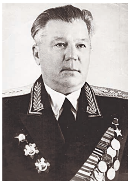
Герой Советского Союза Василий Митрофанович Шатилов

1 мая 1945 года разведчики Михаил Егоров и Мелитон Кантария водрузили над рейхстагом Знамя Победы. Дивизией, которая штурмовала главное здание фашистской Германии, командовал уроженец Поворинского района Василий Митрофанович Шатилов.