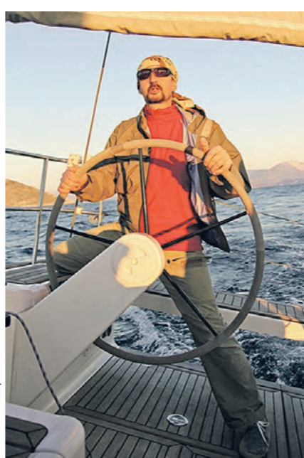
Роман начал путешествовать по рекам на надувном катамаране, затем бороздил моря на парусной яхте. Теперь его мечта — покорить океан