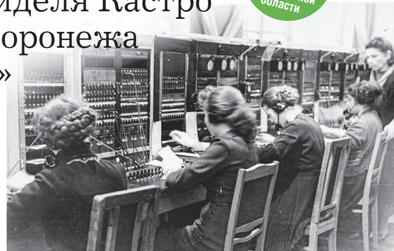
Телефонистки обладали хорошей памятью, были внимательными и усидчивыми

Цеха связи тогда работали в основном по его распоряжениям и как важные стратегические объекты были подготовлены к уничтожению на случай дальнейшего продвижения немцев.