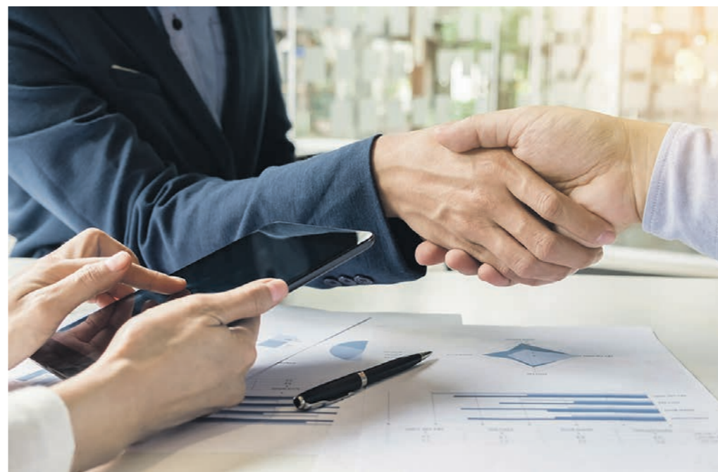
В рамках социального контракта малоимущие воронежцы могут получить на открытие собственного дела до 250 тысяч рублей

В этом году в Таловском районе заключено 97 социальных контрактов