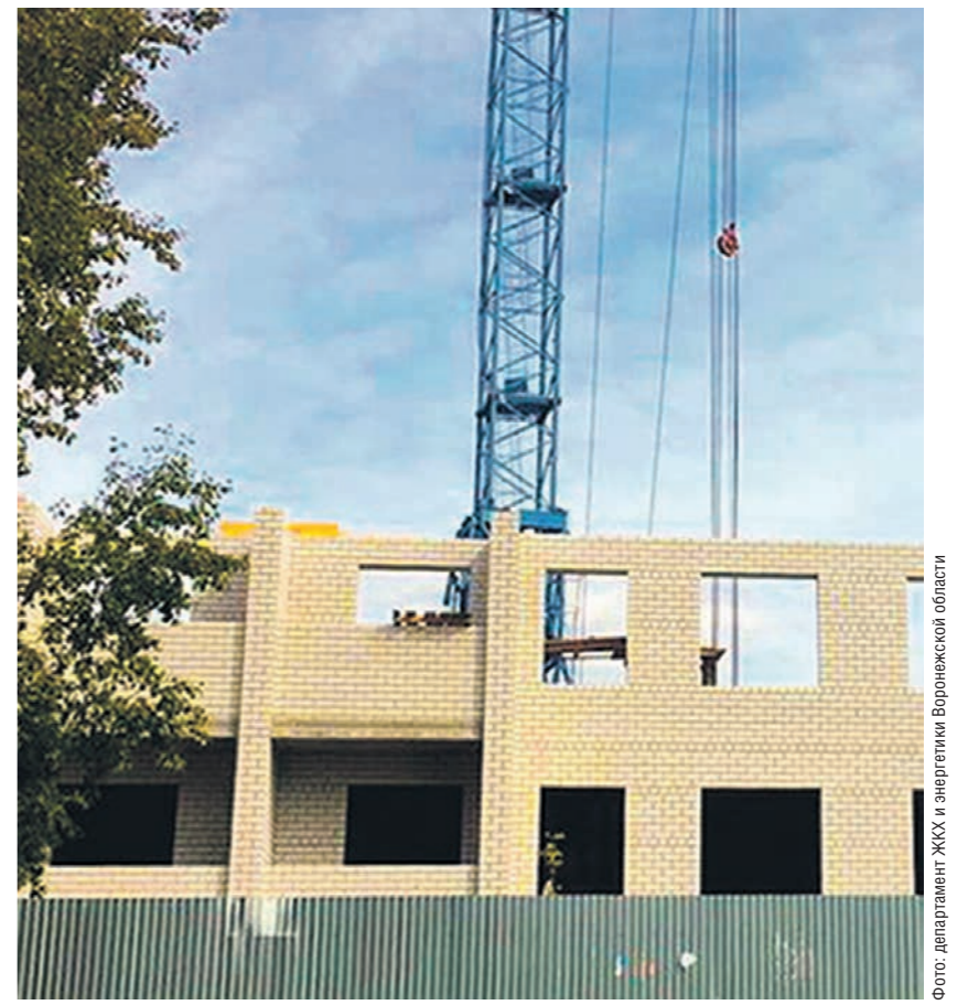
В Россоши полным ходом идёт строительство пятиэтажного дома. В следующем году сюда планируется переселить сразу 46 семей из пяти аварийных построек

М.З.: Один из них — проект «Чистая вода». Сегодня мы реконструируем 10 объектов по водозаборным сооружениям, общая сумма пред-