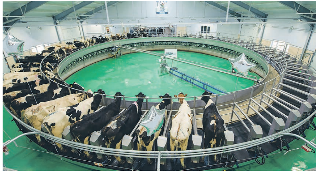
Благодаря господдержке воронежские аграрии имеют возможность использовать передовые технологии

М олочное скотоводство является одной из важнейших подотраслей сельского хозяйства. Население должно быть обеспечено молоком и молочными продуктами, при этом поставки продуктов не должны зависеть от импорта. Однако на пути развития молочного сектора АПК есть и сложности. В первую очередь, это привлечение инвестиций. Вместе с экспертом «Коммуна» разобралась, как Господдержка позволит обеспечить импортозамещение молочной продукции и поможет развитию воронежского села.