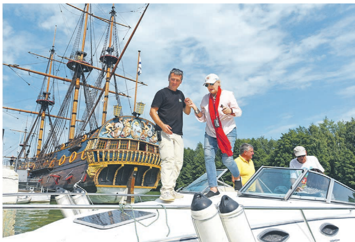
Светлана Дружинина впервые увидела «Гото Предестинация» несколько лет назад и сразу решила, что снимет корабль в одной из своих картин

Светлана Дружинина родилась 16 декабря 1935 года (85 лет). Советская и российская актриса, кинорежиссёр, сценарист, народная артистка РФ. На заре своей карьеры Светлана Сергеевна снялась в таких фильмах, как «Дело было в Пенькове» и «Девчата». В 70-х годах Дружинина становится режиссёром. Среди её работ картины «Сватовство гусара», «Принцесса цирка» и, конечно, всенародно любимые «Гардемарины».