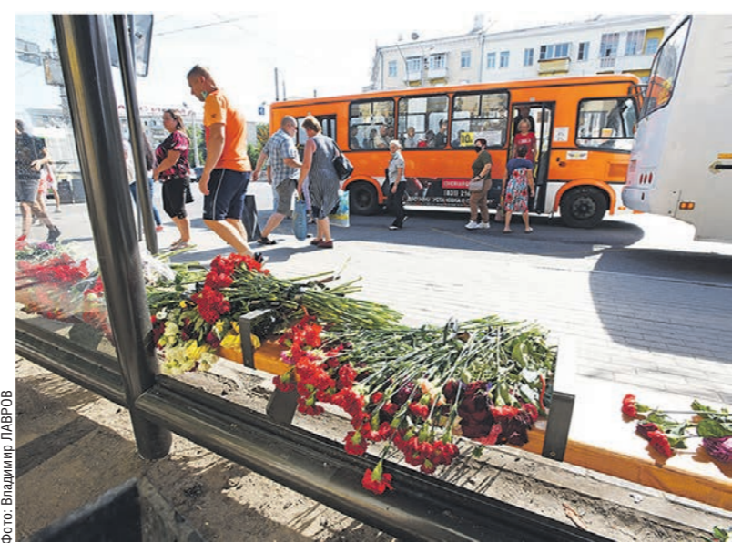
Материалы подготовили Алексей ЛУГОВСКИХ, Мария РЕПИНА, Ольга ФИШБЕЕН.

Следственный комитет возбудил уголовное дело по п. «в» части 2 ст. 238 УК РФ — оказание услуг, не отвечающих требованиям безопасности. К расследованию подключился Национальный антитеррористический комитет России. Но пока ни одна из существующих версий не получила окончательного подтверждения.