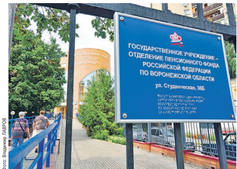
Несмотря на повышение пенсионного возраста, некоторые категории граждан могут рассчитывать на выплаты от государства, начиная с 50 лет

В 2028-м, когда пенсионная реформа будет завершена, страховую пенсию по старости женщины смогут оформить по достижении 60-летнего возраста, мужчины — 65 лет.