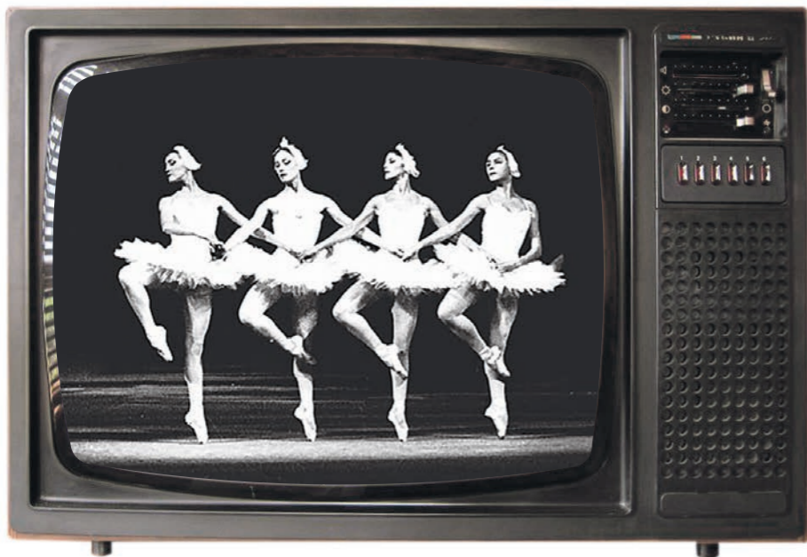
Одним из символов путча стала трансляция балета «Лебединое озеро» по телевизору