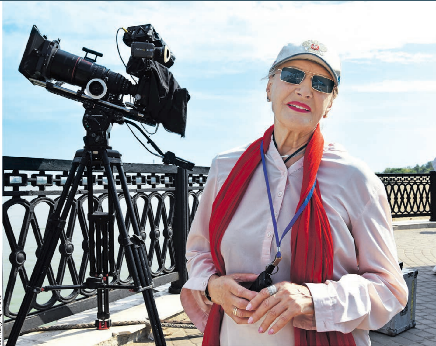
Режиссёр «Гардемаринов»: «Мойм главным сценаристом и консультантом стал сам Суворов»

— Я работаю по историческим документам, все фильмы основаны на фактическом материале. Это не просто посмотреть и удивиться, это практически школьная программа. Мой самый главный сценарист и консультант — сам Суворов. У него есть дивные книги, например, «Наука побеждать». И если говорить о Кинбурнском сражении, о котором и идёт речь в фильме, у Суворова было семь отчётов перед Потёмкиным, вот мы и снимаем так, как он написал. Бой в Крыму, всё в дыму, ничего не видно. И это очень нам помогает в батальных сценах (смеётся). Мы