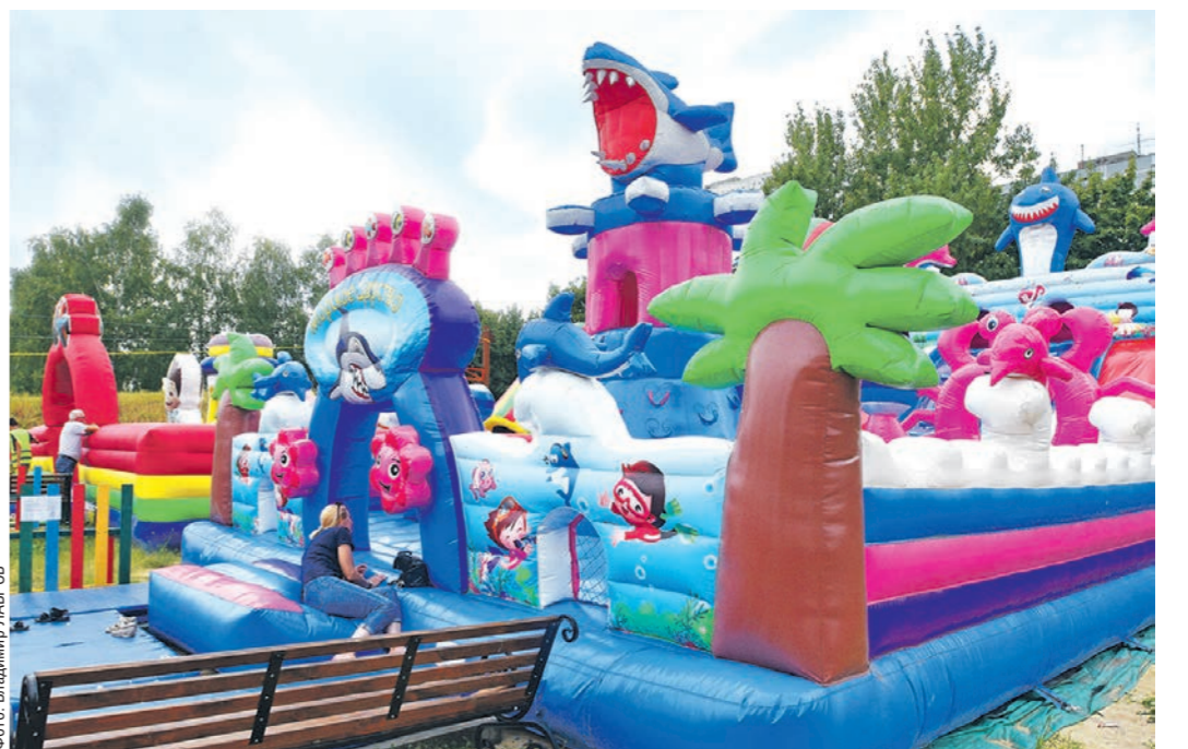
Насколько надувной батут соответствует требованиям безопасности, будут выяснять следователи

Несмотря на все предпринятые меры, юные воронежцы регулярно травмируются на батутах. По данным регионального де-