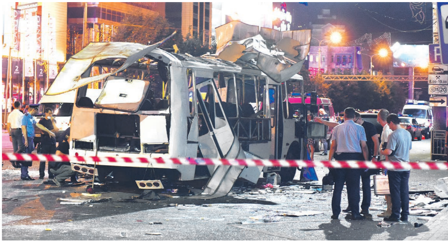
Причина взрыва в воронежской маршрутке до сих пор не установлена

Прибывшие на место вскоре после взрыва машины скорой помощи доставили пострадавших в городские больницы, четверым госпитализация не потребовалась. Вскоре прибыли эксперты и взрывотехники ФСБ. Следственные действия продолжались в течение нескольких часов. Эксперты тщательно изучили то, что осталось от взорвавшегося ПАЗика, собрали и упаковали улики — разлетевшиеся вокруг металлические части и фрагменты обшивки автобуса. Затем, по просьбе следственных органов, на место подогнали точно такой же автобус, который эксперты осматривали со всех сторон и изнутри.