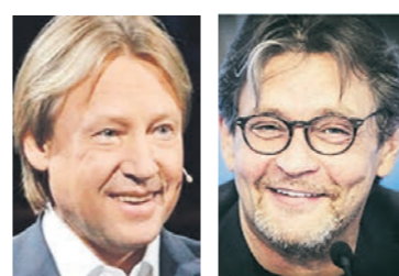
Дмитрий Харатьян Александр Домогогаров

используем много дыма, поэтому современные пейзажи можно прикрыть.