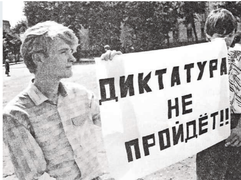
Один из первых пикетов на площади Ленина. Утро 19 августа 1991 года

Вечером 19 августа в типографии мехзавода был отпечатан экстренный выпуск городской газеты «Воронежский ку-