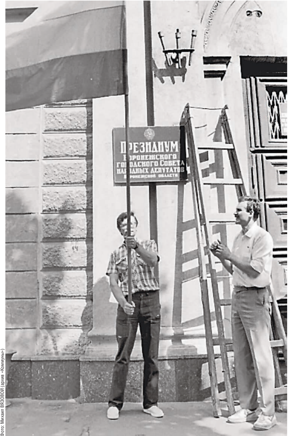
22 августа 1991 года в Воронеже советские флаги поменяли на российский триколор

19 августа у Белого дома, стоя на танке, Ельцин зачитал «Обращение к гражданам России» и призвал «дать достойный ответ путчистам». Ночью 21 августа толпа блокировала восемь боевых машин Таманской дивизии. При попытке остановить колонну военной техники три человека погибли. К этому времени подчиняться указам ГКЧП отказалось большинство местных властей. Провал путча стал очевидным. Утром министр обороны Язов был вынужден дать приказ о выводе войск из Москвы. Во второй половине дня, после неудачной попытки заручиться поддержкой Горбачёва, Янаев подписал указ о роспуске ГКЧП. Все его члены, за исключением главы МВД Бориса Пуго, который застрелился, были арестованы.