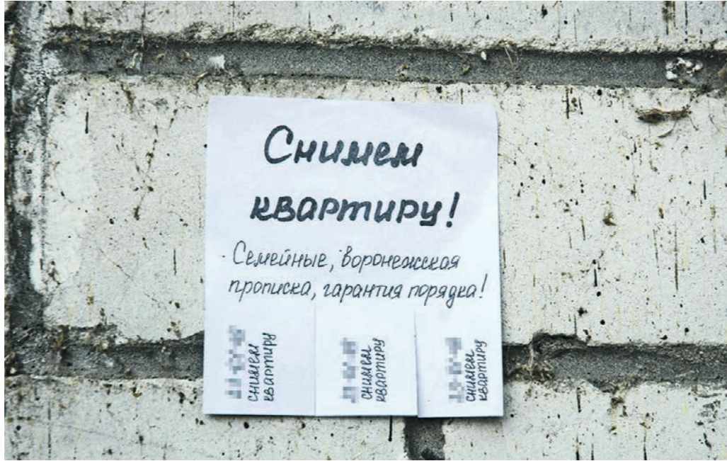
Цены на съёмное жильё в Воронеже за последние полгода выросли примерно на 7%

НЕДВИЖИМОСТЬ • Что происходит с воронежским рынком аренды жилья и кому неохотно сдают квартиры