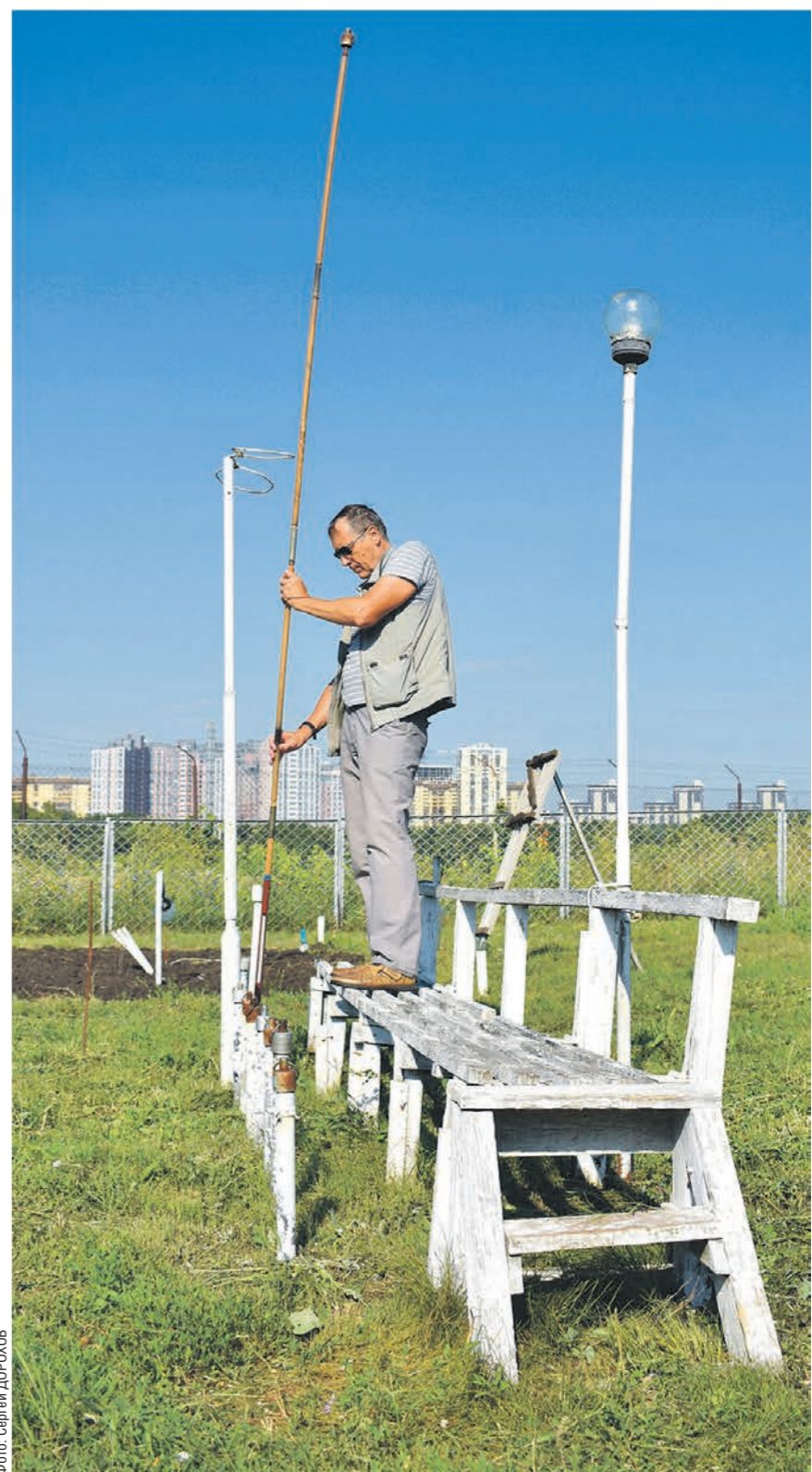
Метеорологи проверяют температуру не только воздуха, но и почвы — эта информация особенно полезна коммунальщикам зимой

— Не зря ведь говорят, что погода переменчива, как девушка. Получить стопроцентный прогноз нельзя. Может пройти всего час, в атмосфере изменятся воздушные потоки, и вдруг пойдёт дождь там, где его вроде и быть не должно. С появлением спутников за-