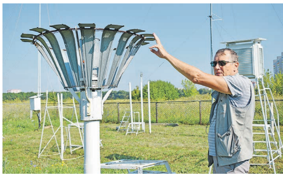
С помощью этого прибора метеорологи определяют количество выпавших осадков

О том, как в ближайшие годы изменится климат в Воронежской области, читайте на стр. 1