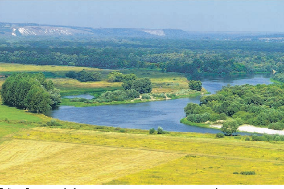
Районы Воронежской области имеют различные сырьевые и географические характеристики, и чем теснее будет их сотрудничество, тем выше потенциал развития

АНАЛИТИКА • Как может сказаться на развитии региона процесс укрупнения муниципальных районов