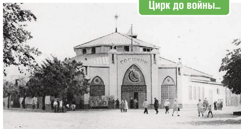
Цирк до войны...