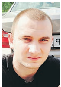
Фото подозреваемого в преступлении

СК и полиция распространили официальную ориентировку