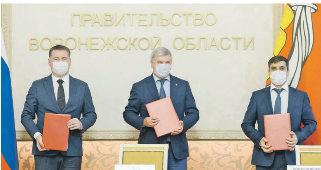
ВГЛТУ заключил трёхстороннее соглашение с правительством Воронежской области и компанией «Сибур»

— Конечно, взгляды меняются в зависимости от поставленных задач. Для студента главная задача — получение знаний, сдачи сессии. Для молодого преподавателя — подготовка к лекциям. Затем — защита кандидатской диссертации, докторской диссертации. За то время, пока человек находится в университете, он получает огромные знания обо всей структуре вуза, обо всех его подразделениях. На каком-то этапе осознаёт, что всё, что есть в жизни, ему дал университет. Значит, наступает время, когда надо отдать ему должное — поделиться своим жизненным опытом, знаниями, навыками. И продолжить воспитание студентов. На мой взгляд, этот процесс во многом созерцательный. Мы смотрим на них, реагируем на удачу и ошибки, а они правильно оценивают нашу заботу, внимание и учатся так же поступать с другими людьми в своей дальнейшей жизни.