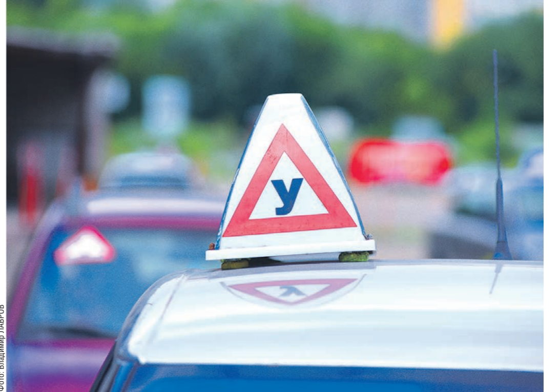
По статистике, с первого раза сдают на права единицы, а количество ДТП с участием начинающих водителей только растёт

— Если один из десяти наших учеников сдаст экзамен с первого раза, то это хорошо, — рассказал «Комму-