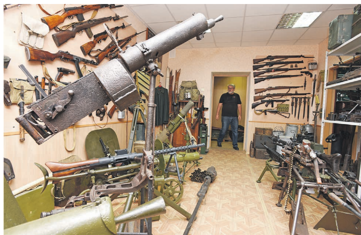
В музее Евгения Куцева собраны сотни экспонатов из разных эпох. Отдельный зал посвящён всевозможным видам оружия