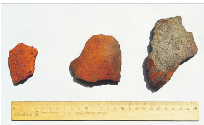
Возраст и принадлежность артефактов предстоит выяснить археологам

Спорткомплекс в Новой Усмани будет состоять из двух частей: 25-метрового плавательного бассейна на восемь дорожек и универсального спортивного зала, который рассчитан на занятия физкультурой и игровыми видами спорта. В подвале разместят зал аэробики, тренажёрный зал, а также зал для борьбы и восточных единоборств.