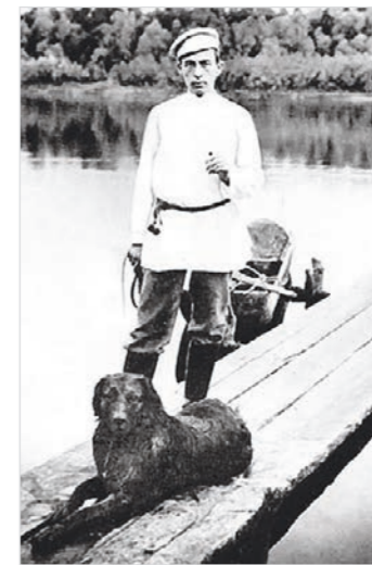
Сергей Рахманинов с собакой Левко на пристани Хопра в селе Красном