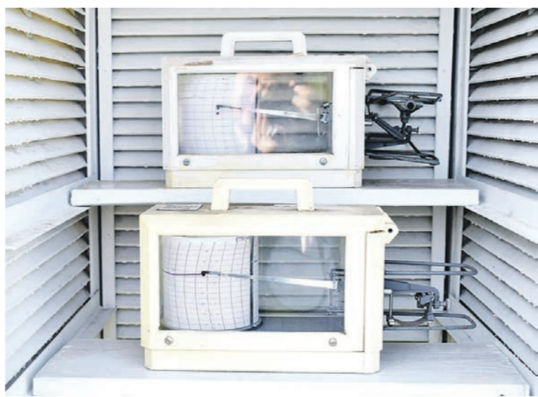
Специальный самописец фиксирует малейшие колебания температуры