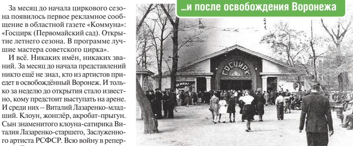
...и после освобождения Воронежа

В 1929 году Воронежский цирк носил имя Семёна Будённого. Дело в том, что в то время на манеже можно было увидеть много конных номеров. А Будённый как любитель лошадей помогал в их приобретении и дружил со многими цирковыми артистами.