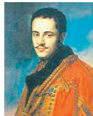
Николай Николаевич Раевский-младший