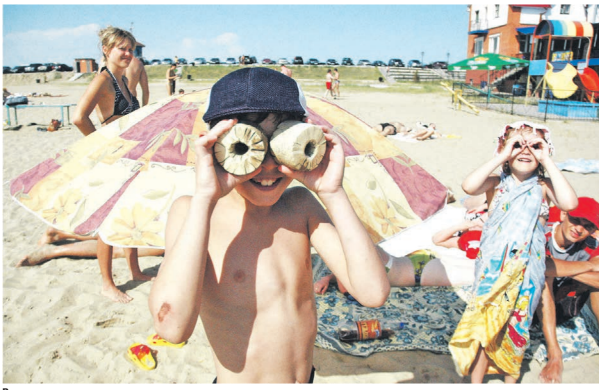
Воронежцам пора привыкать к изнурительному зною и другим аномальным для нашего региона погодным явлениям

В последнее время с погодой происходит что-то неладное. Зимы становятся теплее, а лето превращается для жителей умеренной климатической зоны в субтропический ад. В этом году оно запомнится воронежцам не только жарой, но и микро-смерчами и пылевыми бурями. В чём причина погодных аномалий?