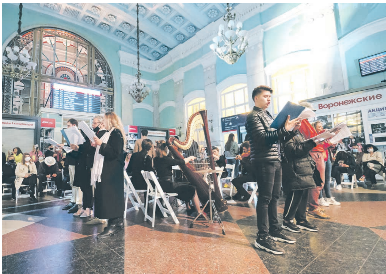
Холл вокзала стал идеальной площадкой для исполнения оперы «Жители родного города»

КУЛЬТУРА • Какими событиями запомнились первые дни Платоновского фестиваля