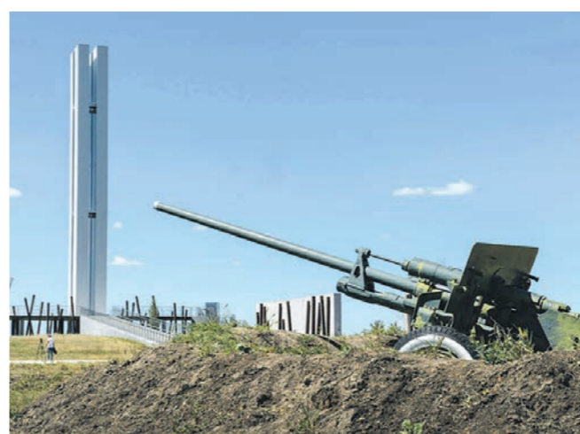
Любители военной истории смогут пройти по местам сражений и осмотреть находящиеся рядом высоты 197.0 и 158.0.