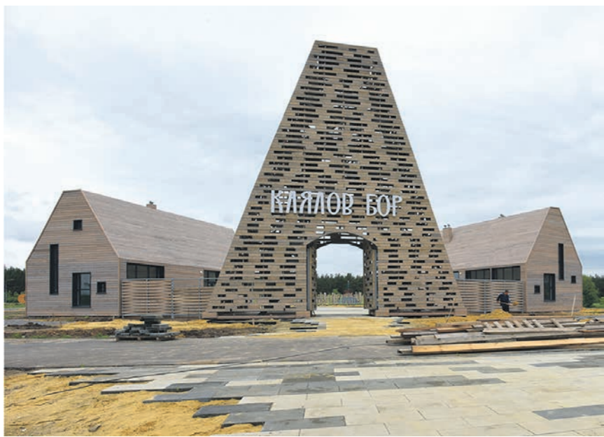
Уже этим летом экопарк «Каялов бор» встретит первых гостей и туристов

5 крестьянско-фермерских хозяйств района занимаются разведением КРС мясного направления. Там содержится 1149 голов.