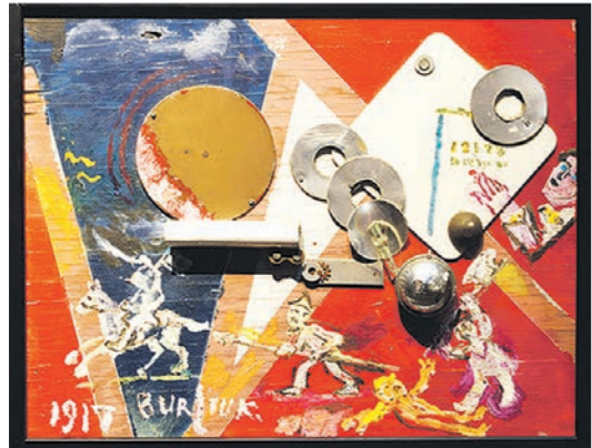
► Давид БУРЛЮК «Революция» (1917) У этого коллажа, сотворённого на фанере с помощью масла, стекла и круглых железок (судя по всему, намекающих на супрематические формы), тема серьёзная. Сквозь дурашливость изображения проступает мрачная аллегория резни. Её жертвой станет брат художника, поэт Николай Бурлюк: большевики расстреляют его в 1920 году как бывшего офицера.