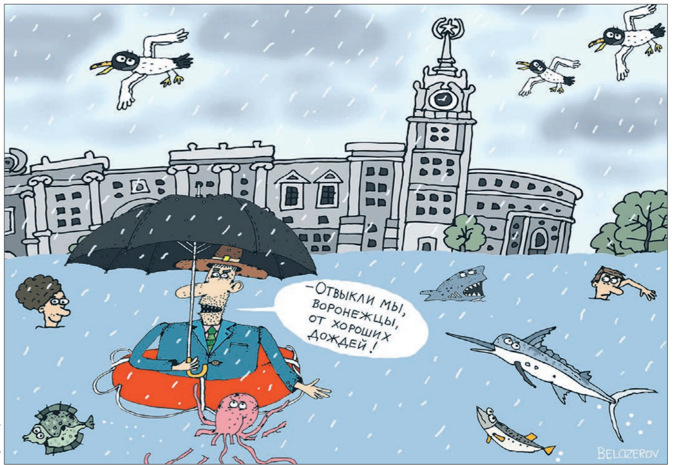
Рисунок: Сeryozha БЕЛОЗЕРОВ