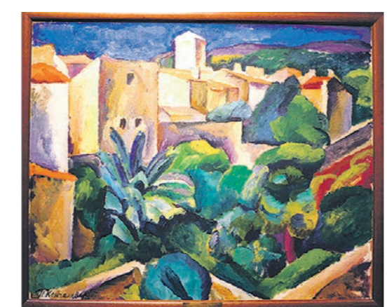
► Пётр КОНЧАЛОВСКИЙ «Кассис» (1913) В этом пейзаже манера Сезанна сочетается с элементами прото-кубизма. Хотя автор старался избежать нюансов, он довольно точно воссоздал атмосферу южного города.