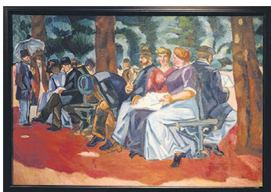
► Алексей МОРГУНОВ «Под розовой тенью» (1911) «Под розовой тенью» — пример влияния на русских художников французской живописи. Не каждый поймёт, изображены на картине москвичи или жители парижских предместий.