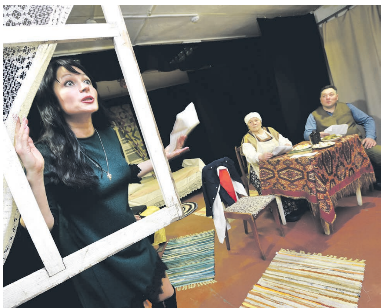
В труппе театра играют актёры от 3 до 70 лет. Это люди разных профессий: учителя, продавцы, сварщики, водители