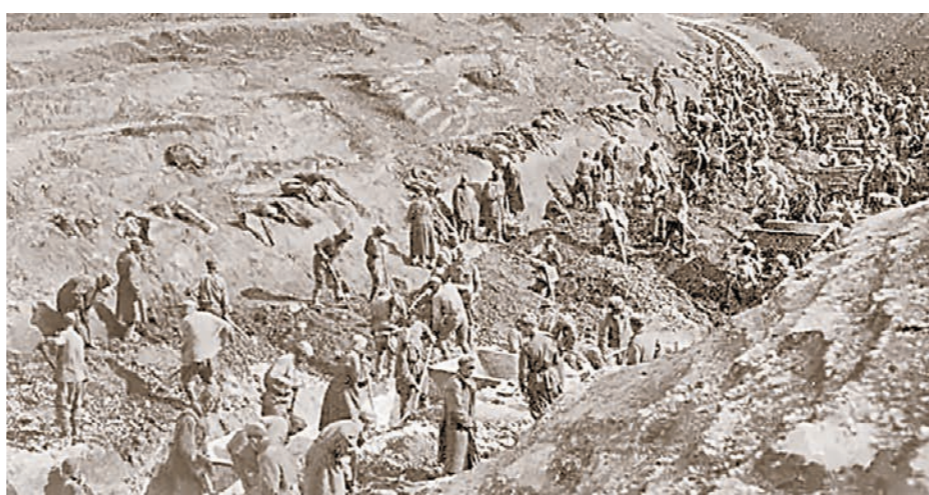
Советские военнопленные на строительстве «берлинки» (Гнилое — Евдаково). Осень 1942 года

Ежедневно от болезней, истощения и непосильной работы умирало несколько