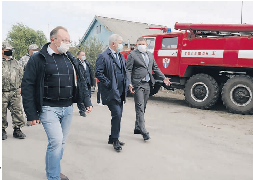
Губернатор Александр Гусев взял восстановление села под личный контроль