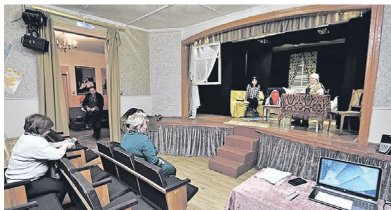
К репетициям актёры подходят ответственно: спешат в театр в любую погоду, несмотря на домашние хлопоты