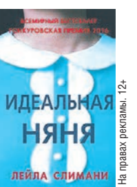
На правах рекламы. 12+