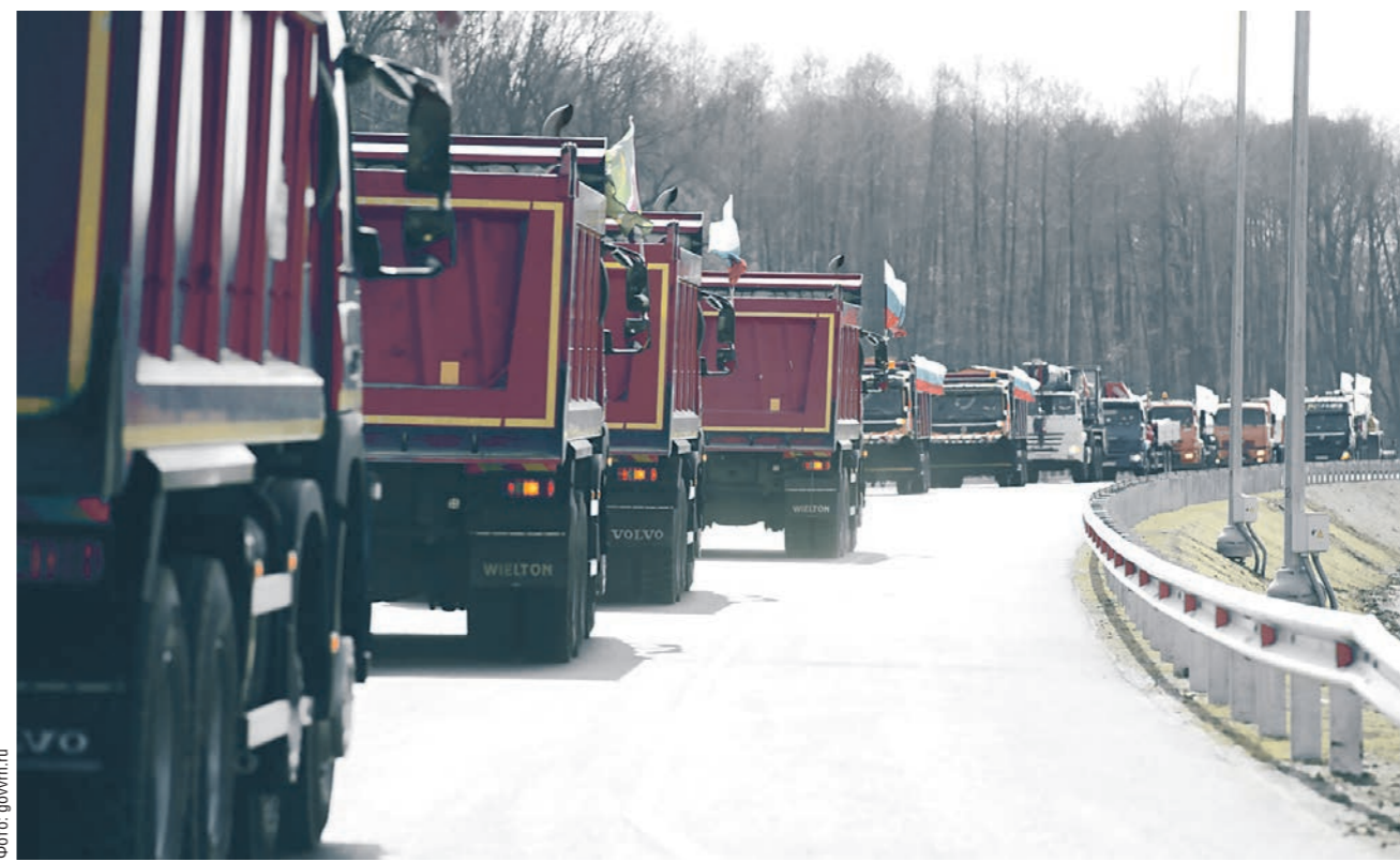
На минувшей неделе в Воронежской области произошло два события, которые призваны улучшить социально-экономическое положение региона: открытие крупного спортивного комплекса «Атом Арена» в Нововоронеже и запуск объездной автодороги вокруг Боброва.

Стоит отдать должное властям. Уже не первый десяток лет они пытаются хоть как-то расширить узкие места — то окружной автодорогой, то починкой виадуков и строительством крупнейшей развязки на Остужева, то это лишь вынужденные полумеры. Историческую планировку Воронежа с их помощью не объедешь. А для решительных мер — «резать, не дожидаясь перитонита» — нужны весьма серьёзные федеральные средства. И рейтинг Минстроя для нас — показатель значимый.