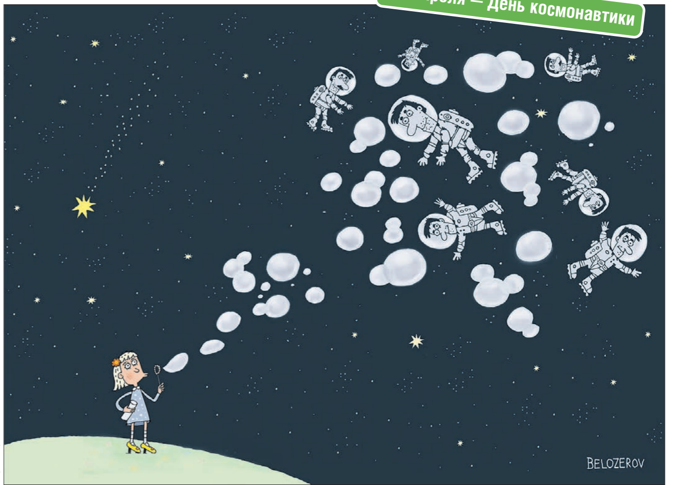
Рисунок Сергея БЕЛОЗЕРОВА