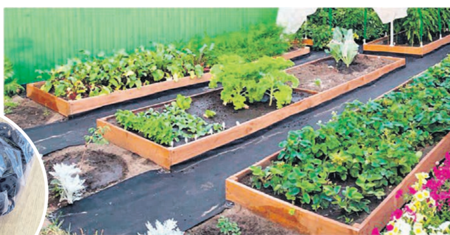
Дорожки из спанбонда выглядят эффектно и при этом обойдутся недорого

Теперь вы можете перекапывать и рыхлить грядки, не боясь того, что земля попадёт в проход, – мусор легко убирается веником или метлой. Если пойдёт дождь, дорожки будут выглядеть как новые. Спанбонд легко пропу-