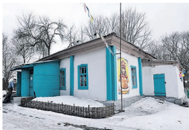
Здание земской школы, где сейчас расположен клуб и проходят спектакли, было построено более 100 лет назад